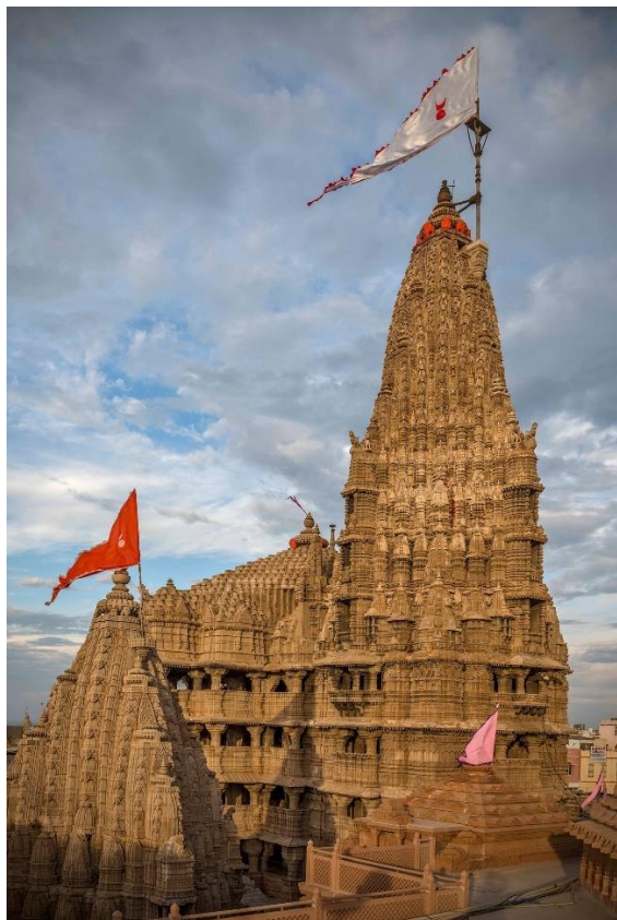
Nageshwar temple (lingam di luce)