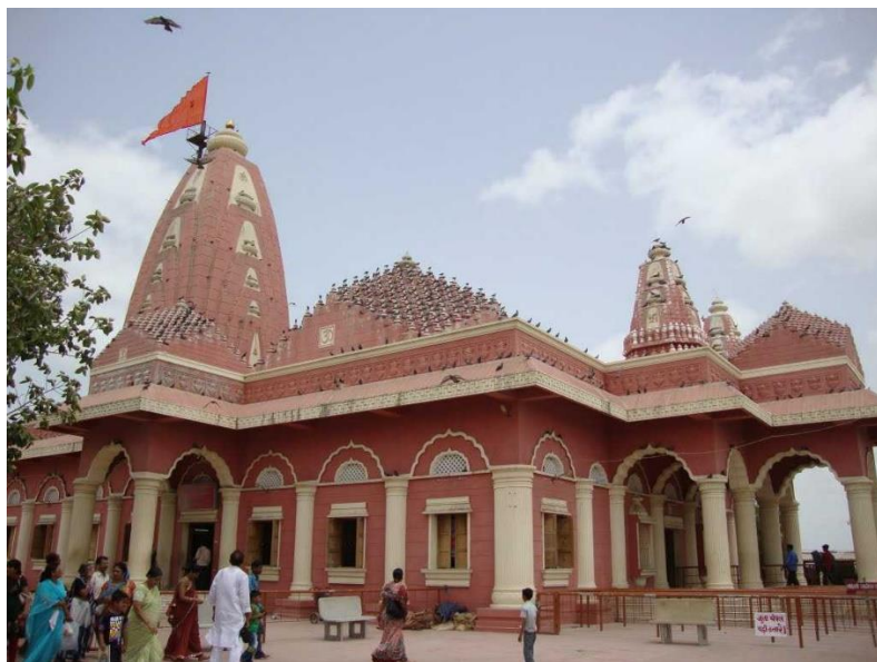
Luogo dove Krishna ha lasciato il corpo (Bhalka Tirth)