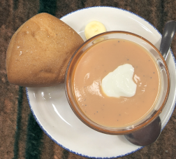
Crème navets et érable - 5