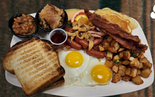
Déjeuner des sucres - 22

2 OEUFS, SAUCISSE COCKTAIL ET JAMBON À L'ÉRABLE, BACON, FÈVES AU LARD, CIPAILLE, OREILLE DE CRISSE, POMMES DE TERRE RISSOLÉES, CRÊPES, SIROP D'ÉRABLE. SERVI AVEC CAFÉ