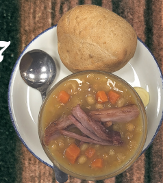
Soupe aux pois et jambon - 7