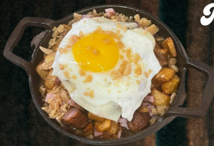
Régional de la cabane - 18

POMMES DE TERRE RISSOLÉES, SAUCISSE DE LA FERME FOURNIER, JAMBON, BACON, SAUCISSE PORC ET BOEUF, SAUCE HOLLANDAISE À L'ÉRABLE, DE SUCRE DUR ET OEUF. SERVI AVEC FRUITS, RÔTIÉS ET CAFÉ