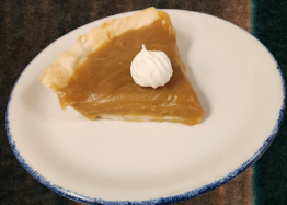
Tarte au sirop d'érable - 5