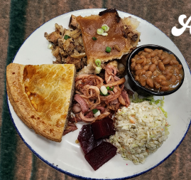
Assiette coureur d'érable - 19

CIPAILLE, PÂTE À LA VIANDE, JAMBON À L'ÉRABLE, FÈVES AU LARD, SALADE DE CHOU, BETTRAVES.