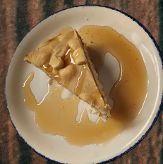
Gâteau sucre à la crème et érable - 5