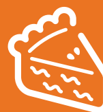
Tarte au sucre