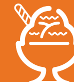
Glace à la vanille avec coulis