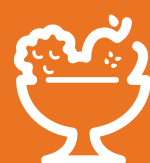
Salade de fruits