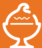
Pouding au chocolat