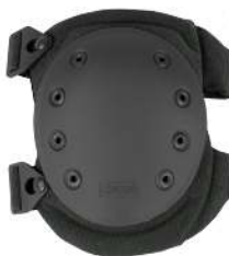
RODILLERA KP2 CONDOR