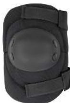
CODERA EP1 CONDOR