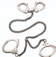
MODEL 1950 - RESTRAINT CHAIN