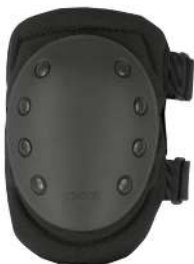
RODILLERA KP1 CONDOR