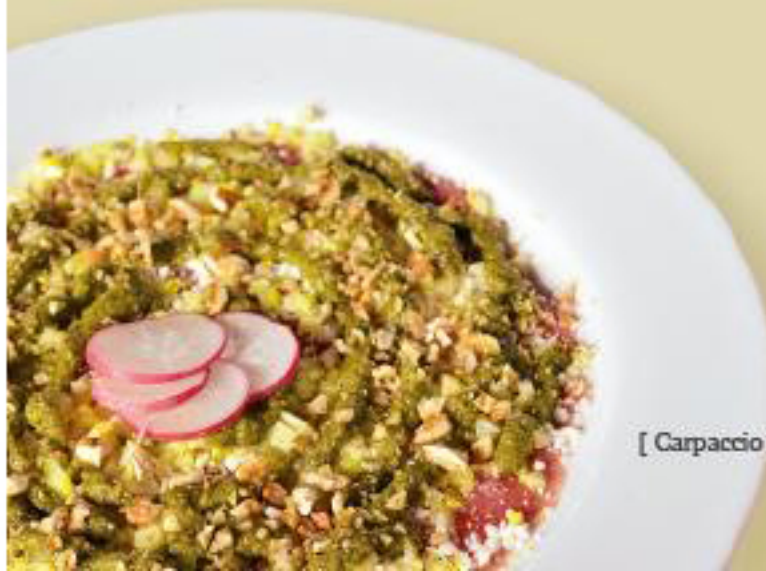
[ Carpaccio di Tonno ]