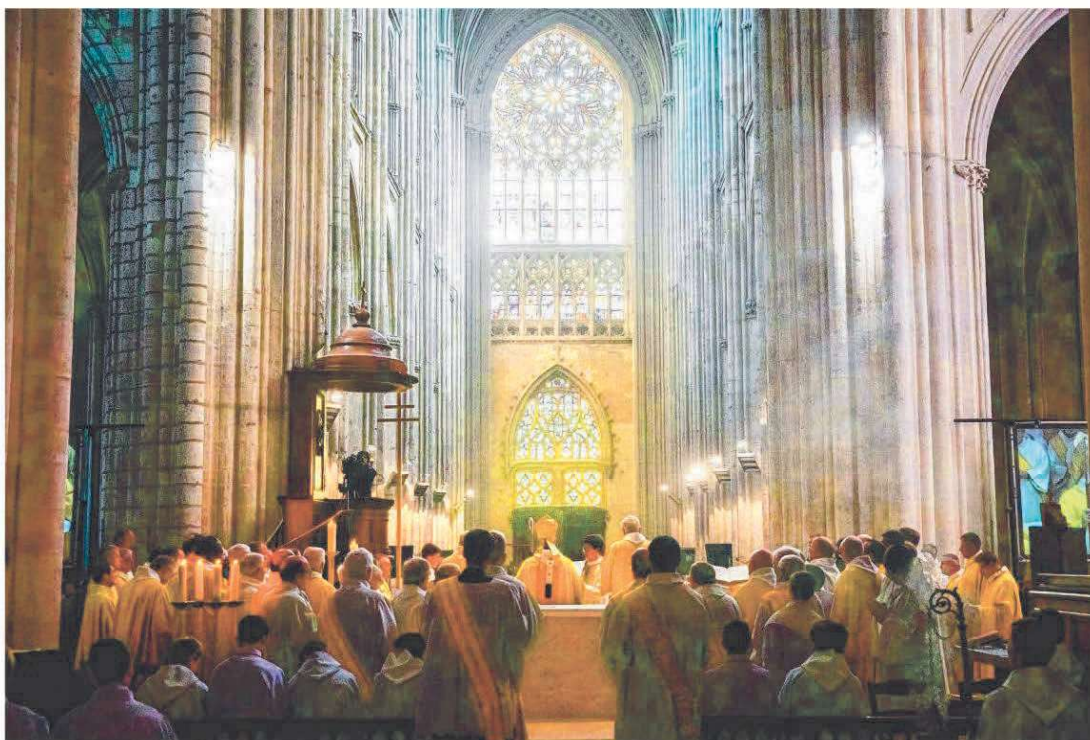
Fin décembre, le diocèse de Tours a versé 125.000 euros pour indemniser les victimes de pédocriminalité dans l'Église.