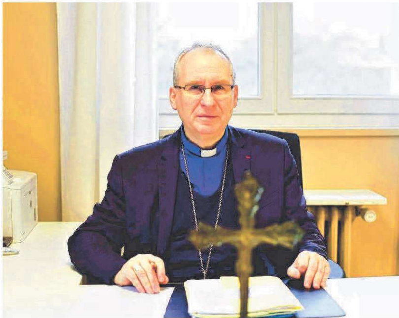
Monseigneur Vincent Jordy est l'archevêque de Tours depuis novembre 2019.

Les victimes seront indemnisées par le fonds de Secours et de lutte contre les abus sur mineurs (Selam), après approbation de leur demande par l'Instance nationale indépendante de reconnaissance et de réparation (Inirr). Fin décembre, le diocèse de Tours a abondé le fonds Selam