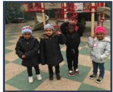
Gracias a Crochet para niños por hacer y donar hermosos sombreros cálidos para los estudiantes de los Centros de Pre-K del Distrito 30!