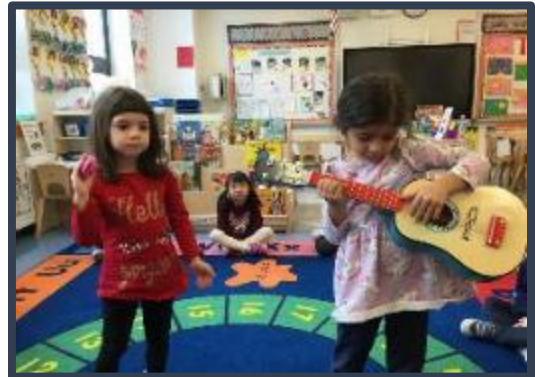
Estudiantes de 972 aprendieron mucho sobre flamenco & tango