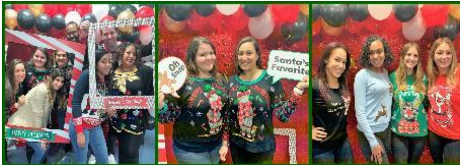
Día del suéter feo

Nuestro PTA organizó otra noche de cine. Los estudiantes y las familias regresaron a la escuela para disfrutar de una película el viernes por la noche.