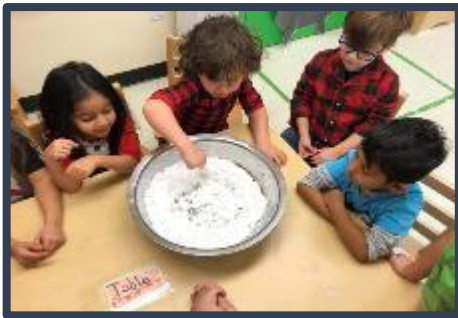
Estudiantes de TCU aprendieron sobre invierno y nieve!