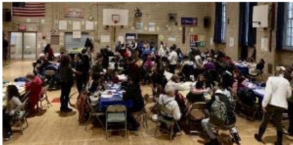
Informática para todos

¡Diversión familiar! Las familias hicieron globos de nieve, adornos y platos de dulces.