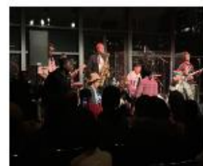
Lincoln Center PS 111Q Scholars and families enjoying the live band at the Lincoln Center