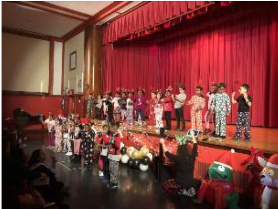
Asamblea de compromiso familiar.

En diciembre, organizamos nuestra primera asamblea para las familias de nuestros estudiantes. Los alumnos de primer y tercer grado prepararon espectáculos de danza y arte para sus padres y familiares.