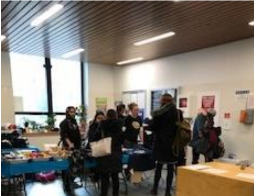
PTA vende mercancía de P.S. 11