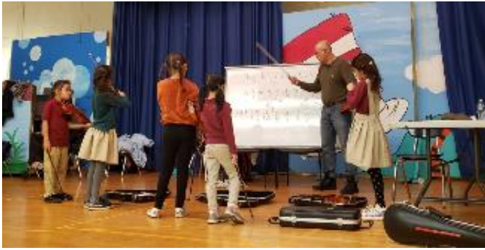
Práctica de violín