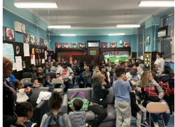
Noche de cine familiar

En diciembre, organizamos nuestra primera asamblea para las familias de nuestros estudiantes. Los alumnos de primer y tercer grado prepararon espectáculos de danza y arte para sus padres y familiares.