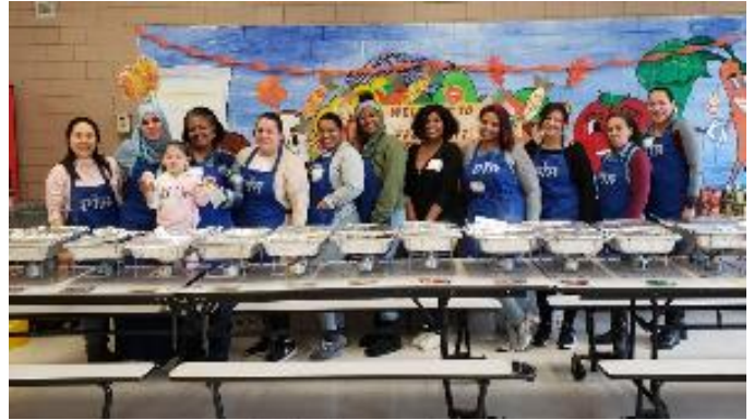
Voluntarios en la fiesta de Acción de Gracias