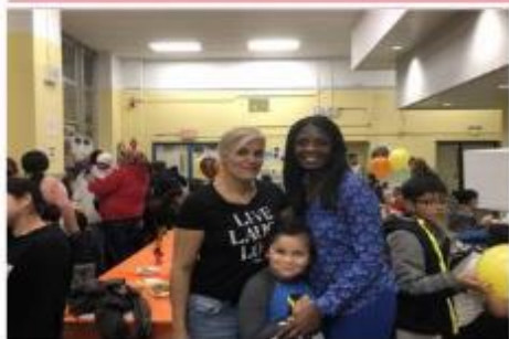
Community School 111Q had a Fall Festival Family Pot Luck in partnership with Voice Charter School. Families from both schools enjoyed an evening of good food, dancing and games.

COMMUNITY SCHOOL 111Q JACOB BLACKWELL Celebrated December with Sustaining Cultural Responsiveness