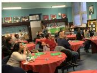
Principals Breakfast Families attending our bi monthly Principals Breakfast. In this forum families learned about NYC Kids Rise Save for College Program and the dangers of vaping and E-Cigarettes. Ending with an scraping Booking session that infused the importance of Literacy.