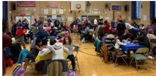
Día de universidad y carrera

El equipo de tecnología de P.S. 2 visitó las aulas para informar a los estudiantes sobre esta iniciativa, y los maestros de STEM y tecnología crearon actividades para todos los estudiantes.