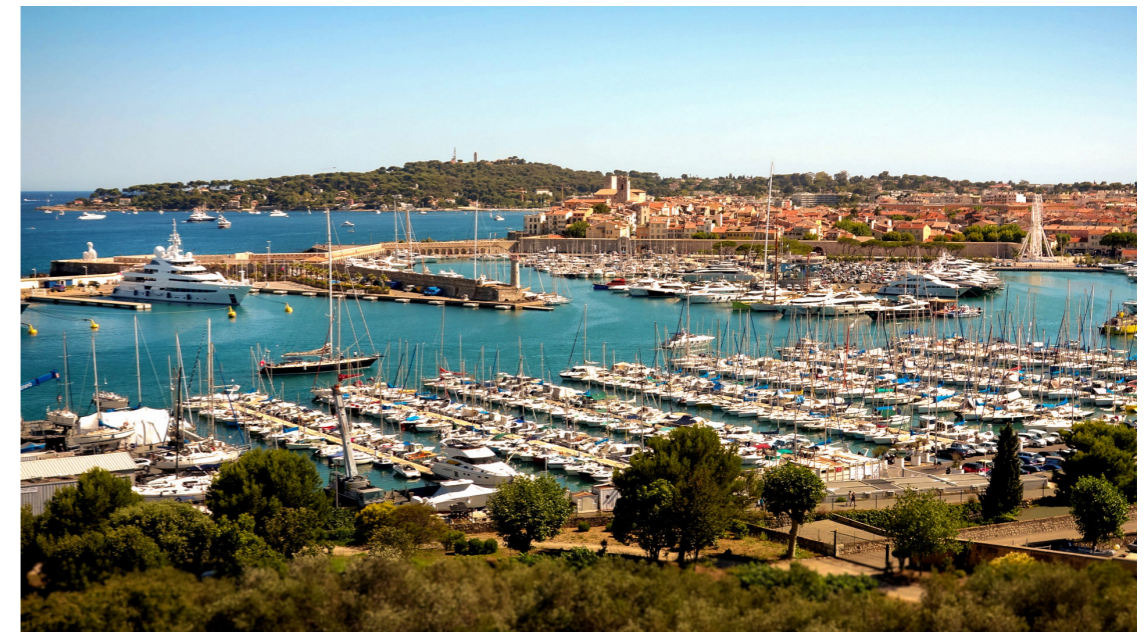
Port Vauban, Antibes

Antibes liegt im Herzen der Côte d'Azur, mit dem Nationalpark Mercantour im Norden und dem Mittelmeer im Süden und weniger als 30 Minuten vom internationalen Flughafen Nizza entfernt. Antibes ist eine der bemerkenswertesten Städte dieser weltbekannten Küstenregion. Die Stadt ist reich an Geschichte, Teile der Altstadt stammen aus dem 16. Jahrhundert und Antibes beherbergt das berühmte Picasso-Museum, zahlreiche Strände und viele beliebte Attraktionen an der französischen Riviera.