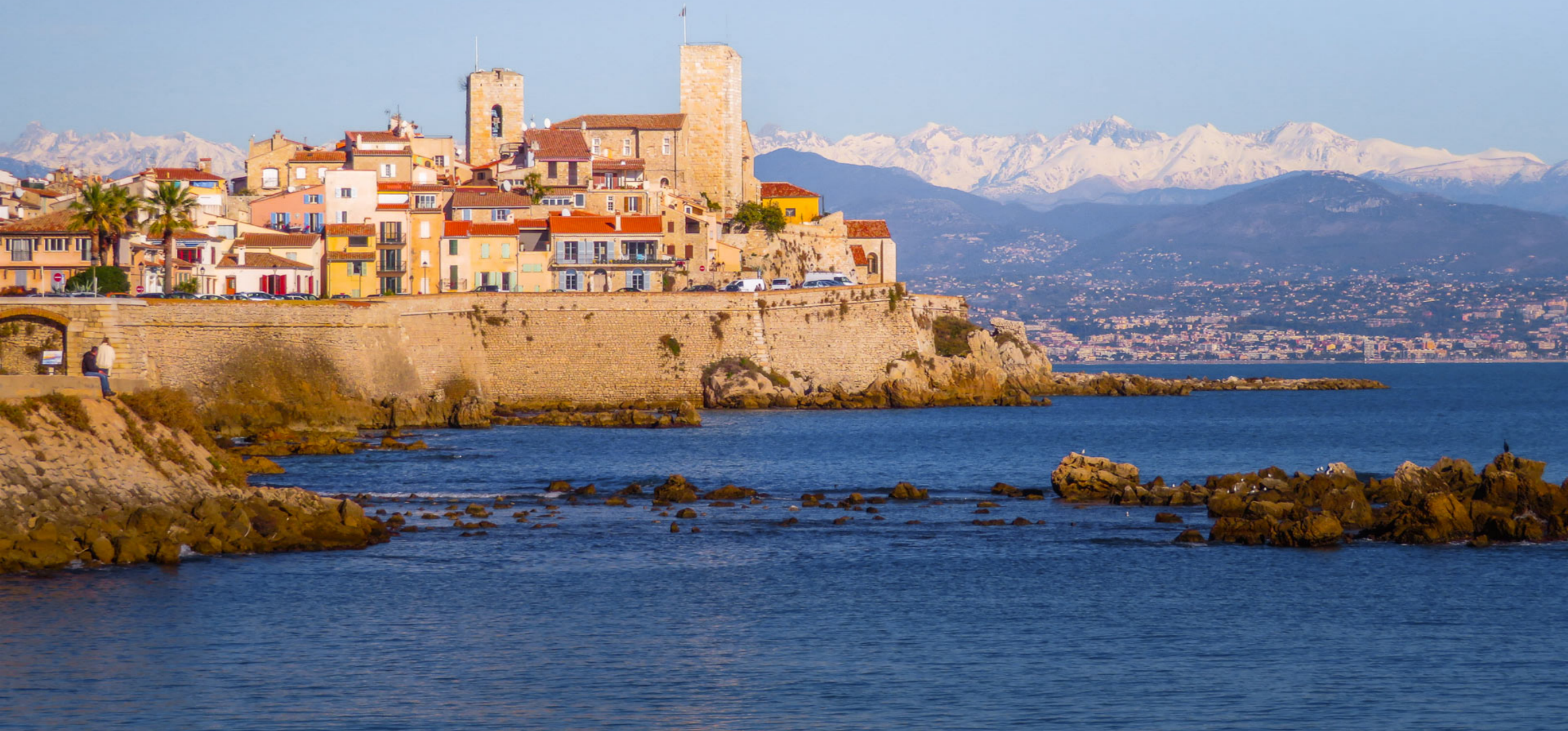
Les Remparts, Antibes