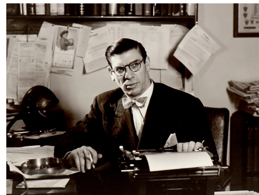
Paul Gallico at home, Antibes 1948

No. 10 Rampe des Saleurs ist ein bedeutendes historisches Gebäude. Teile davon stammen aus dem 16. Jahrhundert. Aus dem ursprünglichen Fischerhaus wurde im Laufe der Jahrhunderte eine Herberge vieler kultureller und künstlerischer Ikonen, darunter der gefeierte Autor Paul Gallico, der dort über 50 Jahre lang lebte und arbeitete.