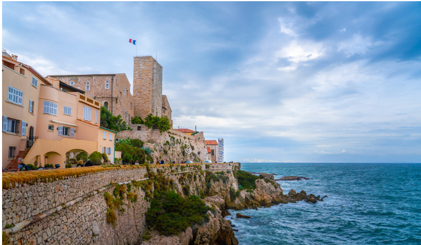
Les Remparts, Antibes