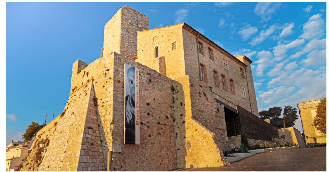
Musée Picasso, Antibes