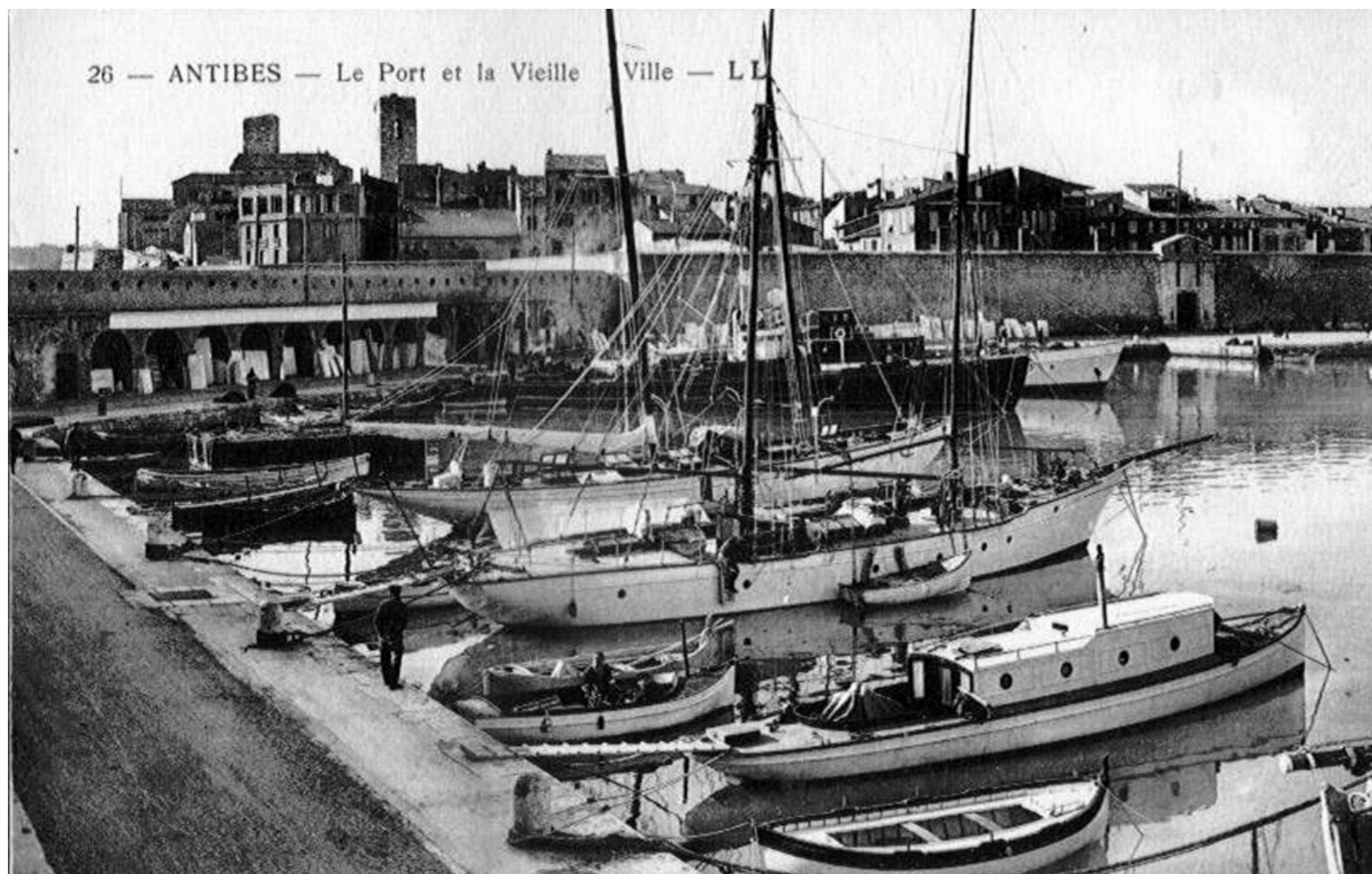
Antibes, c. 1890

No. 10 Rampe des Saleurs is a significant historical building, with parts of it dating back to the 16th Century. Originally a fisherman's house, the building has evolved over the centuries and has been home to many cultural and artistic icons, including the acclaimed author, Paul Gallico, who lived and worked there for over 50 years.