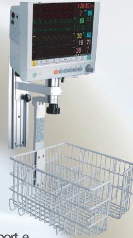
Montaje de pared