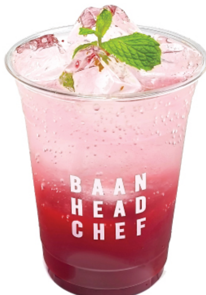
สตอเบอร์รี่ อิตาเลียน โซดา 90 THB STRAWBERRY ITALIAN SODA