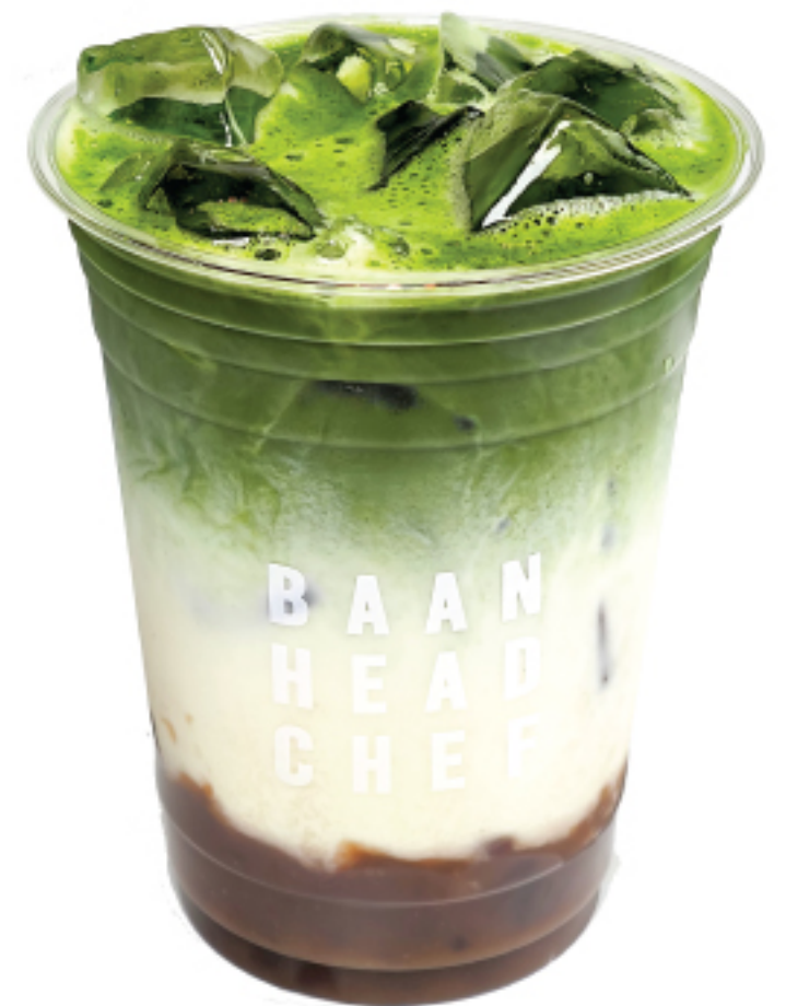
มัทฉะ ลาเต้ ถั่วแดง 195 THB MATCHA RED BEAN LATTE