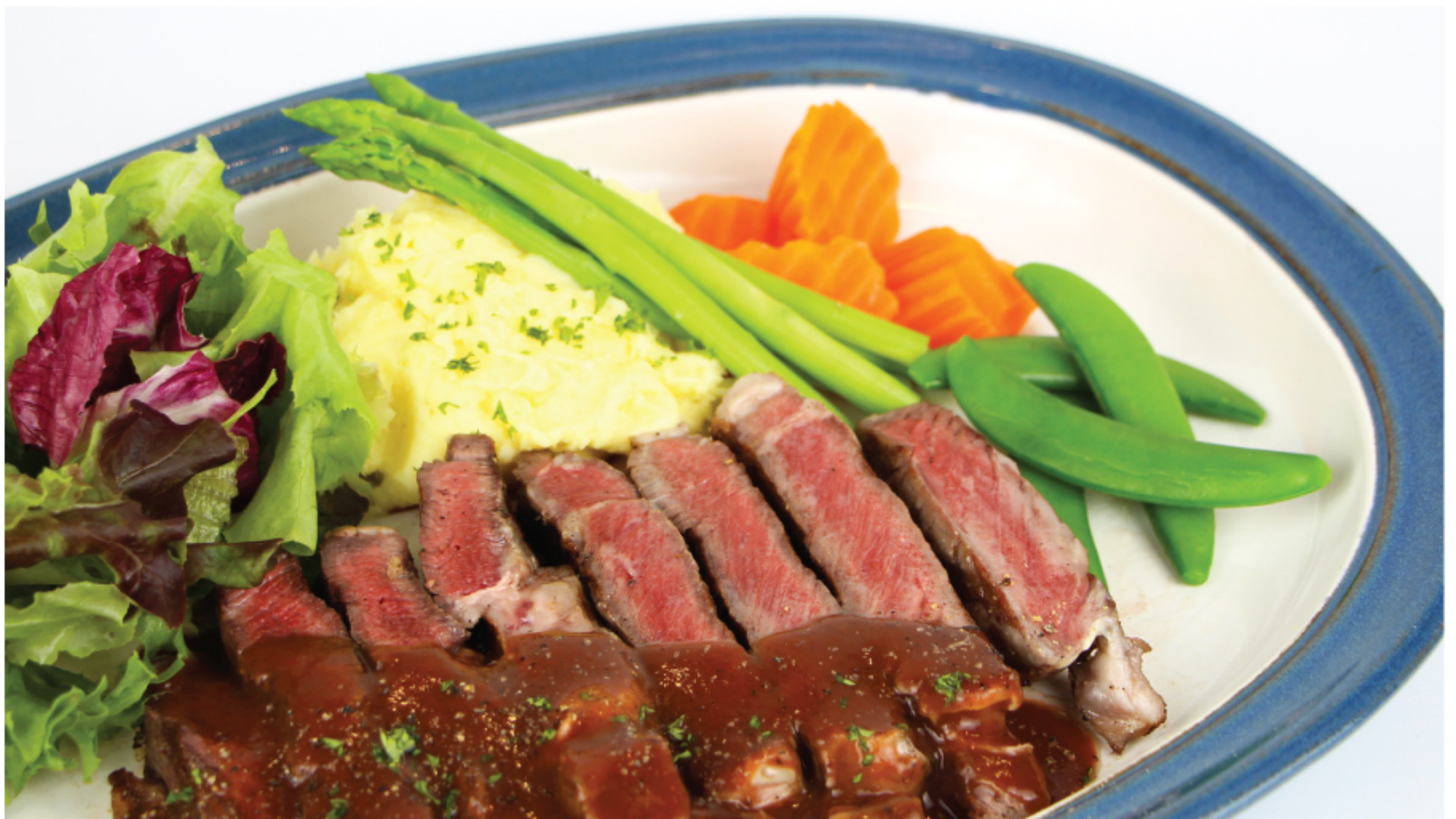
RIBEYE STEAK RED WINE SAUCE (AUSTRALIAN WAGYU 300 G) ริบอาย สเต็ก ซอสไวน์แดง (เนื้อออสเตรเลีย วากิว 300 กรัม) 1,250 THB

*ราคารวมภาษีมูลค่าเพิ่ม 7% แล้ว แต่ยังไม่รวม service charge 5%