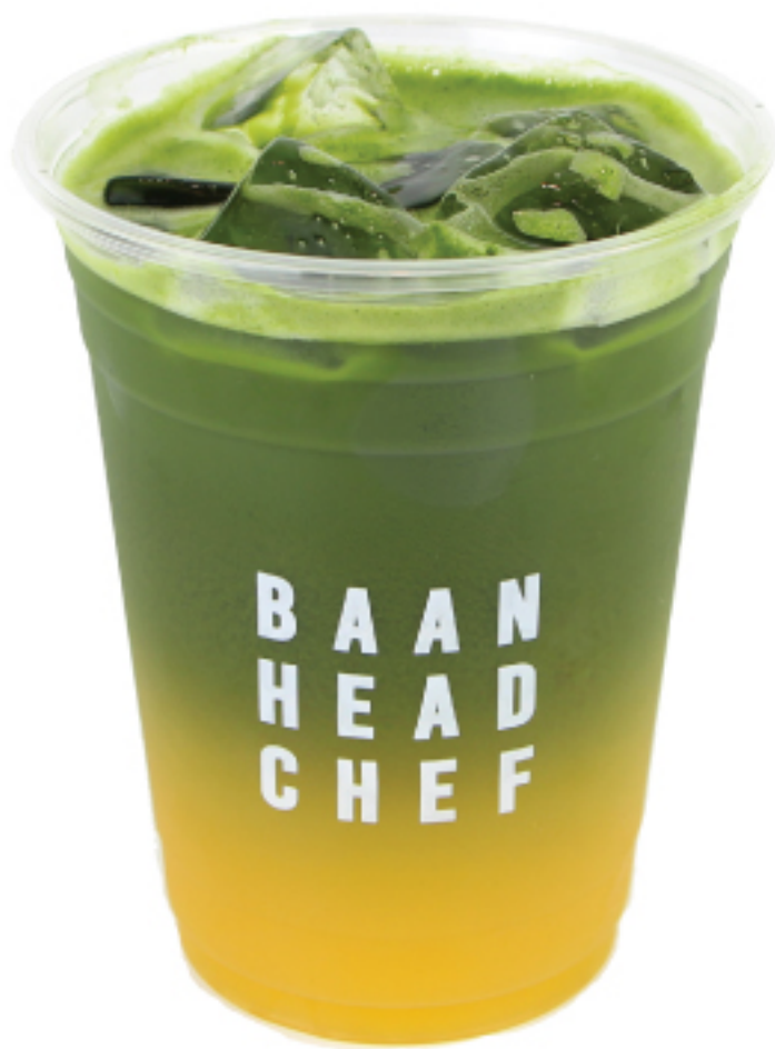
มัทฉะ ส้มยูซุ 195 THB MATCHA ORANGE YUZU