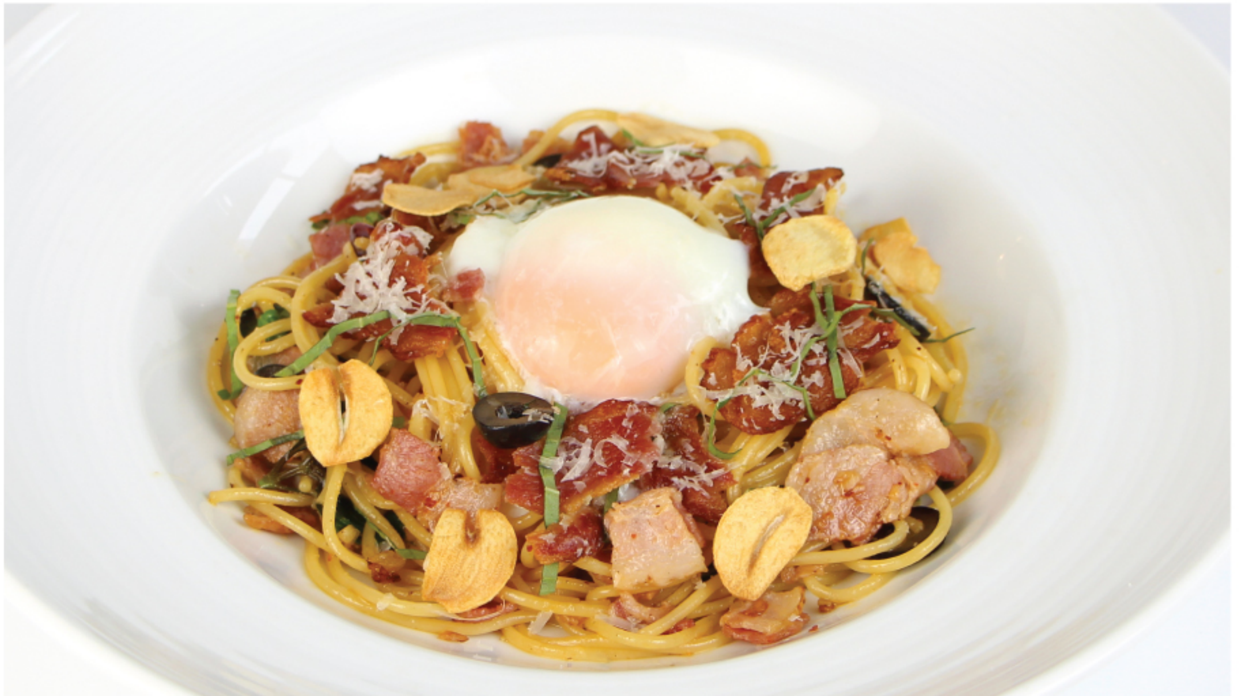
SPAGHETTI CHILI GARLIC BACON สปาเก็ตตี้ เบคอนพริกกระเทียม 250 THB