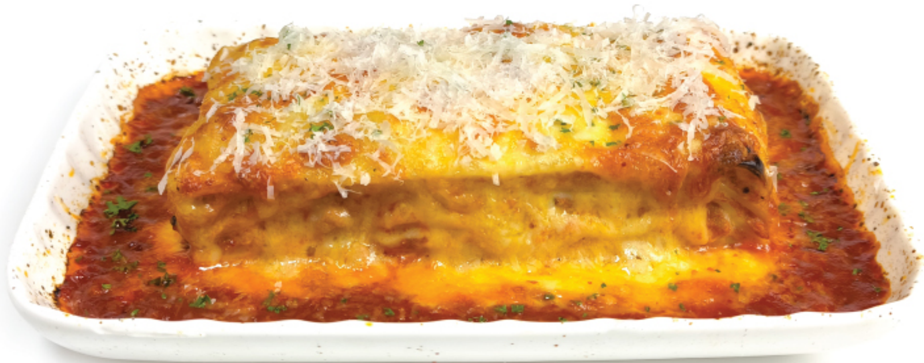
PORK LASAGNA (FRESH PASTA) ลาซานญา หมู (เส้นสด) 320 THB