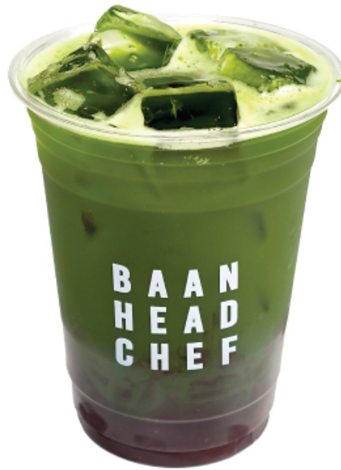
มัทฉะ สตรอเบอร์รี่ 195 THB MATCHA STRAWBERRY