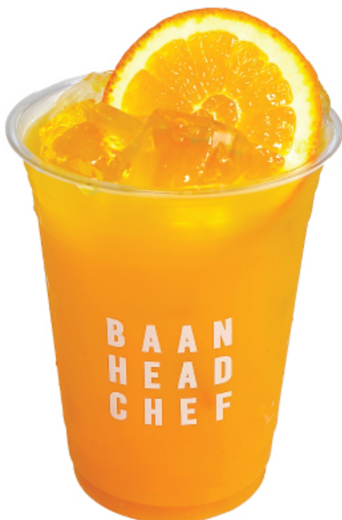
น้ำส้มคั้น 90 THB ORANGE JUICE