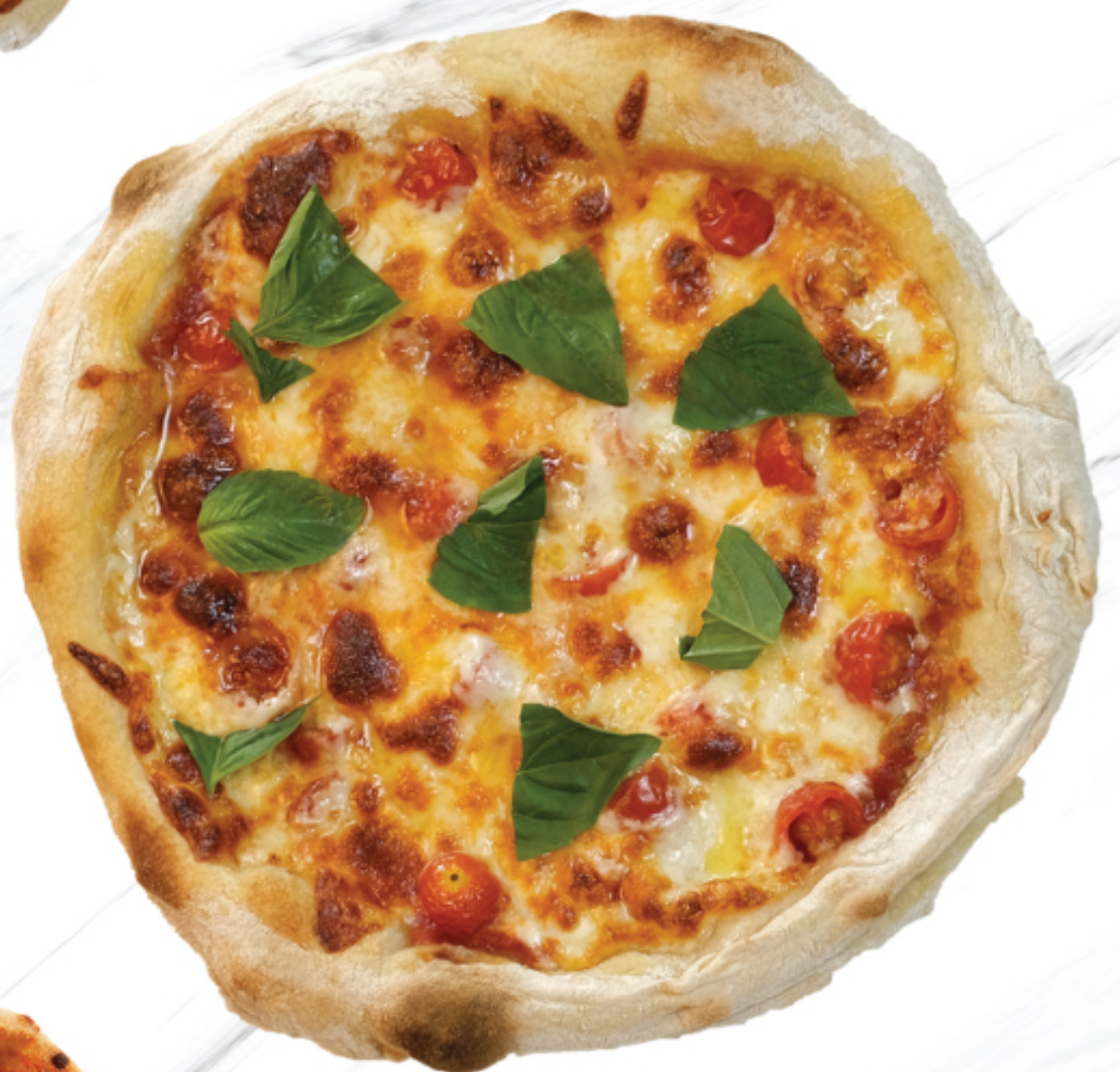
MARGHERITA PIZZA พืชซ่า มาร์การิต้า 320 THB