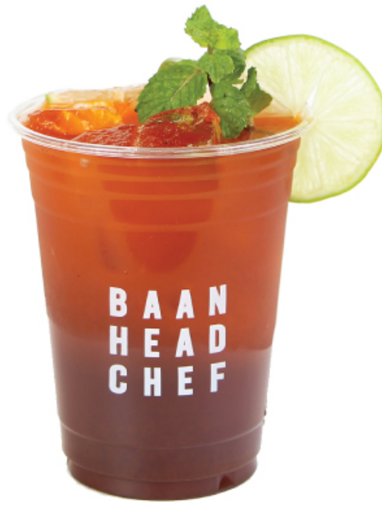
ชาลมอน 100 THB LEMON ICED TEA