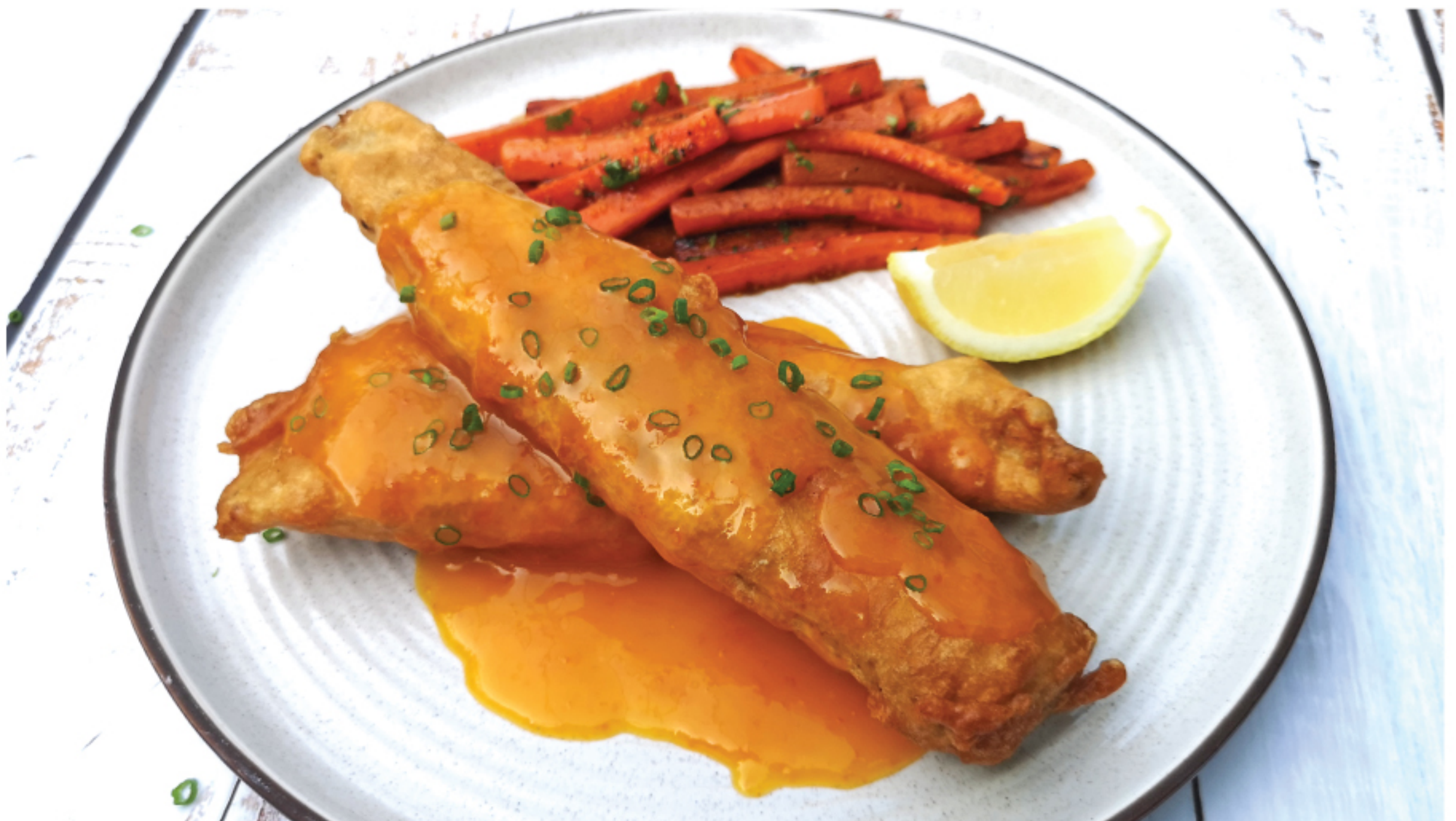
FRIED SEA BASS STEAK WITH ORANGE SAUCE สเต็กปลากระพงทอด ซอสส้ม 480 THB

*ราคารวมภาษีมูลค่าเพิ่ม 7% แล้ว แต่ยังไม่รวม service charge 5%