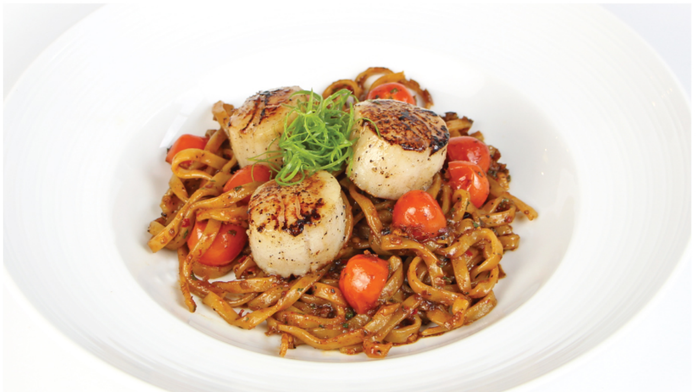
FETTUCCHINE (FRESH PASTA) HOKKAIDO SCALLOPS XO SAUCE เฟตตูชินี (เส้นสด) หอยเชลล์ฮอกไกโด พัดชอส XO 520 THB

*ราคารวมภาษีมูลค่าเพิ่ม 7% แล้ว แต่ยังไม่รวม service charge 5%