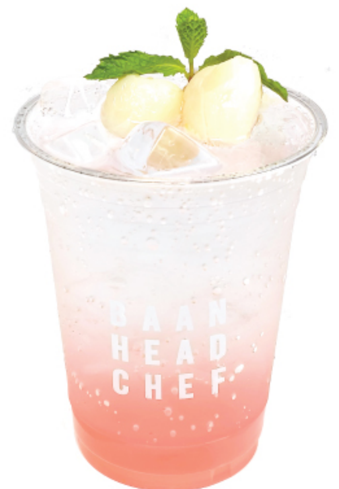
ลิ้นจี่ อิตาเลียน โซดา 90 THB LYCHEE ITALIAN SODA