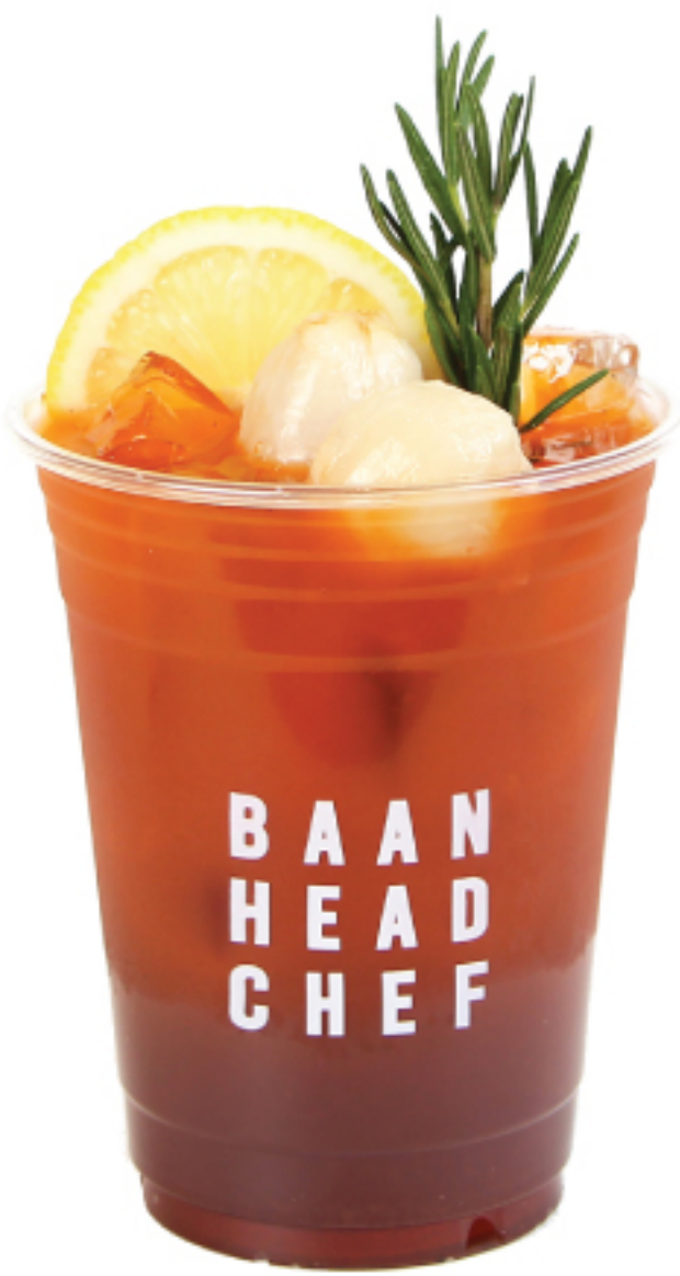
ชาลมอน ลิ้นจี่ 120 THB LEMON LYCHEE ICED TEA