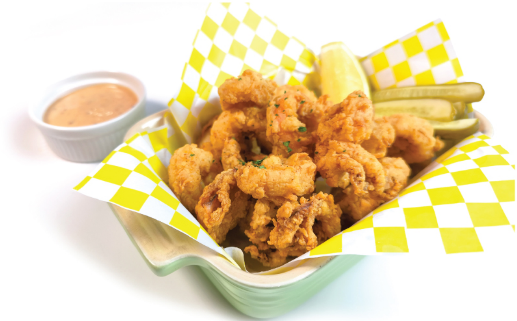
FRIED CALAMARI หมึกชุบแป้งทอด 180 THB