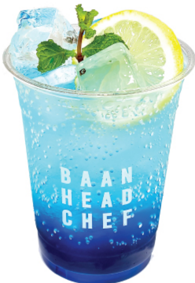
บลูฮาวาย 90 THB BLUE HAWAII ITALIAN SODA