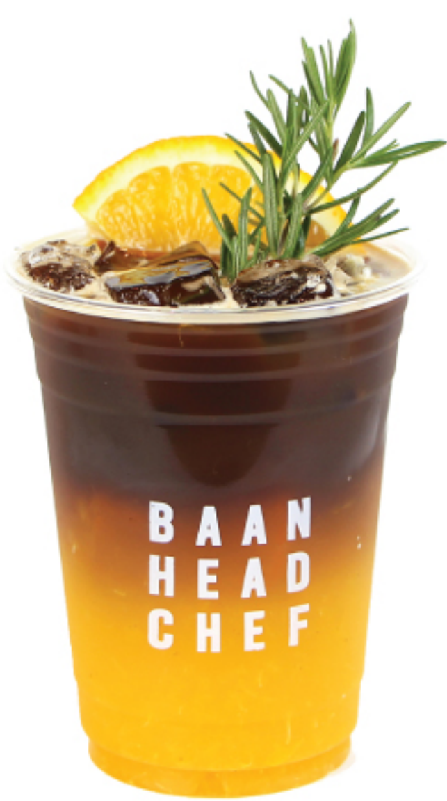
อเมริกาโน่ ส้ม 120 THB ORANGE AMERICANO