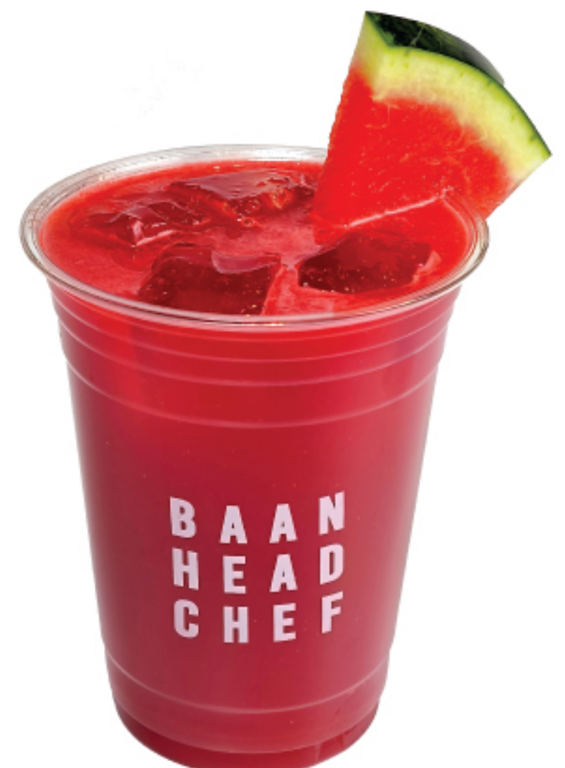
น้ำแตงโม 150 THB WATERMELON JUICE