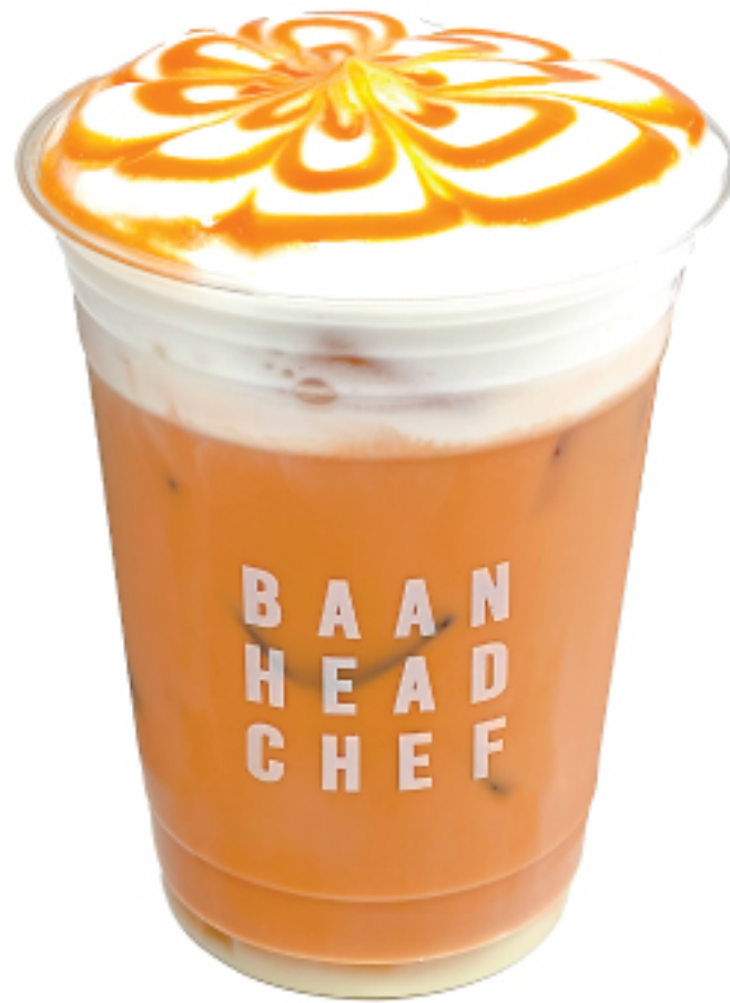
ชาไทย 100 THB THAI ICED TEA