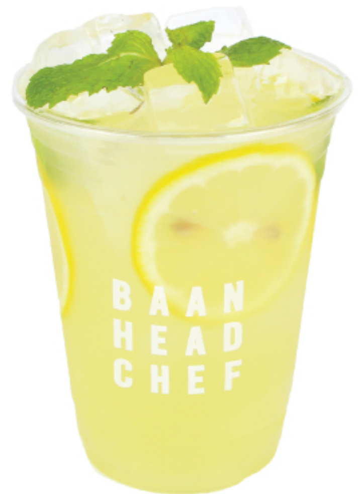
เลมอนเนด 130 THB HOUSEMADE LEMONADE