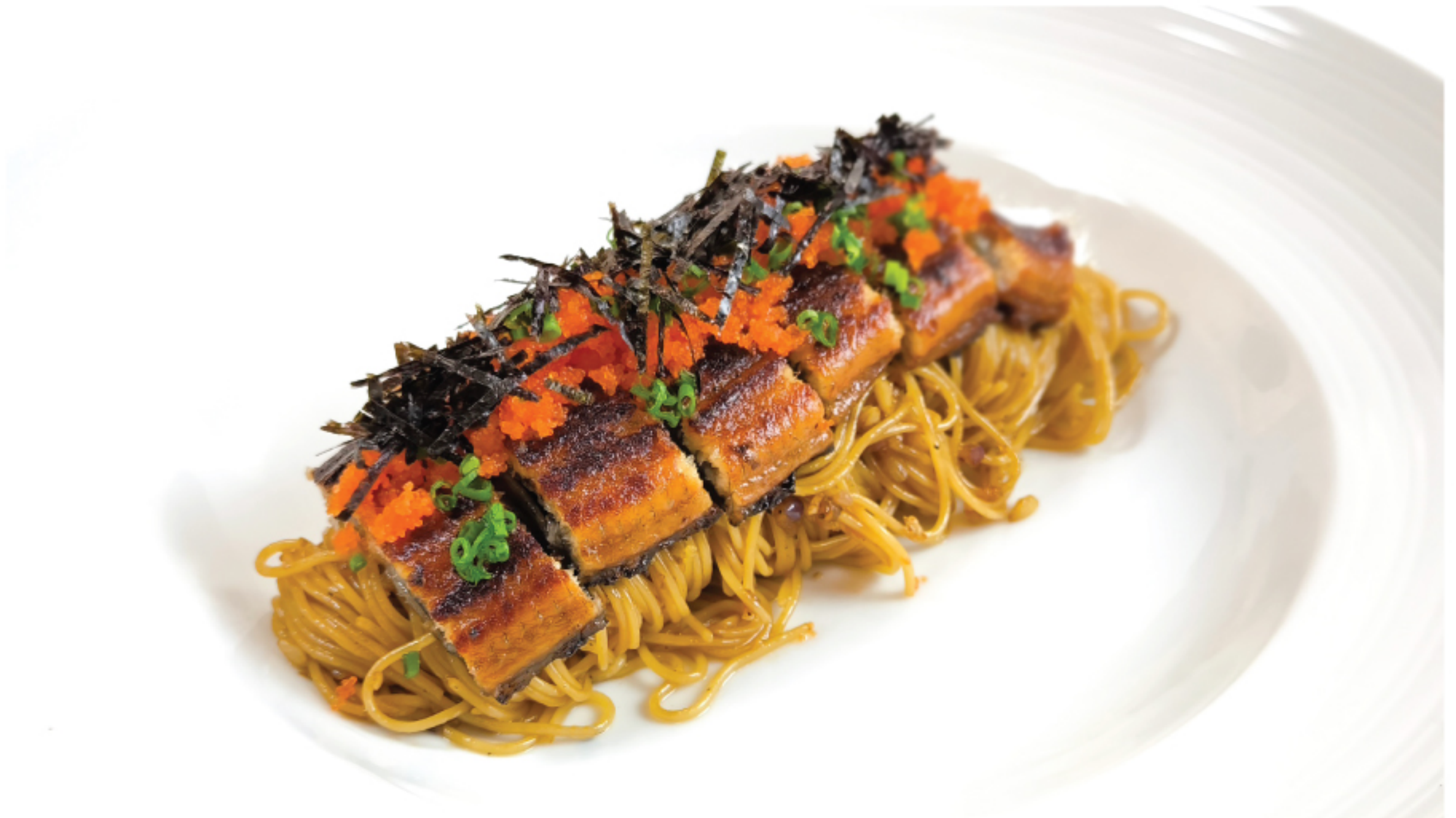
CAPPELLINI UNAGI EBIKO คาเปลลินี พัดชอสปลาไหลญี่ปุ่นย่าง ไข่กุ้ง 580 THB