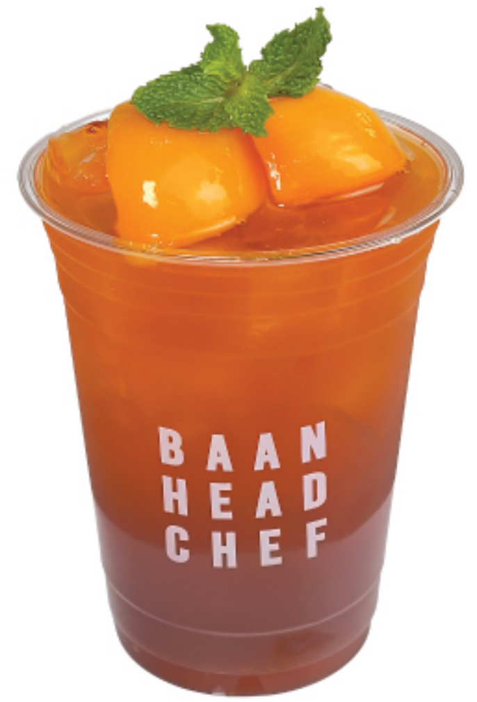
ชาพีช 150 THB PEACH ICED TEA