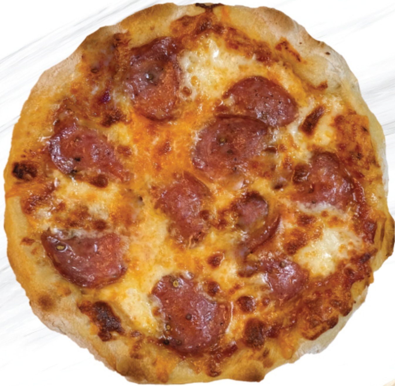
PEPPERONI PIZZA พืชซ่า เปปเปอร์นีย์ 450 THB