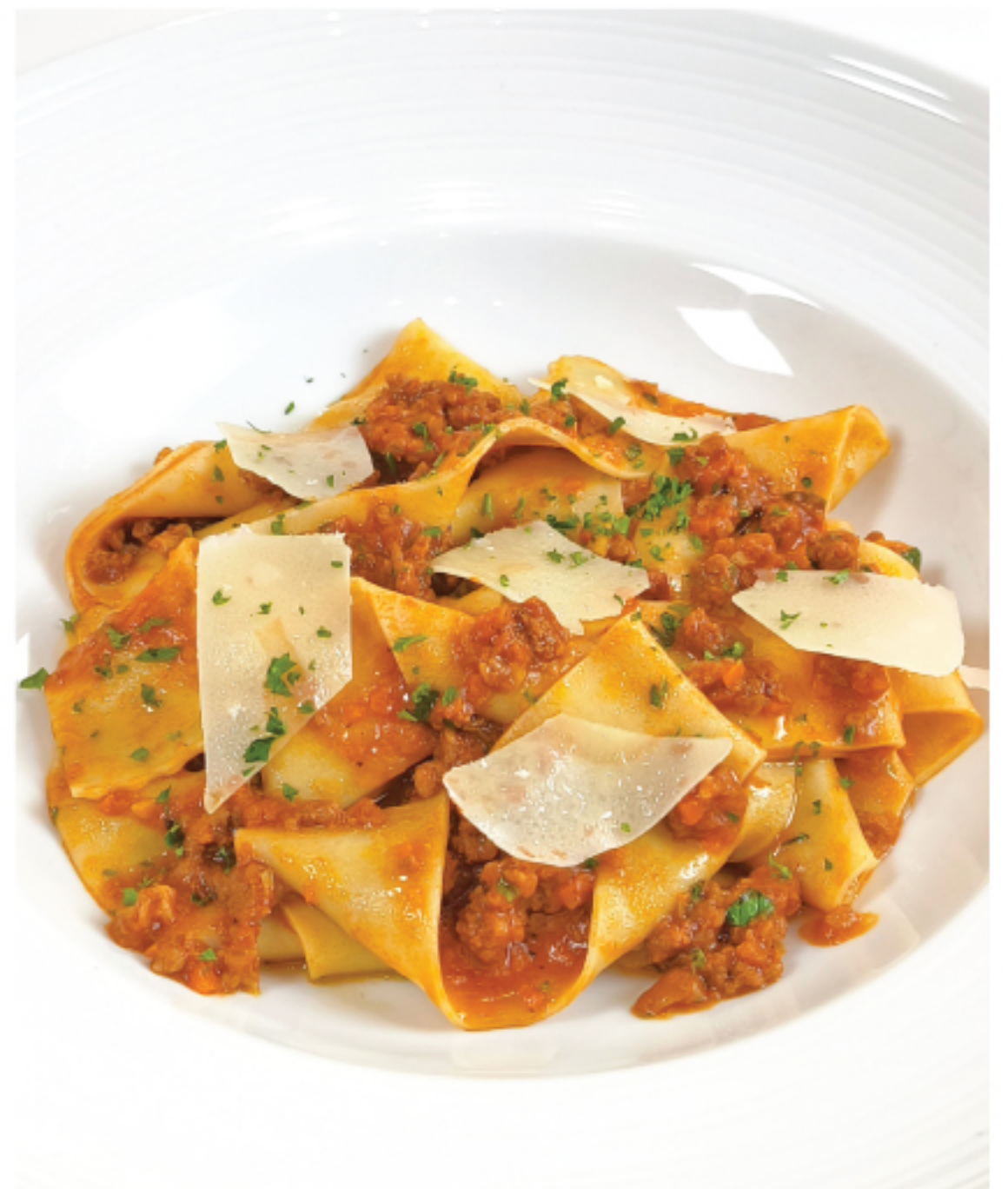
PAPPARDELLE (FRESH PASTA) BEEF RAGU ปับปาเดเล่ บีฟ รากู (เส้นสด) 350 THB

*ราคารวมภาษีมูลค่าเพิ่ม 7% แล้ว แต่ยังไม่รวม service charge 5%