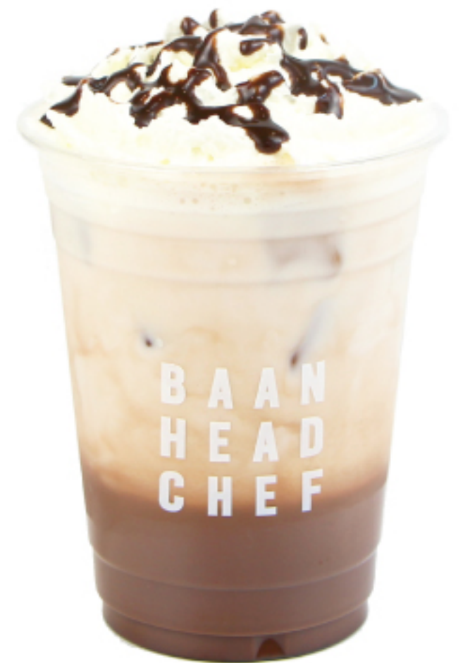
โกโก้ เย็น 100 THB ICED COCOA