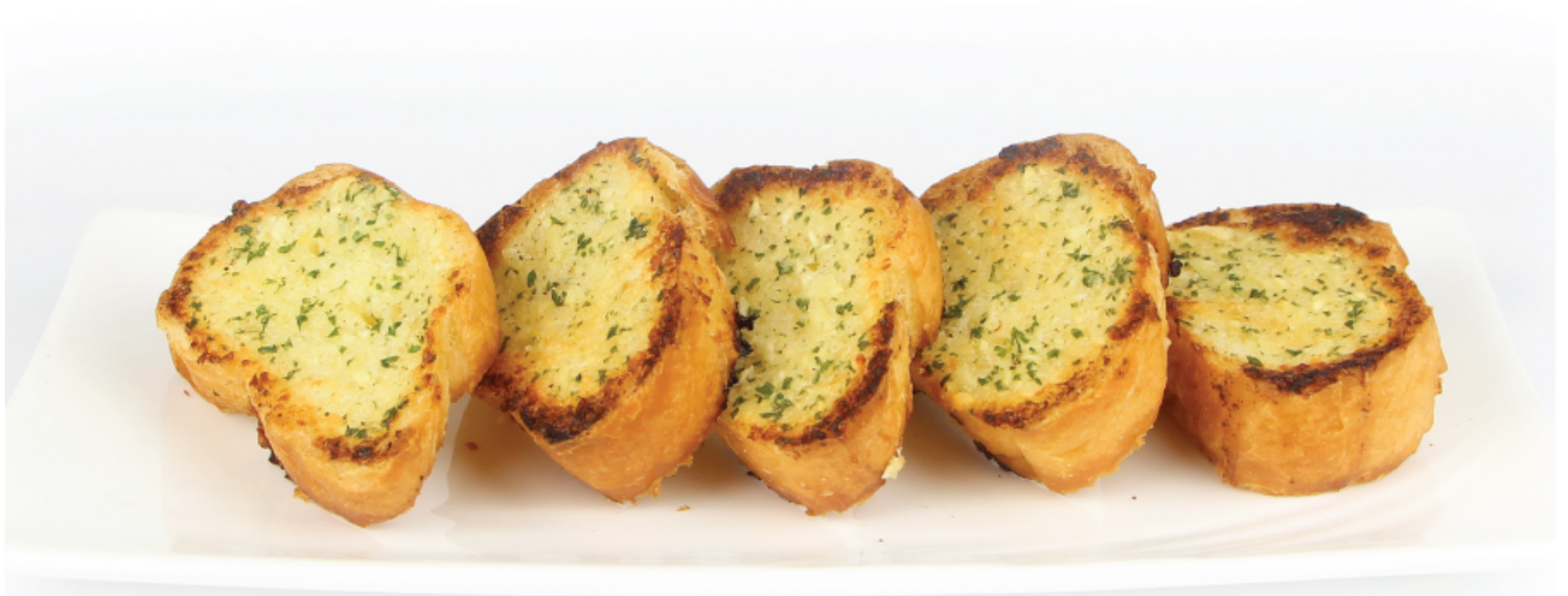
GARLIC BREAD ขนมปังกระเทียม 120 THB

*ราคารวมภาษีมูลค่าเพิ่ม 7% แล้ว แต่ยังไม่รวม service charge 5%