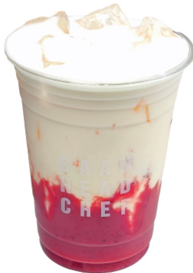
นมสด สตอเบอร์รี่ 150 THB FRESH STRAWBERRY MILK