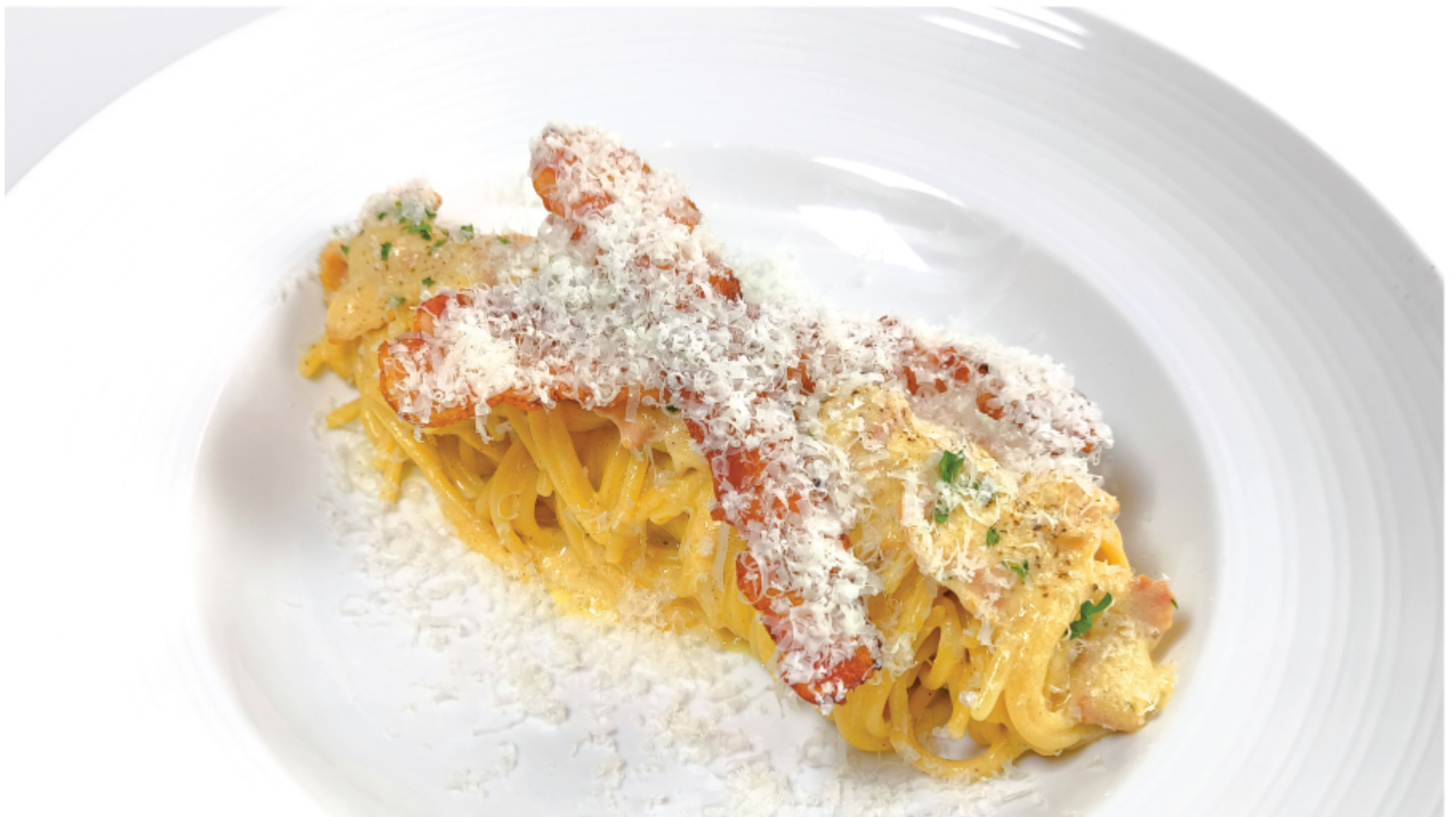
SPAGHETTI CARBONARA สปาเก็ตตี้ คาร์บอนาร่า 250 THB

*ราคารวมภาษีมูลค่าเพิ่ม 7% แล้ว แต่ยังไม่รวม service charge 5%