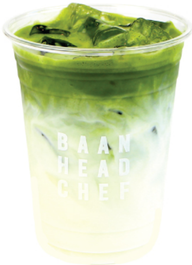
มัทฉะ ลาเต้ เย็น 180 THB ICED MATCHA LATTE