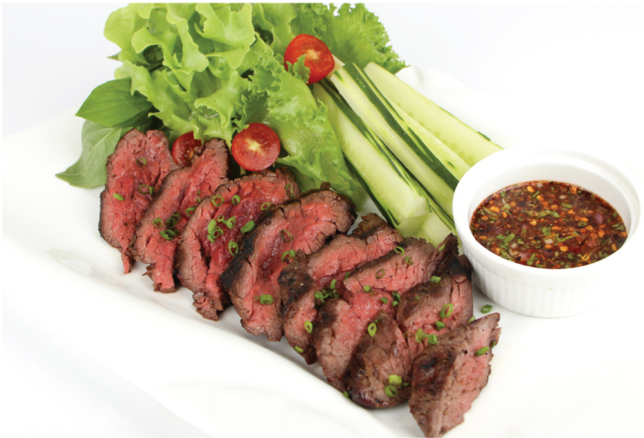
AUSTRALIAN STEAK JIM JAEW [THAI SPICY SAUCE] 220 G สเต็กเนื้อ ออสเตรเลีย จิมแจ่ว 650 THB