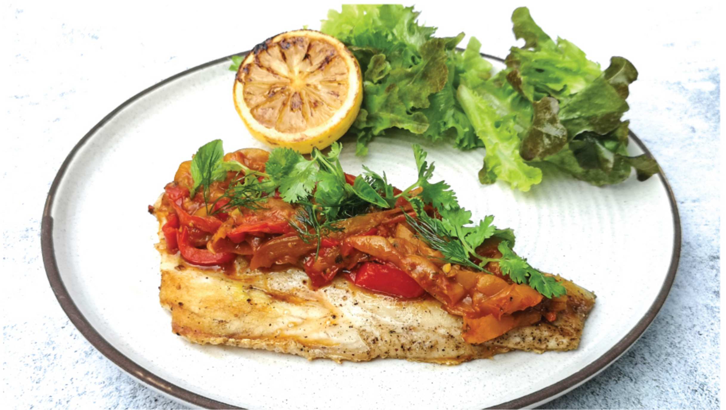
SEA BASS STEAK WITH PEPPERONATA สเต็กปลากระพง สตูว์พริกหวานอิตาลี 480 THB