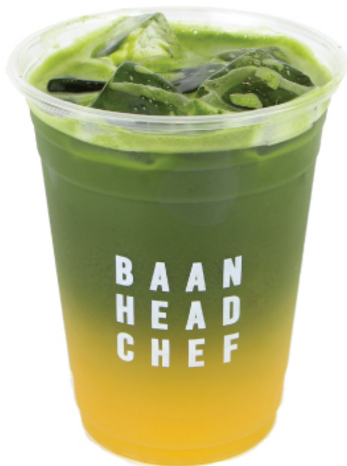
มัทฉะ ส้มยูซุ 195 THB MATCHA ORANGE YUZU