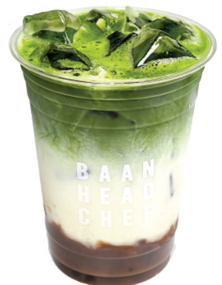
มัทฉะ ลาเต้ ถั่วแดง 195 THB MATCHA RED BEAN LATTE