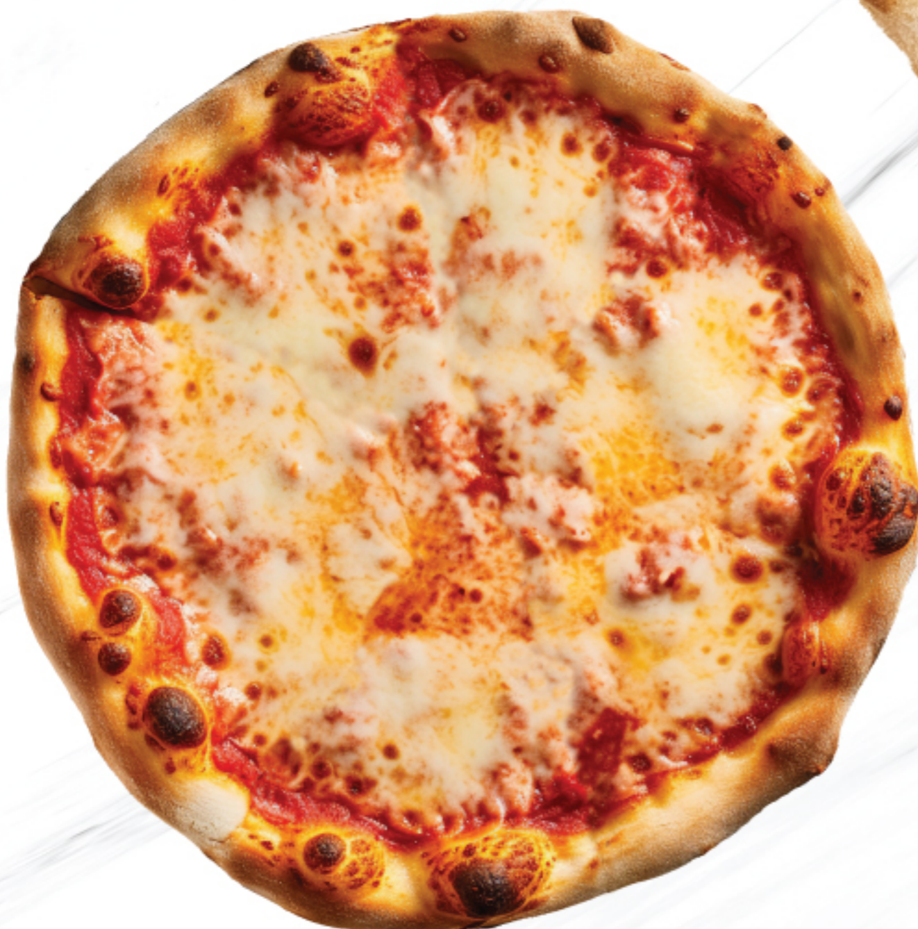
TRIPLE CHEESE PIZZA พืชซ่า ทริเปิ้ล ชีส 460 THB