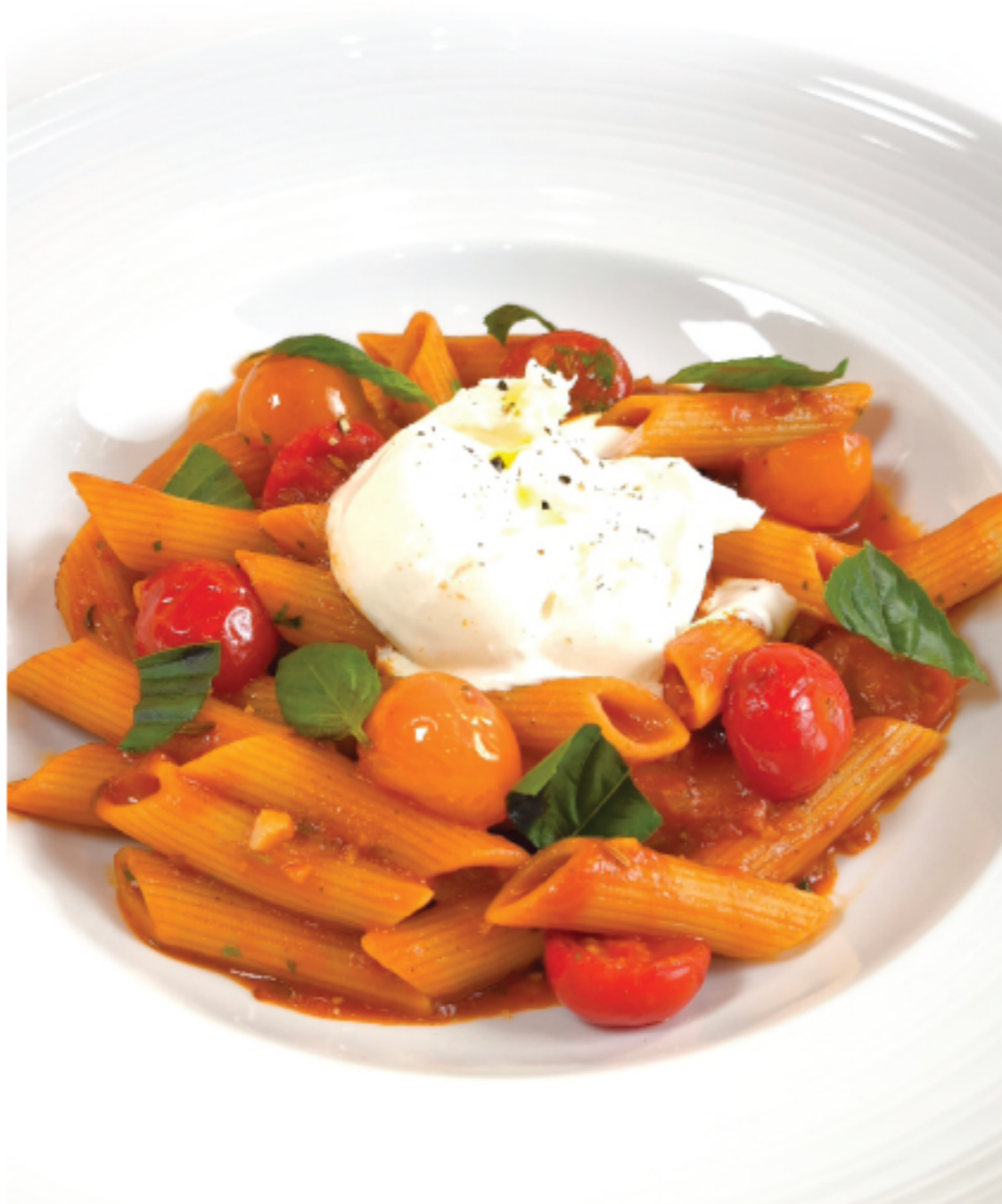
PENNE POMODORO เพนเน่ โพมอดโร 280 THB