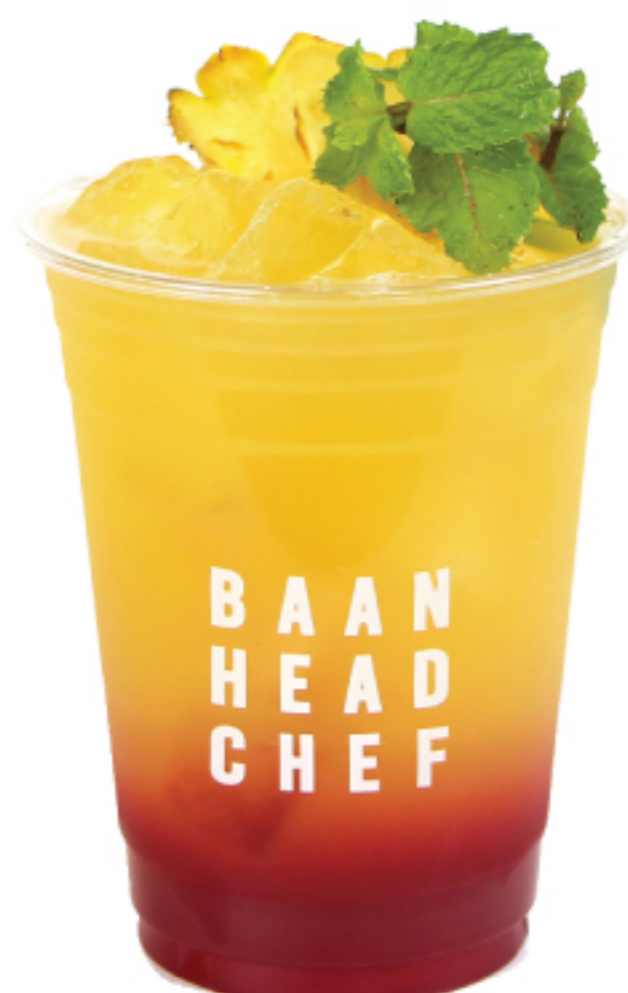
น้ำสับปะรด เบลูเบอร์รี่ 120 THB PINEAPPLE BERRY