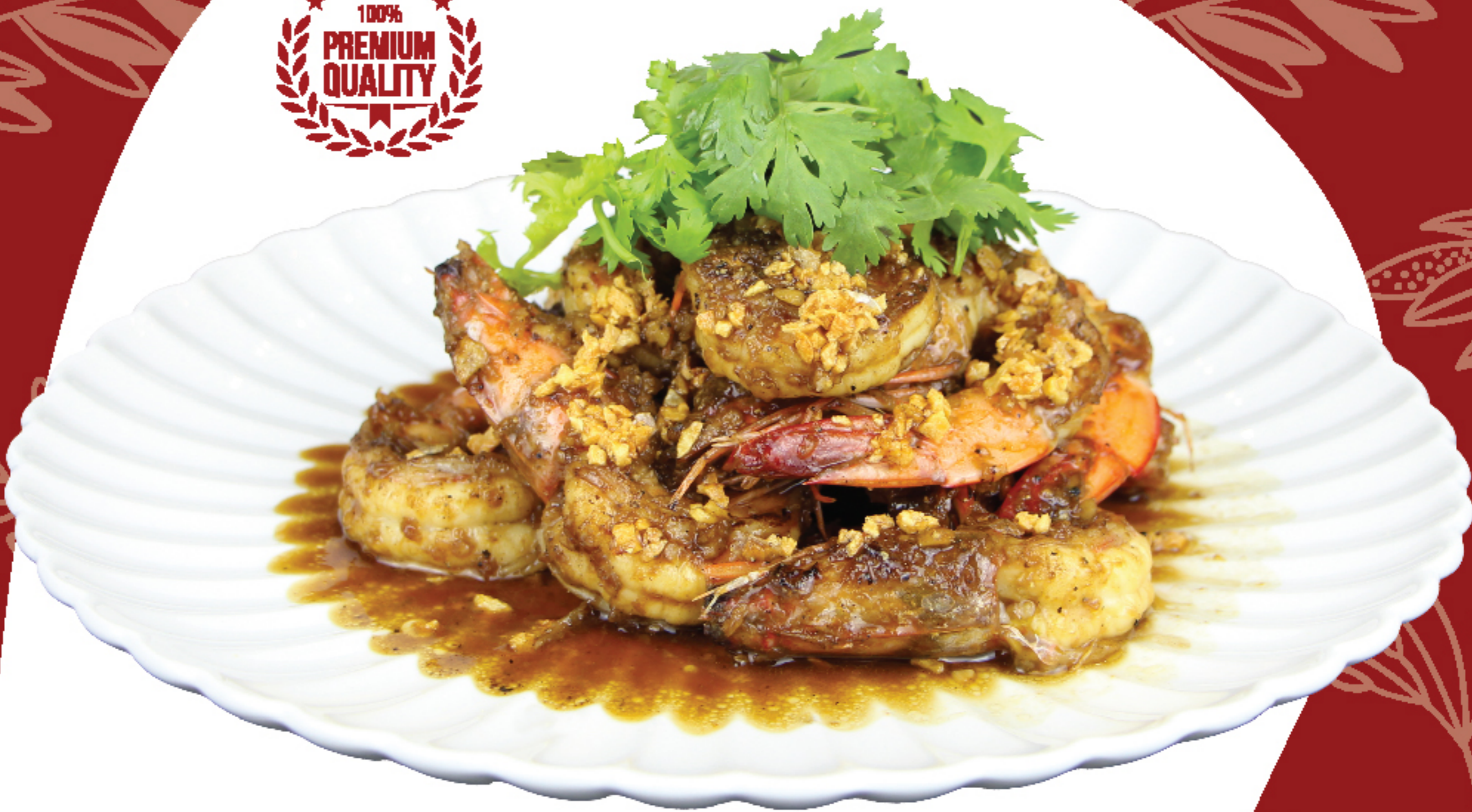
กุ้งทอดไฟระเเปิด (พ็ดชอบสกระเทียม) 380 THB STIR-FRIED SHRIMP WITH GARLIC AND PEPPER SAUCE