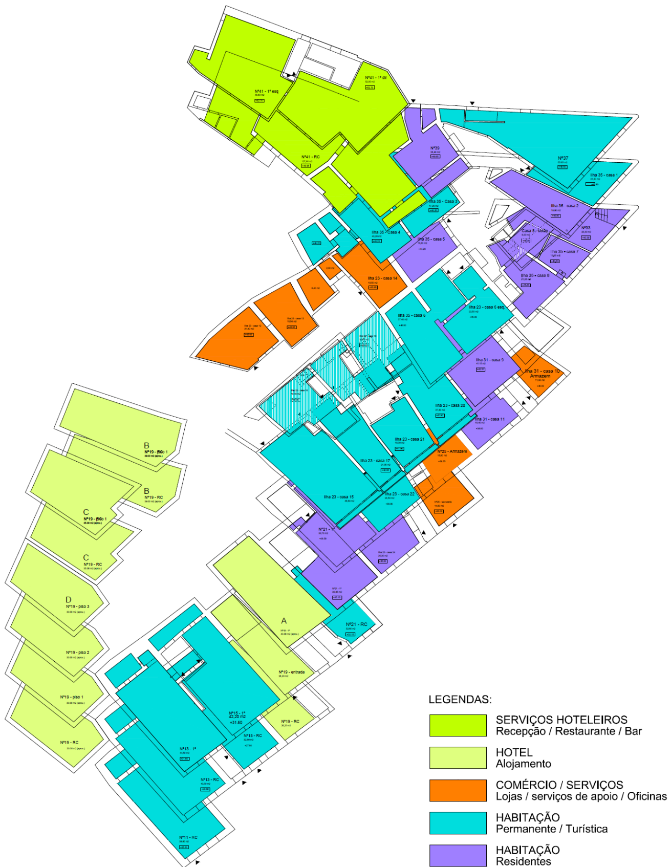
REABILITAÇÃO ESC. DOS GUINDAIS - PLANO DE INTERVENÇÃO - DISTRIBUIÇÃO FUNCIONAL ESQUEMATICA