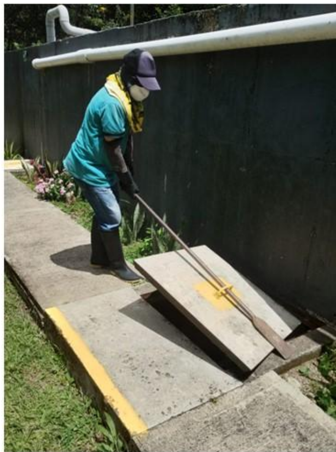
APERTURA DE LLAVES