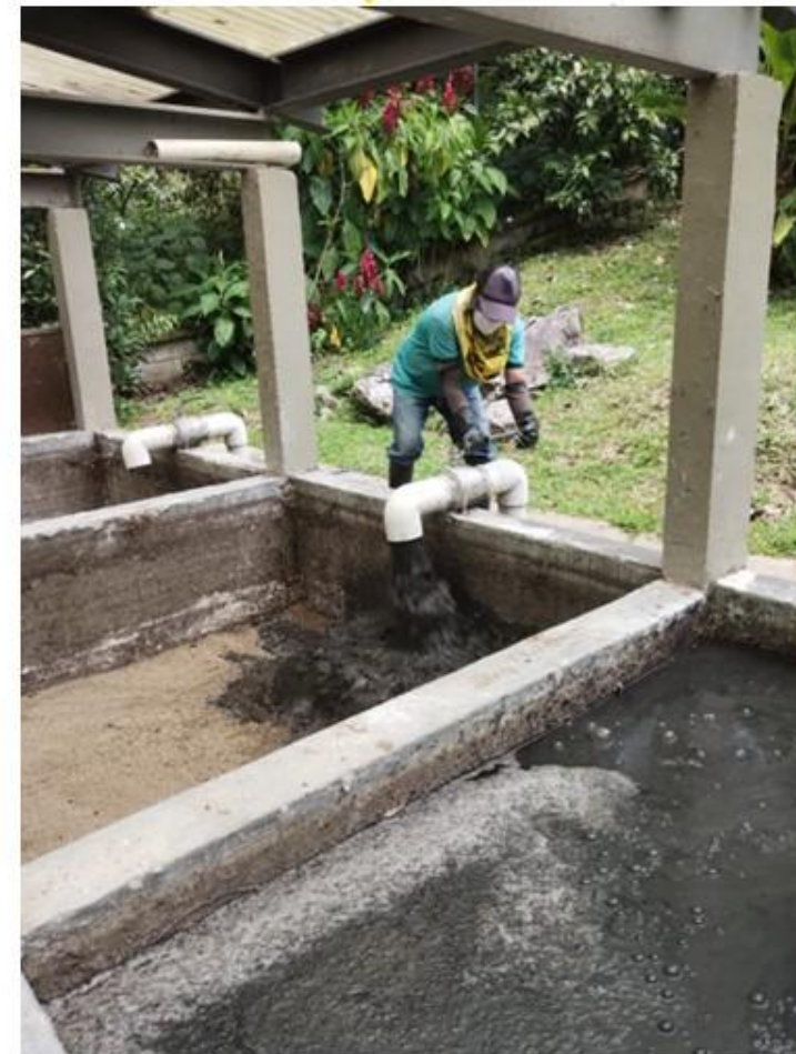
INICIO DEL PROCESO