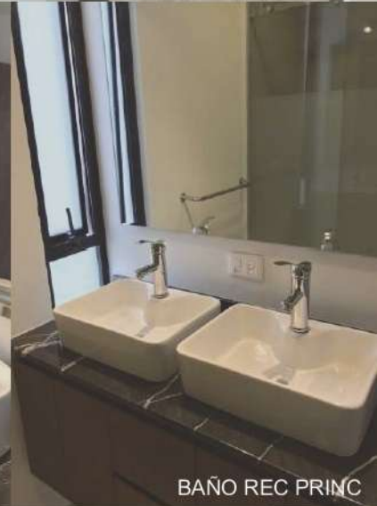
BAÑO REC PRINC