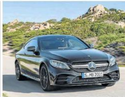
El nuevo Mercedes Benz C180 Facelift viene con mejoras en el diseño interior y exterior, además de dos pantallas en su consola.