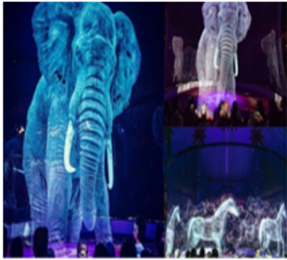
بوم فوجيني سيريك ألمانيا يستعمل تقنية الهولوجرام بدلاً من الحيوانات الحقيقية

تُتَبَّحُ هَذِهِ التَّقْنِيَةُ تَدْرِيسَ الطَّلَبَةِ بِمُسَاعَدَةِ مُعَلِّمِ افْتِرَاضِيٍّ، فَيُظَهِّرُ لَهُمُ الْمُعَلِّمُ الهُولُوجْرَامِي وَكَأَنَّهُ مَعَهُمْ فِي الصَّفِّ الدِّرَاسِيِّ، وَيُمْكِنُهُ رُؤْيَةُ الطَّلَبَةِ وَالْحَدِيثُ مَعَهُمْ، كَمَا يُمَكِّنُ الاسْتِيفَادَةَ مِنْهَا فِي الْجَوْلَاتِ التَّعْلِيمِيَّةِ وَالْمَيْدَانِيَّةِ الْإِفْتِرَاضِيَّةِ. وَهَذَا مَا نَفَّذَتْهُ جَامِعَةُ «إِمْبِرِيَالِ كُولِيدِجِ لَنْدَنِ» الْبْرِيطَانِيَّةِ، إِذِ اسْتَعَانَتْ بِتَقْنِيَّةِ الصُّورِ التَّجْسِيدِيَّةِ ثَلَاثِيَّةِ الْأَبْعَادِ «هُولُوجْرَامِ» لِلْأَسَاتِذَةِ، دُونَ حُضُورِهِمْ إِلَى الْجَامِعَةِ لِإِلْقَاءِ الْمُحَاضَرَاتِ.