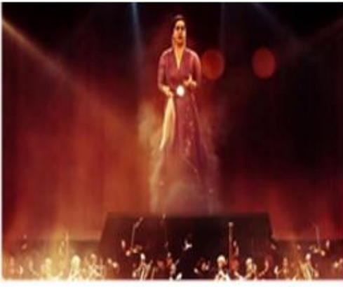
أوبرا دبي كلثوم المسرح بعد أكثر من 10 سنة من ولادتها

إِسْتُخْدِمَتْ مُؤَخَّرًا تَقْنِيَةُ الهُولُوجْرَامِ فِي ظَهْورِ فَنَّانِينَ رَاجِلِينَ مُنْذُ زَمَنِ بَعِيدٍ، عَلَى حَسْبَةِ الْمَسْرَحِ أَمَامَ جَمَاهِيرِهِمْ مَرَّةً أُخْرَى، وَكَأَنَّهُمْ أَحْيَاءُ يَتَحَرَّكُونَ وَيُؤَدُّونَ فَنَّهُمْ، كَانَ آخِرُهَا هَذَا الْعَامَ عِنْدَمَا ظَهَرَتْ الْفَنَّانَةُ الرَّاجِلَةُ أُمُّ كَلْثُومَ عَلَى مَسْرَحِ "دُبَي أوبرا" فِي أَكْثَرِ مِنْ حَفْلٍ فَنِّيٍّ.