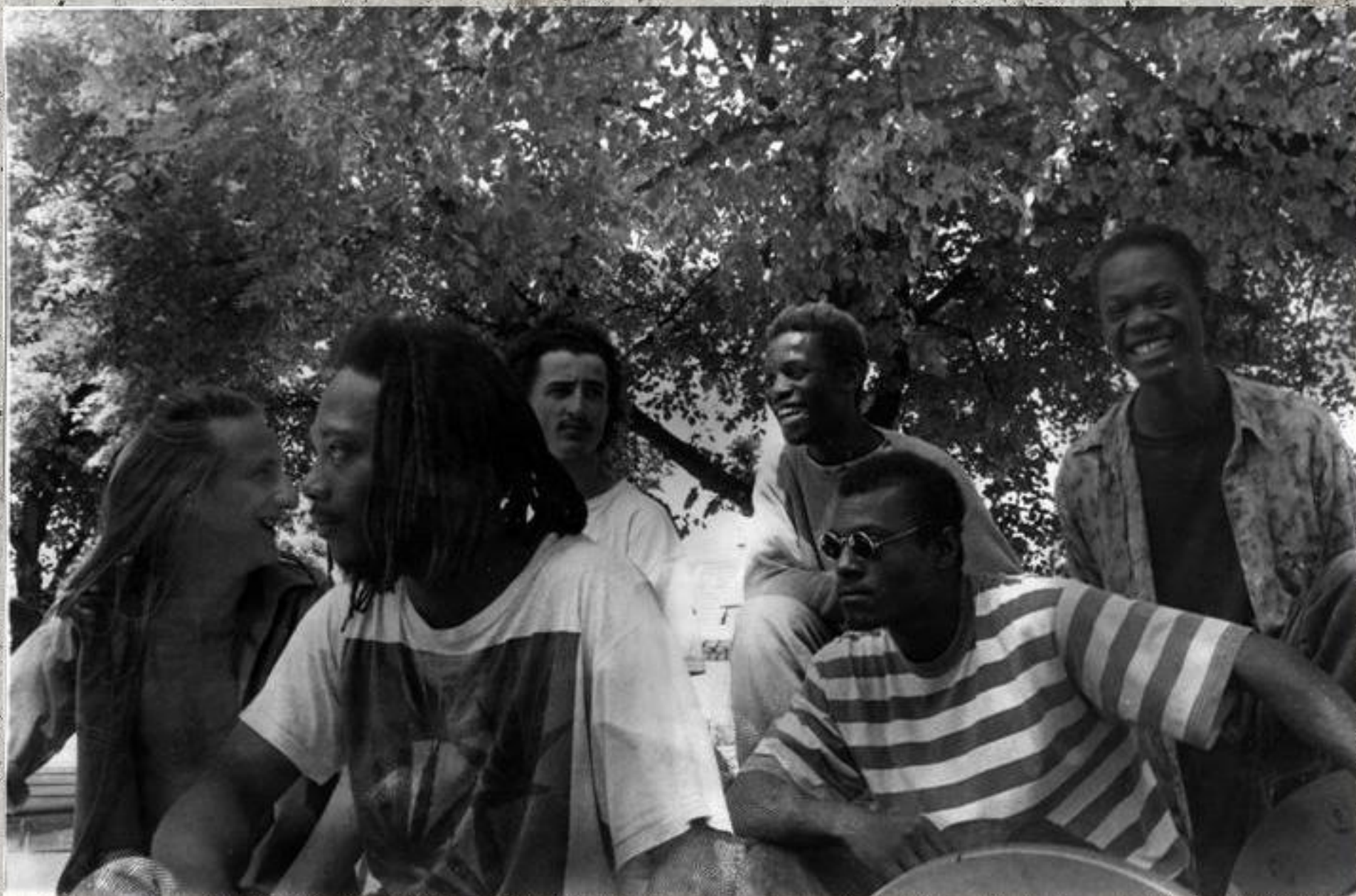
Groupe Oracle à Croix-Rouge – années 90