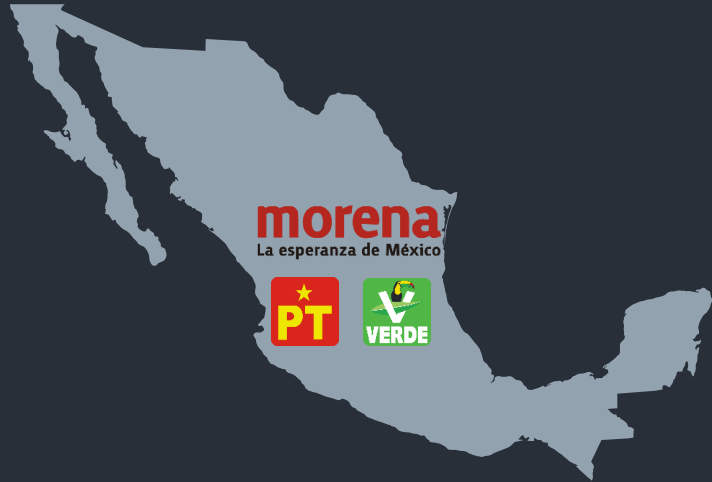
TRACKING INTENCIÓN DEL VOTO