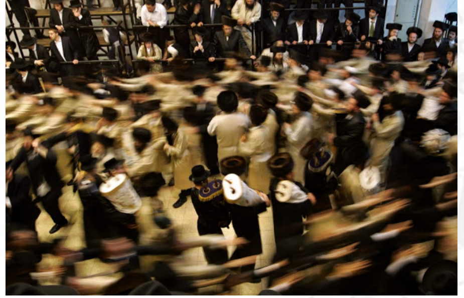
Dancing With The Torah: Photo Credit: Reuters