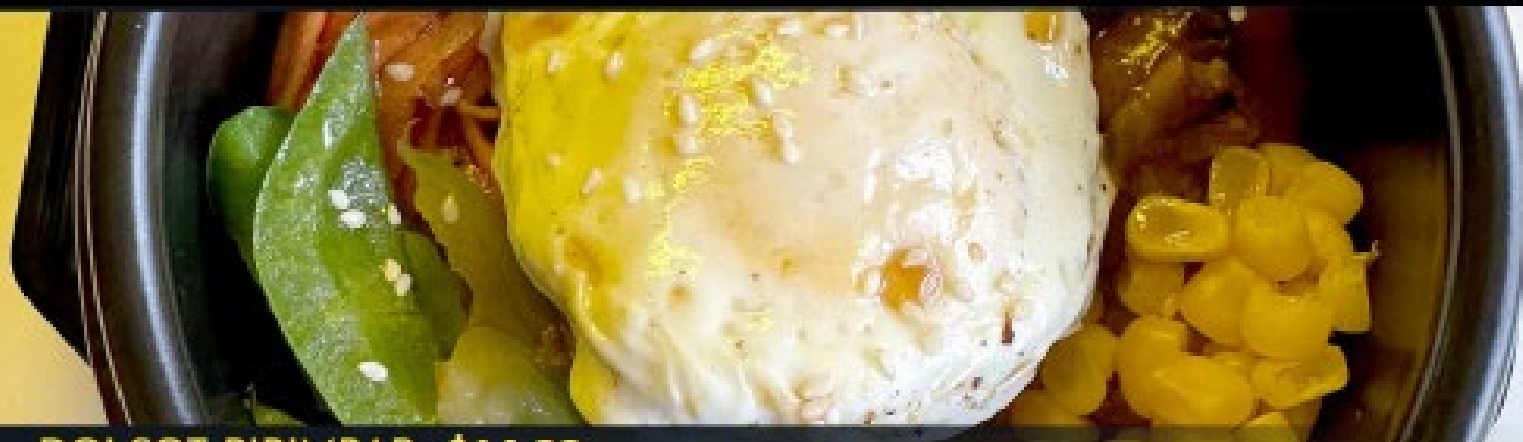
DOLSOT BIBIMBAP $14.99

BULGOGI O POLLO $4.99 MIXTO (2 PROTEINAS) $6.99 TOFU $4.99