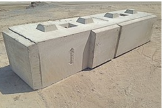
C'est un gauche sur la photo.

Base Coin intérieur Gauche ou Droite 27''L X 99''L X 24''H 2260 kg / 4972 lbs