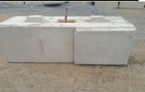
Pour un coin gauche sur la photo

Base Coin intérieur Gauche ou Droite 27''L X 51''L X 24''H