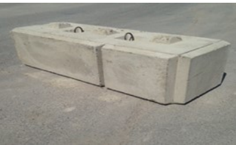
C'est un droit sur la photo.

Base Coin extérieur Gauche ou Droite 27''L X 75''L X 24''H