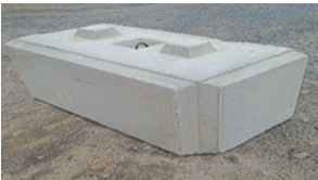
C'est un droit sur la photo

Base / Coin extérieur Gauche ou Droite 27''L X 51''L X 24''H 1200 kg / 2574 lbs