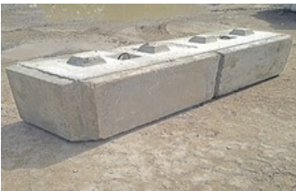
C'est un gauche sur la photo.

Base Coin extérieur Gauche ou Droite 27''L X 99''L X 24''H