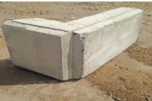
C'est un gauche sur la photo

Top finition (Gazon) Coin extérieur Gauche ou Droite 27''L X 51''L X 24''H 1170 kg / 2574 lbs