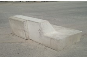
C'est un droit sur la photo

Top finition (Gazon) Coin intérieur Gauche ou Droite 27''L X 48''L X 24''H