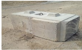
Pour un coin gauche sur la photo

Base Coin intérieur Gauche ou Droite 27''L X 54''L X 24''H (Une face de côté de plus que le B4-G )