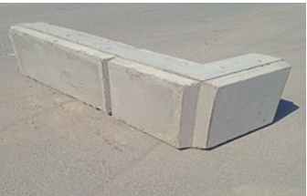
C'est un droit sur la photo.

Top finition (Gazon) Coin extérieur Gauche ou Droite 27''L X 75''L X 24.''H 1420 kg / 3130 lbs