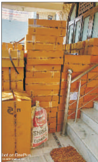
Hot on OnePlus