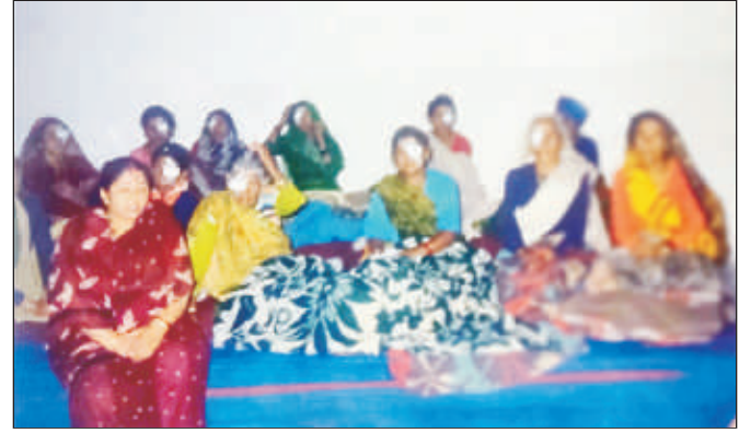
आँखों का ऑपरेशन के बाद नेत्र रोगी ।