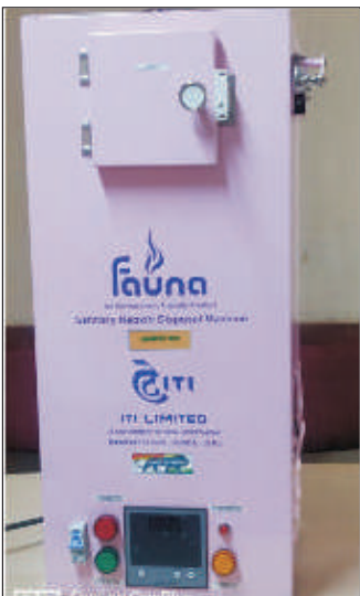
Hot on OnePlus