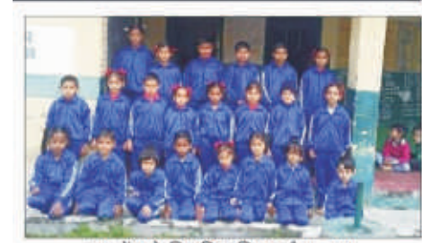
छात्रों को वितरित किया ट्रेक सूट पौड़ी गढ़वाल के प्रतिभावान छात्रों को प्रोत्साहन राशि प्रदान की गई।