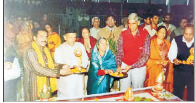
उत्तराखण्ड के पूर्व मुख्यमंत्री एवं महाराष्ट्र के पूर्व राज्यपाल श्री भगत सिंह कोश्यारी 2004 में आयोजित गौ कथा में आरती करते तथा राष्ट्रीय गौ रक्षा सम्मेलन को सम्बोधित करते हुए ।