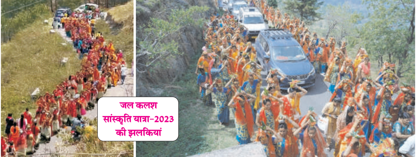
जल कलश सांस्कृतिक यात्रा-2023 की झलकियां