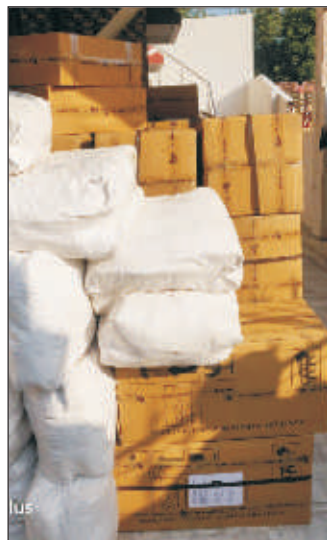
Hot on OnePlus