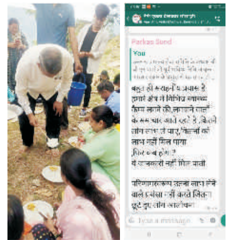
भंडारे में प्रसाद वितरण करते हुए पूर्व मुख्यमंत्री हरीश रावत।