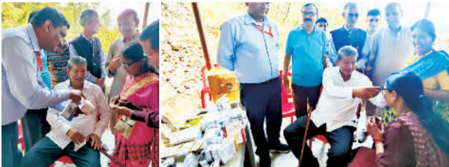
'हंस फाउंडेशन' द्वारा निःशुल्क श्रवण यंत्र एवं चश्मे प्रदान करते हुए उत्तराखण्ड के पूर्व मुख्यमंत्री हरीश रावत।