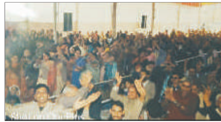
गौ कथा एवं गौ रक्षा सम्मेलन में उमड़ा जन समूह ।