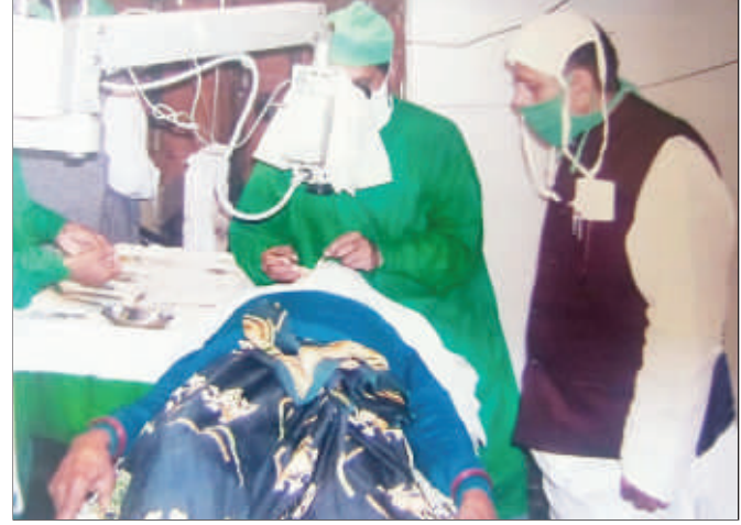
पश्चिम विनोद नगर में आयोजित निःशुल्क चिकित्सा केन्द्र में कुकरेजा नर्सिंग होम के चिकित्सक स्वास्थ्य जांच करते हुए।