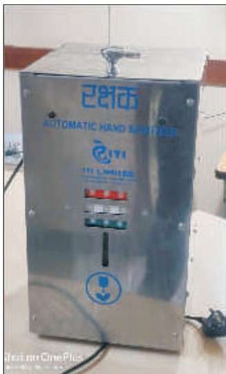
Hot on OnePlus