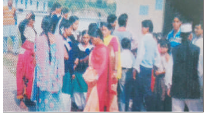
2008 में उफरैखाल जनपद पौड़ी गढ़वाल उत्तराखण्ड में आयोजित निःशुल्क नेत्र चिकित्सा शिविर में उत्तराखंड के तत्कालीन वित्तमंत्री डा0 रमेश पोखरियाल निशंक एवं चिकित्सा परीक्षण के लिए प्रतीक्षारत जनता ।