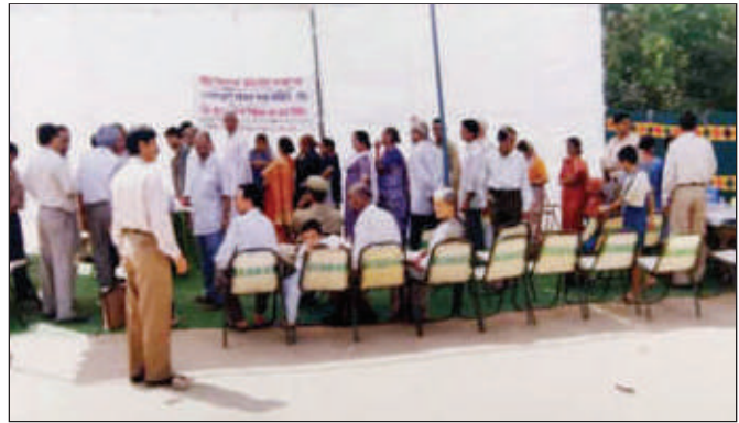
पूर्वी दिल्ली में चिकित्सा शिविर के दौरान परीक्षण के लिए प्रतीक्षारत जनता।