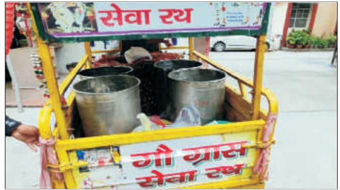
इन्द्रप्रस्थ पटपड़गंज (दिल्ली) में समिति द्वारा वर्ष 2012 से संचालित गौ ग्राम सेवा रिक्शा वाहन