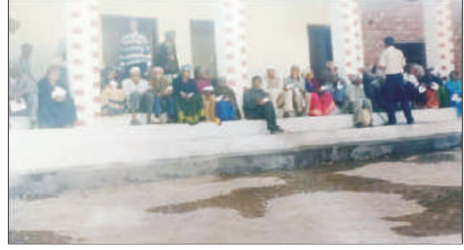
जनता इण्टर कॉलेज चौखाल में अथितियों का सम्बोधन सुनते छात्र-छात्रायें एवं अभिभावक व नेत्र चिकित्सा परीक्षण के लिए प्रतिकारत जनसमूह ।