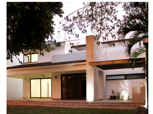
Barrio San Luis, La Primavera