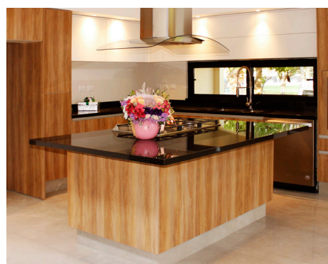
Barrio San Agustín, La Primavera