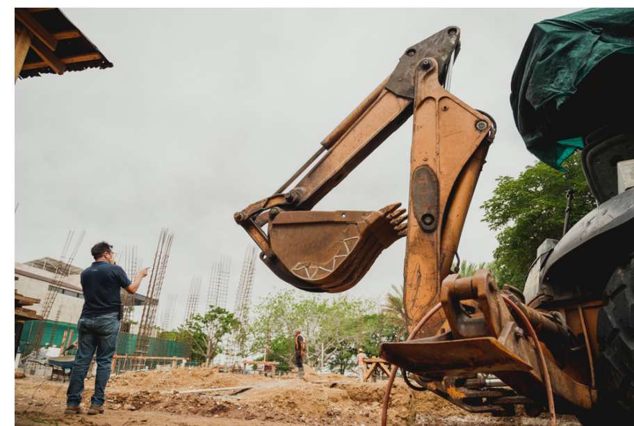
Casa Residencial Barrio San Anselmo, La Primavera