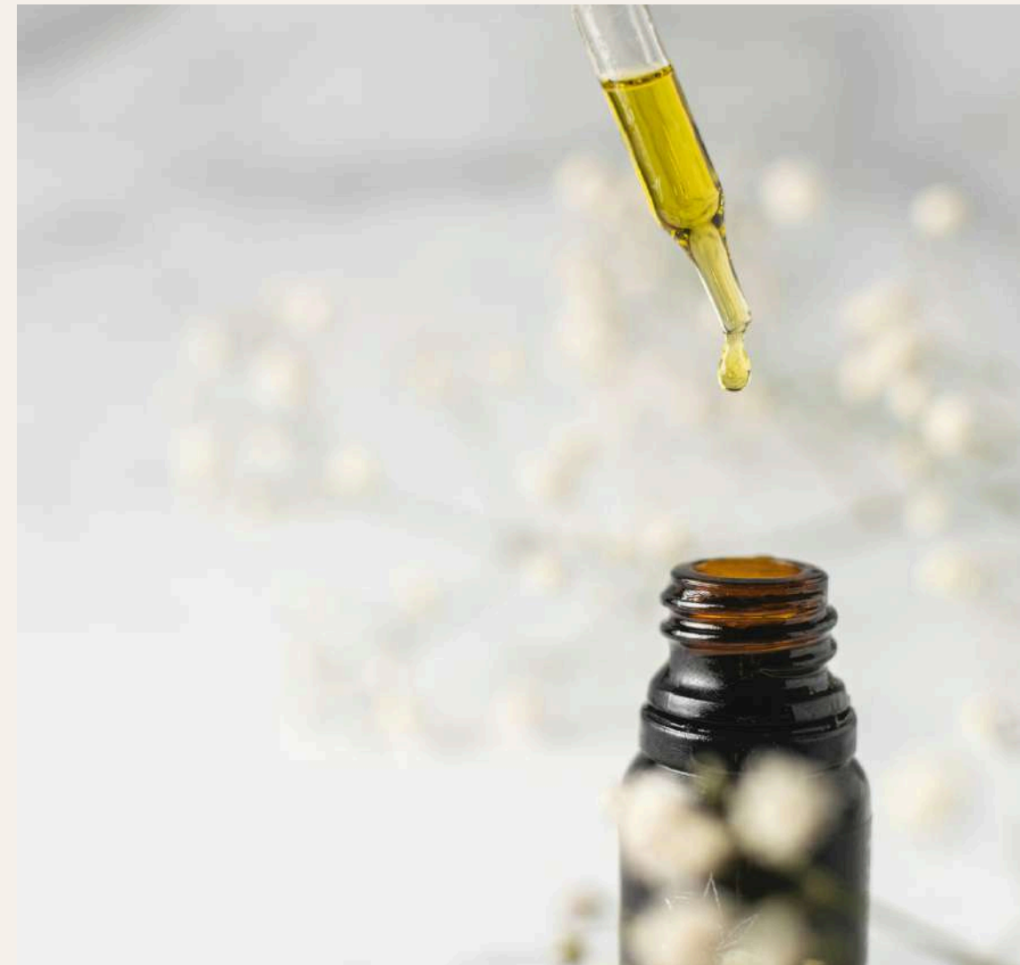
15 GOTAS DE AE*