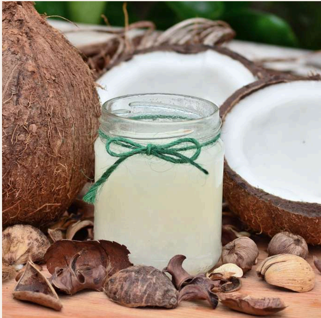
3 CUCHARADITAS DE ACEITE DE COCO