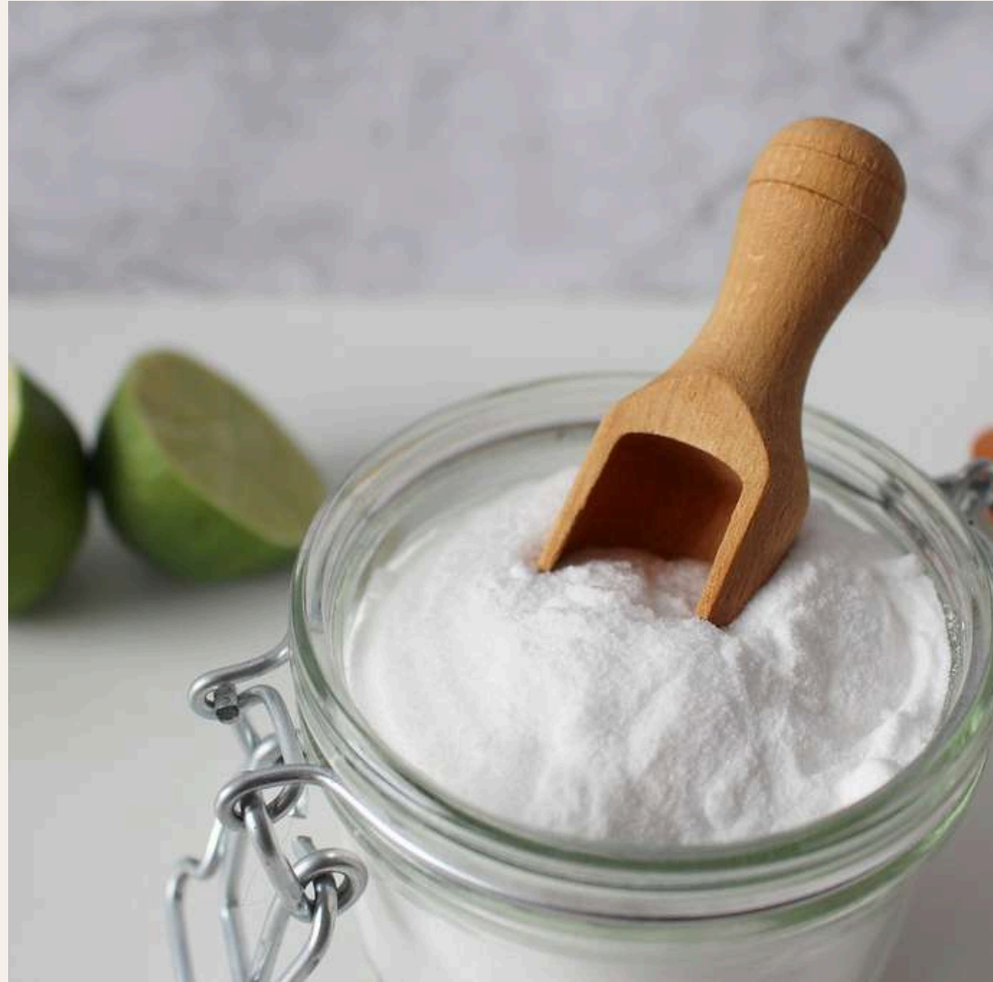
1/4 TAZA DE BICARBONATO (OPCIONAL)