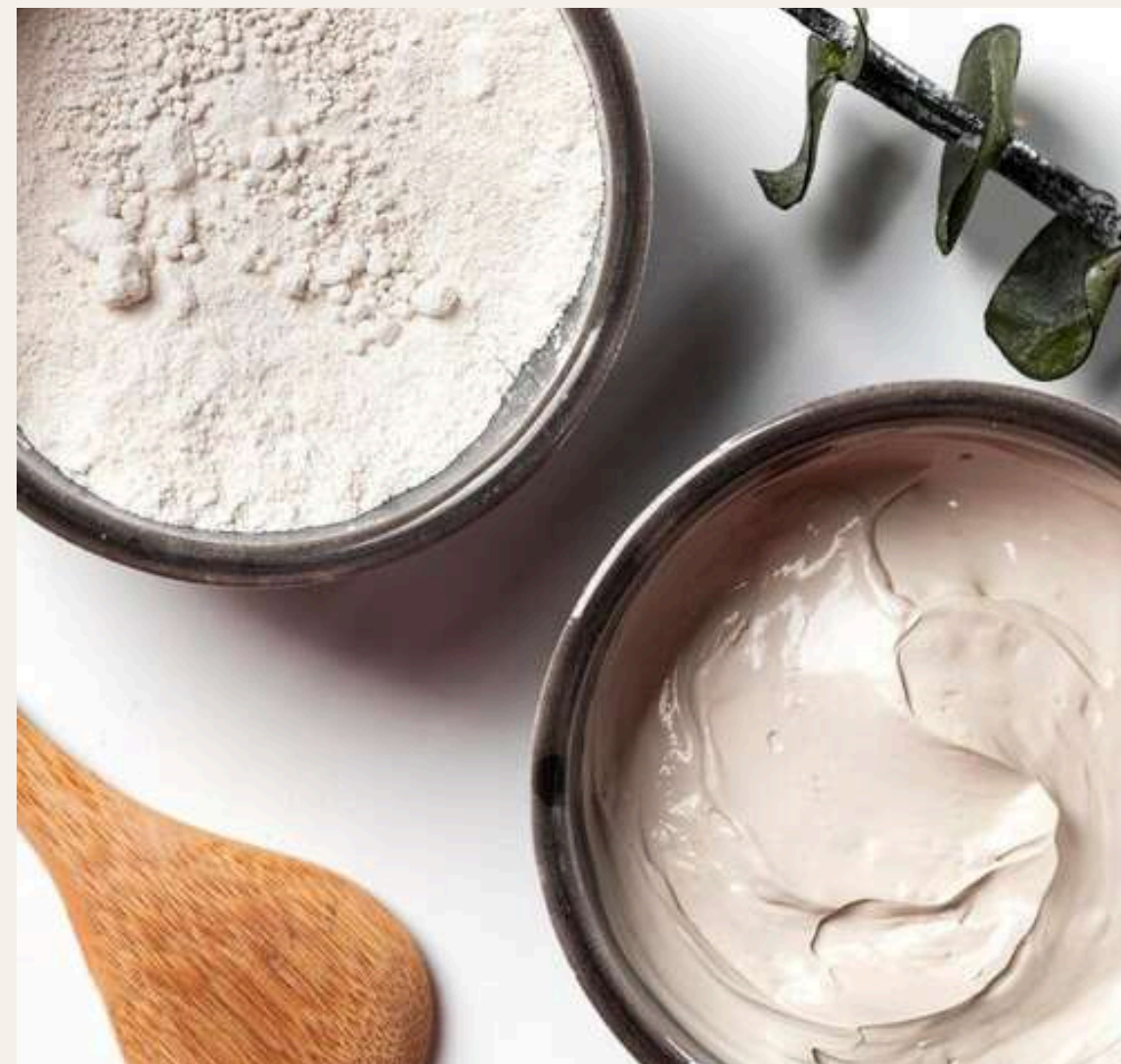
3 CUCHARAS SOPERAS DE ARCILLA BLANCA