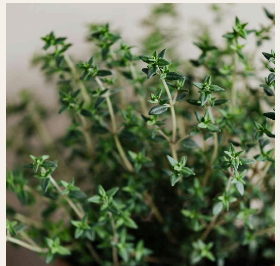
INFUSIÓN DE TOMILLO (O DE SALVIA)