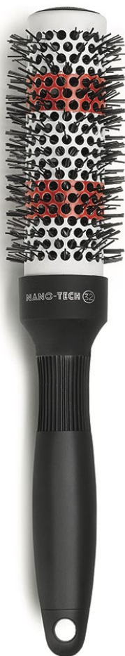
32 mm KI008