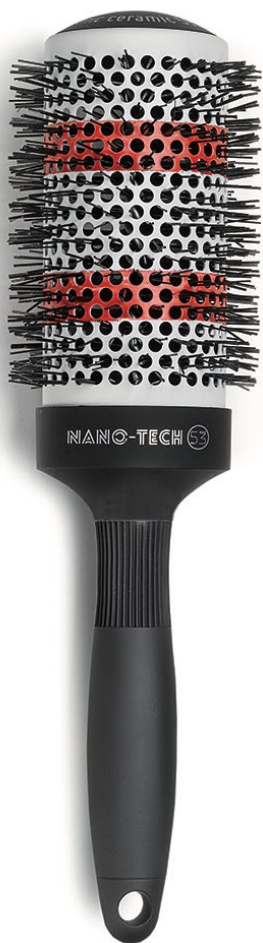
53 mm KI007