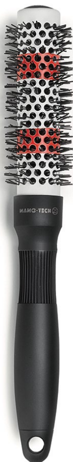
25 mm KI009