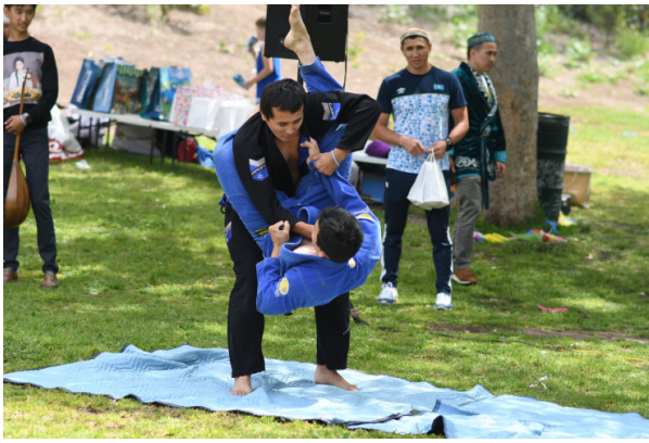
"Күш атасын танымас" балуандарда ортаға шықты.