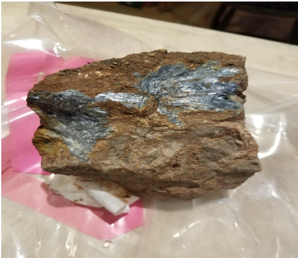
Foto der Stibnitmineralisierung in der Marcus Zone (West), die von Feldpersonal während der Errichtung von Bohrstraßen an der Westseite der Bald Hill Main Zone entdeckt wurde. Hinweis: Die Mineralisierung scheint von der Main Zone getrennt zu sein, jedoch parallel zu ihr zu verlaufen.

Vancouver, Kanada – 3. Februar 2026 – Antimony Resources Corp. (CSE: ATMY) (OTCQB: ATMYF) (FWB: K8J0) (das „Unternehmen“, „Antimony Resources“ oder „ATMY“) freut sich bekannt zu geben, dass es eine weitere massive Stibnitmineralisierung in der Marcus Zone (West) erweitert sowie abgegrenzt hat und die Mineralisierung im Festgestein auf einer Länge von 25 m freigelegt hat. Es wird angenommen, dass es sich hierbei um eine von der Mineralisierung in der Main Zone getrennte Zone handelt. Für die Explorationssaison 2026 sind weitere Schürfgrabungen und Probenahmen in der kürzlich entdeckten Marcus Zone (West) sowie bei der Mineralisierung Bald Hill South geplant.