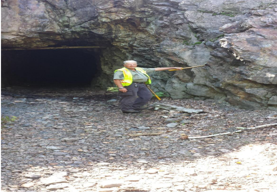
Der Stollen der Mine Prince.

Der Gerrelts-Stollen wurden von J.E. Gerrelts zu Beginn der 1970er-Jahre erschlossen, um Zugang zu einer Reihe von Quarzerzgängen zu schaffen, die in den 1960er-Jahren von Prospektoren entdeckt und erbohrt worden waren.