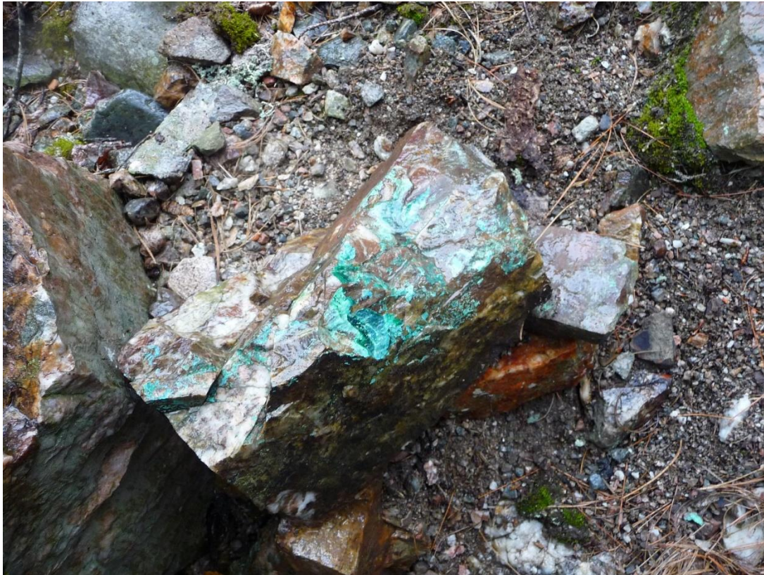
Malachit aus dem Gerrelts-Stollen

historischen Aufzeichnungen geht hervor, dass sich der Stollen mindestens 25 m in Ost-West-Richtung erstreckt und im Süden eine 45 m langen Querstrecke aufweist. Es gibt keine Aufzeichnungen über die Geologie des Stollens oder der Querstrecke, die Halde enthält jedoch reichlich Quarzmaterial mit Chalkopyrit und mit Malachit gefärbtem Gestein.