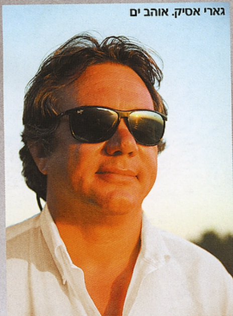
גארי אסיק. אוהב ים

"החלטתי שאני מקדיש לכך את מירב זמני - להראות בצילום את החיבור שיש לאדם עם היופי של הים. העירום הנשי המתמזג עם הים בתמונות שלי מסמל בעצם את השאיפות הסמויות ביותר של כולנו להתחבר לאמא ים ולבלות בריקודים ובמחולות עם קרובינו שוכני המים שעדיין גרים שם