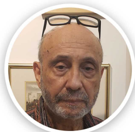
M. FRANTZ VOLTAIRE

À TITRE D'EXEMPLE DES PERSONNALITÉS QUI SERONT HONORÉES