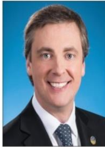
Marc Tanguay Député de LaFontaine

Bureau de circonscription 11977, avenue Alexis-Carrel Montréal (Québec) H1E 5K7 Tél. : 514 648-1007 | Téléc. : 514 648-4559 marc.tanguay-lafo@assnat.qc.ca