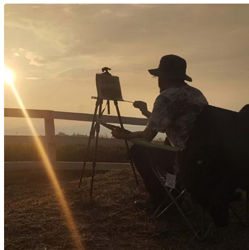
Galería de fotos obras de Julián Ocampo