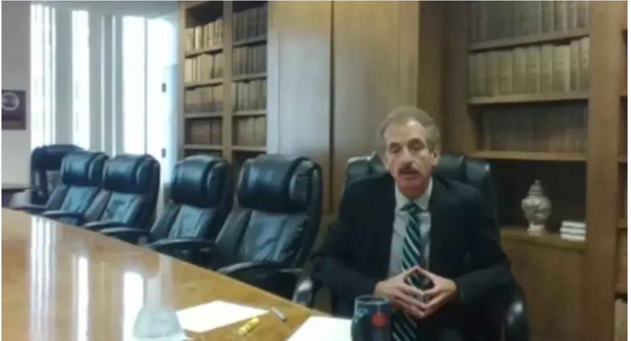
洛杉磯市檢察長富爾 (Mike Feuer)。