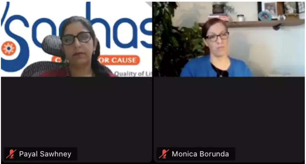
KACIE Strategies舉辦圓桌會議，針對如何給予受虐兒童幫助進行探討。(線上截圖)