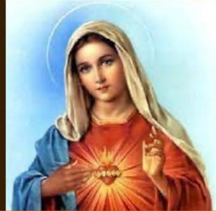
8 de junio El Inmaculado Corazón de María