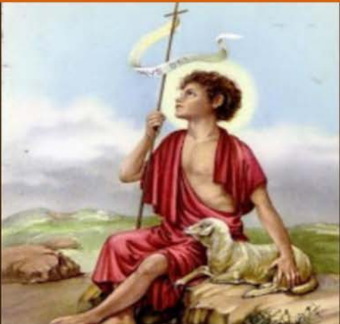
24 de junio El Nacimiento de San Juan Bautista