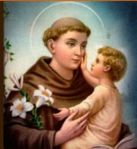
13 de junio San Antonio de Padua,