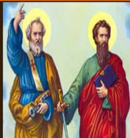
29 de junio Santos Pedro y Pablo, apóstoles