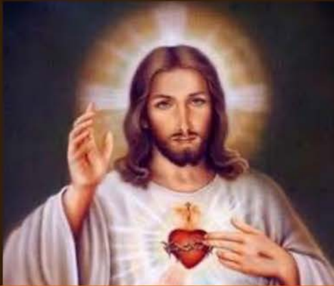
7 de junio El Sagrado Corazón de Jesús