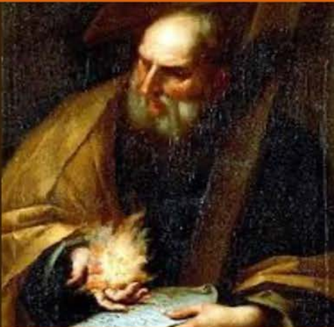
11 de junio San Bernabé, Apóstol