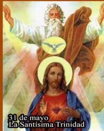
31 de mayo La Santísima Trinidad