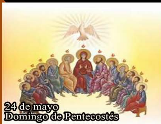
24 de mayo Domingo de Pentecostés