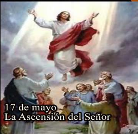
17 de mayo La Ascensión del Señor