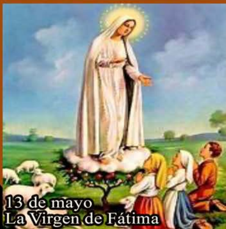
13 de mayo La Virgen de Fátima