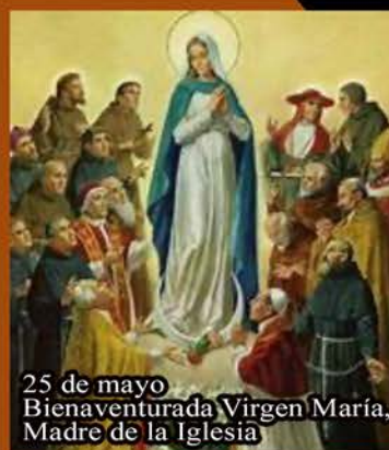
25 de mayo Bienaventurada Virgen María, Madre de la Iglesia