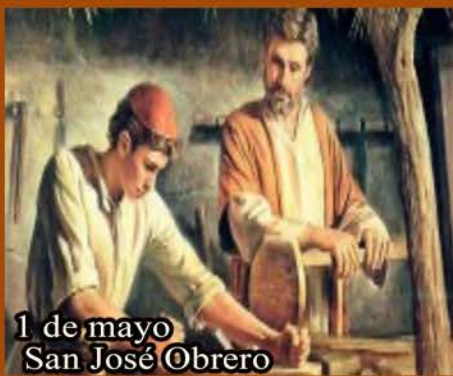
1 de mayo San José Obrero

Intensiones de oración de este mes: Por una alimentación para todos.