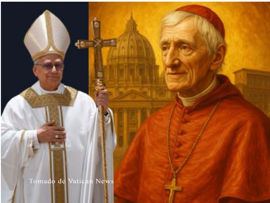
Tomado de Vatican News

Inspirado en el conocido himno de Newman Lead, kindly light (Guíame, Luz amable), el Santo Padre señaló que la educación debe ofrecer esa luz que guía a quienes se encuentran atrapados en las sombras del pesimismo y el miedo. “Desarmemos las falsas razones de la resignación –pidió– y difundamos las grandes razones de la esperanza”. El Pontífice animó a hacer de las escuelas, universidades y espacios educativos “umbrales de una civilización del diálogo y la paz”, reflejo de la enorme muchedumbre “de todas las naciones, familias, pueblos y lenguas” de la que habla el libro del Apocalipsis.