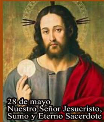
28 de mayo Nuestro Señor Jesucristo, Sumo y Eterno Sacerdote