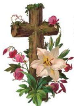
La Exaltación de la Santa Cruz 14 de septiembre

Salve cruz santa y divina, donde Jesús expiró, donde su sangre vertió. Entre la zarza y la espina, entre la zarza y la espina, expiró.