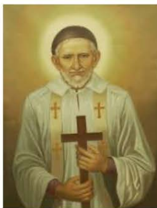
San Vicente de Paúl, presbítero 27 de septiembre

"Ten cuidado contigo, no vayas a deshacer con tu conducta lo que edificaste con tu predicación"