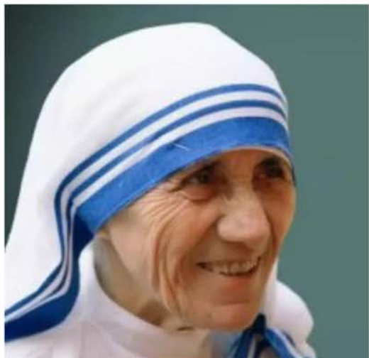
Santa Teresa de Calcuta, 5 de septiembre

"La revolución del amor comienza con una sonrisa. ..."