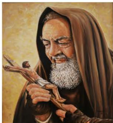
San Pío de Pietrelcina, presbítero 23 de septiembre