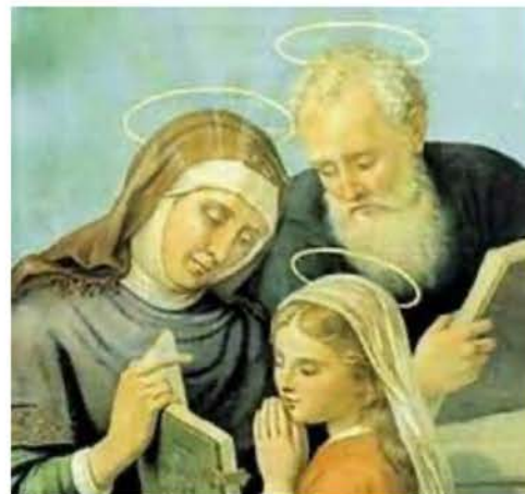
La Natividad de la Bienaventurada Virgen María 8 de septiembre