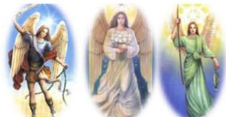
Santos Miguel, Gabriel y Rafael, arcángeles 29 de septiembre

"Ten cuidado contigo, no vayas a deshacer con tu conducta lo que edificaste con tu predicación"