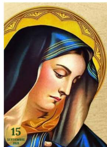
Nuestra Señora de los Dolores 15 de septiembre

Salve cruz santa y divina, donde Jesús expiró, donde su sangre vertió. Entre la zarza y la espina, entre la zarza y la espina, expiró.