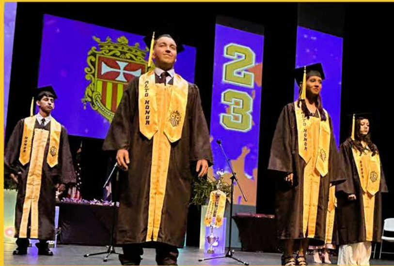
Academia Santa María Reina