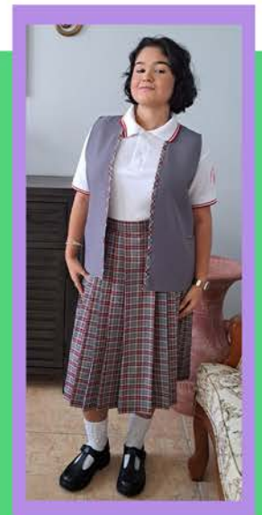
Por: Génesis G. Quirindongo Costas, Undécimo grado

La amistad es una de las relaciones primarias en la vida, es una correspondencia que supera muchas veces a la que une a parientes de sangre. Mis amigos, mis hermanos son un regalo de la vida y un don de Dios.