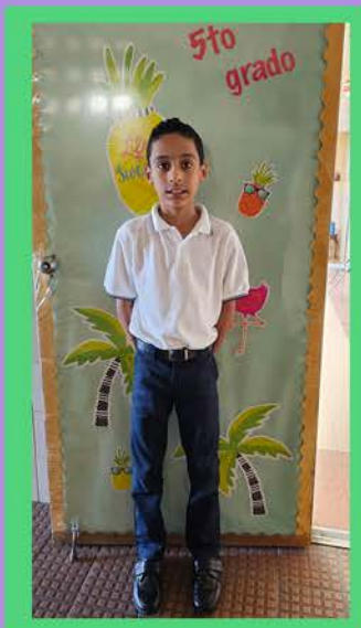
Por: Iker H. Marti Pacheco, Quinto grado

Mis dos mejores amigos están en El Ave María, ambos son mis compañeros de clase. Los dos han estado conmigo desde kínder. Ahora cursamos el quinto grado. Con ellos he aprendido que el verdadero amigo nunca te abandona y siempre te ayuda en los momentos difíciles. Doy gracias por la amistad.