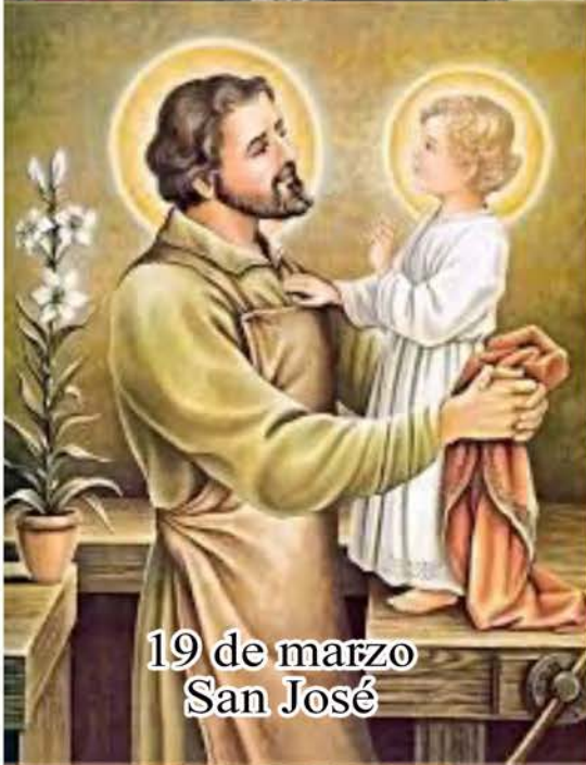
19 de marzo San José