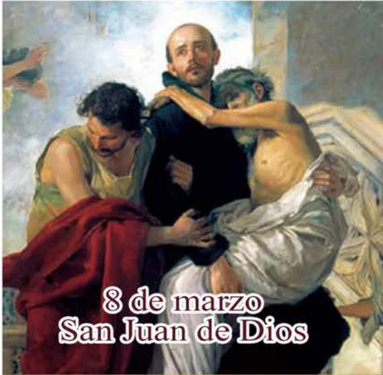
8 de marzo San Juan de Dios