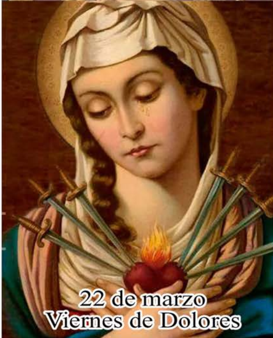
22 de marzo Viernes de Dolores