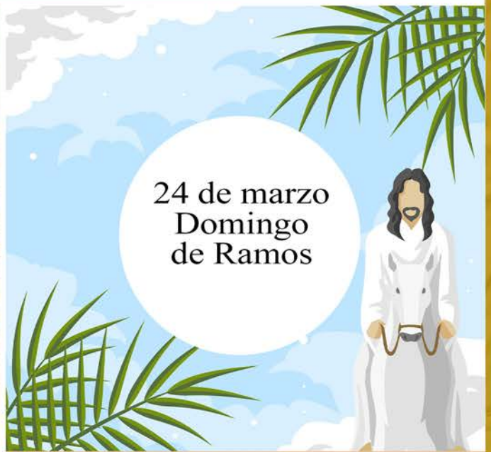
24 de marzo Domingo de Ramos