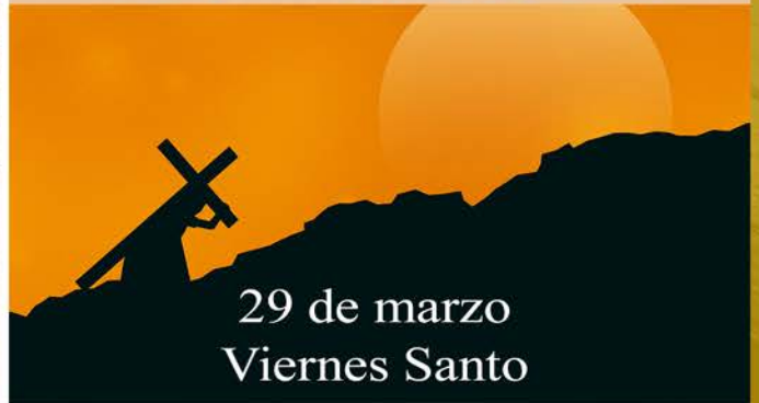
29 de marzo Viernes Santo