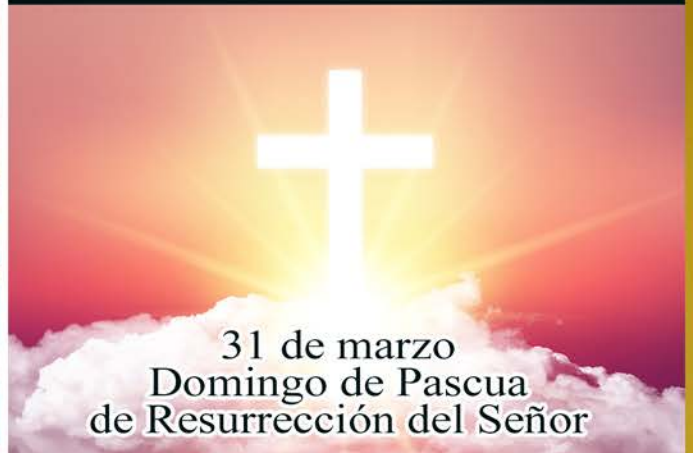
31 de marzo Domingo de Pascua de Resurrección del Señor