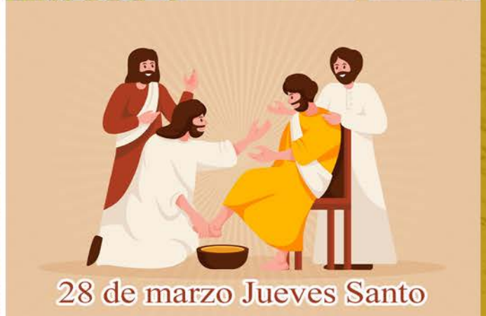
28 de marzo Jueves Santo