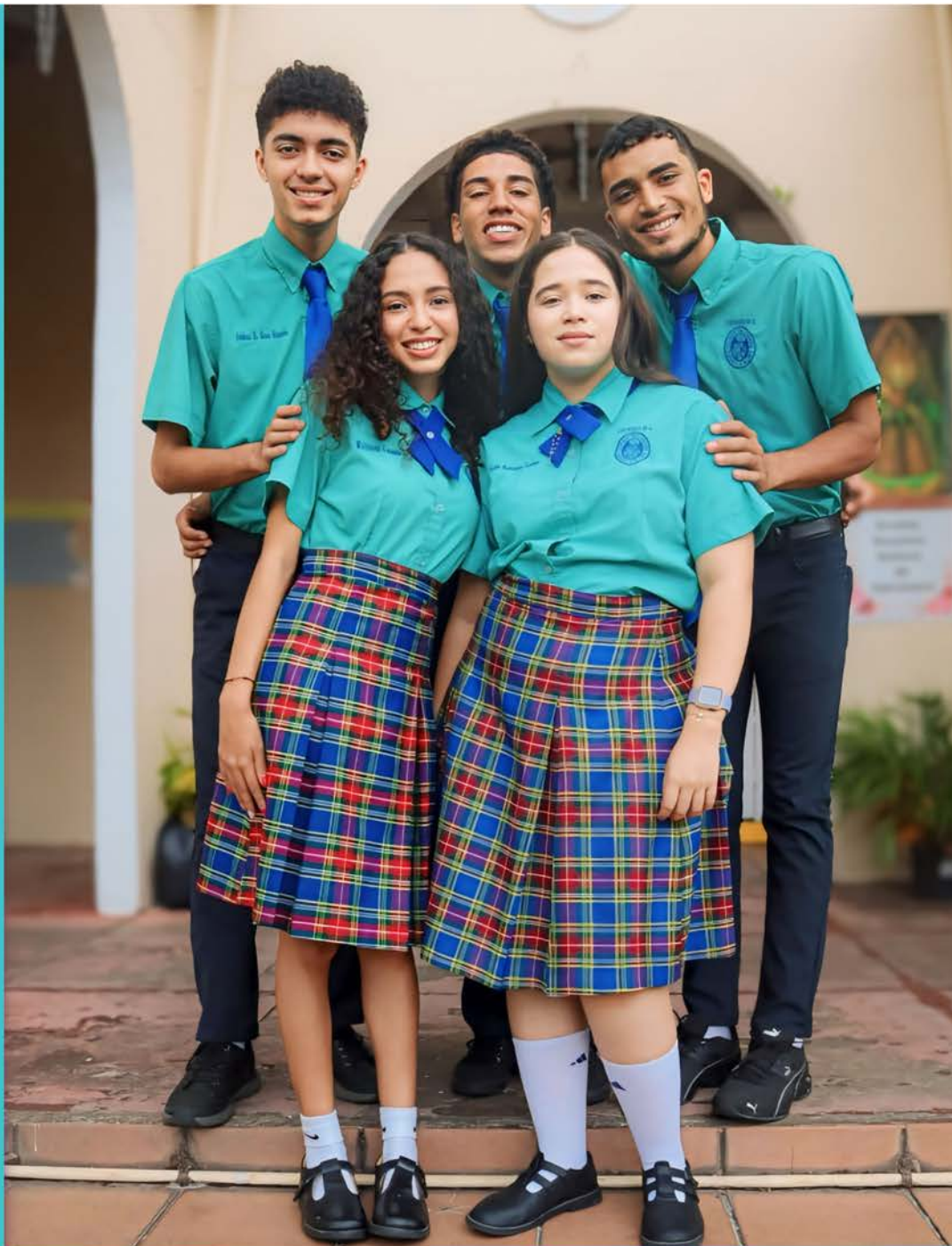
Foto: Estudiantes del colegio Ntra. Señora de Valuanera en Coamo