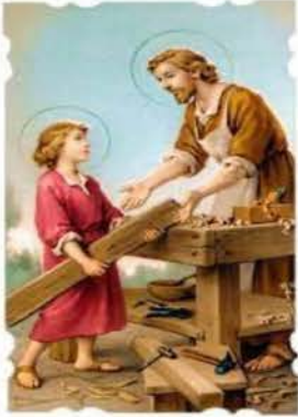
1 de mayo San José Obrero