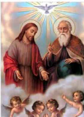
26 de mayo Santísima Trinidad