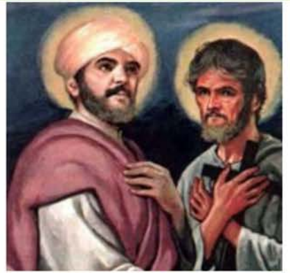
3 de mayo San Felipe, apóstol San Santiago, apóstol