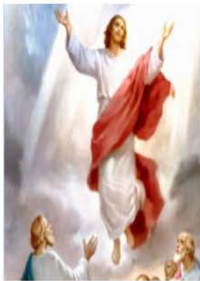
12 de mayo Ascensión del Señor