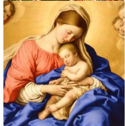
20 de mayo María, Madre de la Iglesia