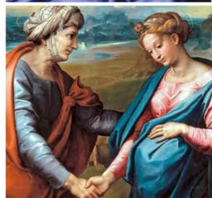
31 de mayo La Visitación de la Bienaventurada Virgen María