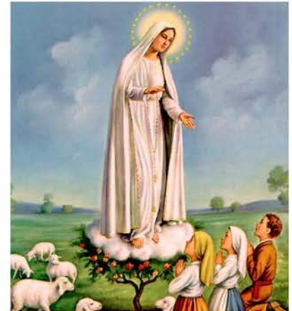
13 de mayo Nuestra Señora de Fátima