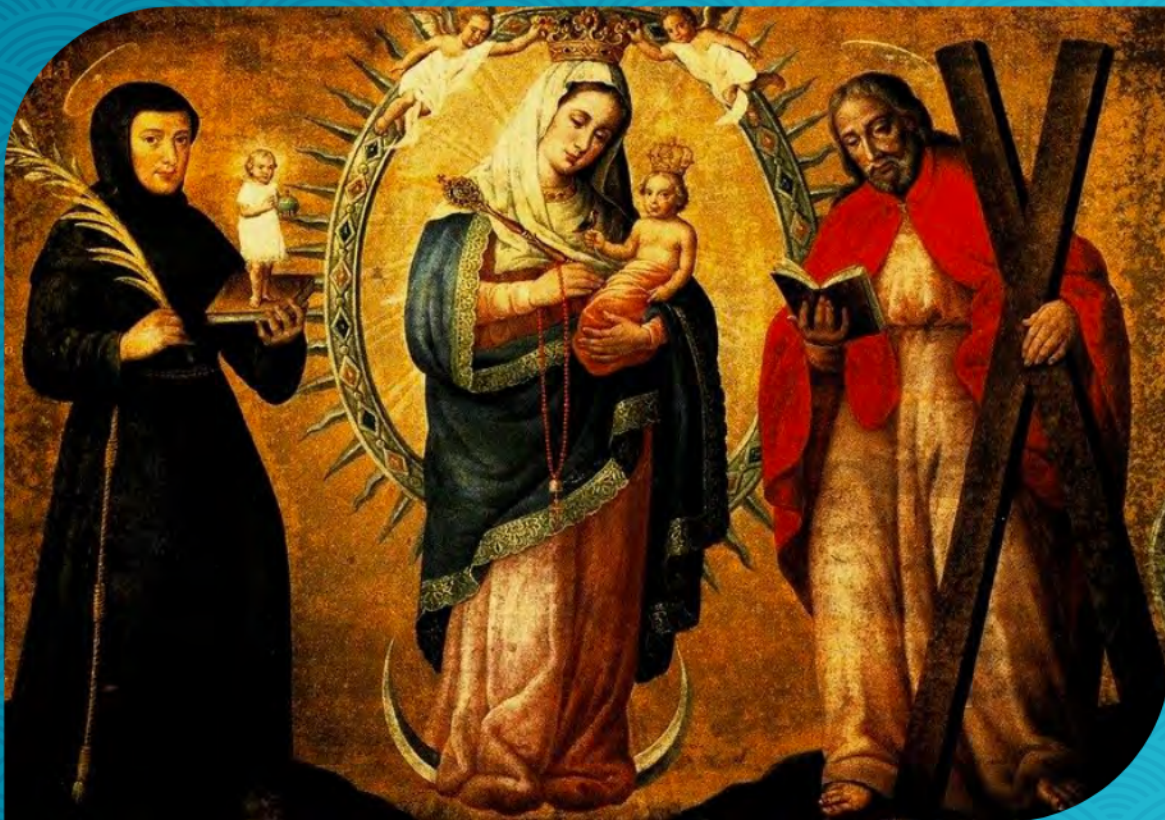
Nuestra Señora del Rosario de Chiquinquirá, patrona de Colombia

María Santísima es la presencia materna indispensable y decisiva en la gestación de un pueblo de hijos y hermanos, de discípulos y misioneros de su Hijo. (DAP 524).