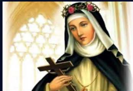
30 de agosto Santa Rosa de Lima