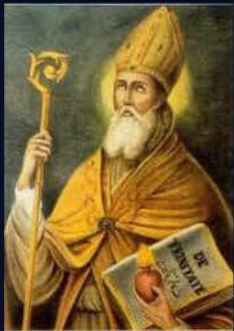
28 de agosto San Agustín, obispo y doctor de la Iglesia