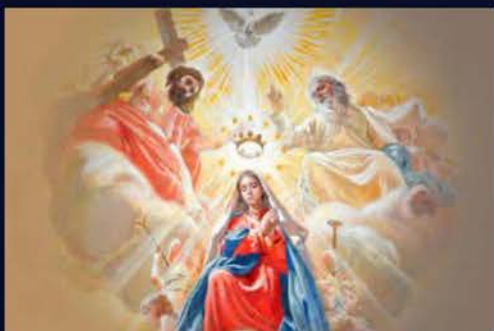
22 de agosto Santa María Reina