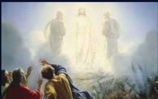
6 de agosto La Transfiguración del Señor

Oremos para que las sociedades en que la convivencia parece más difícil no sucumban a la tentación del enfrentamiento por motivos étnicos, políticos, religiosos o ideológicos.