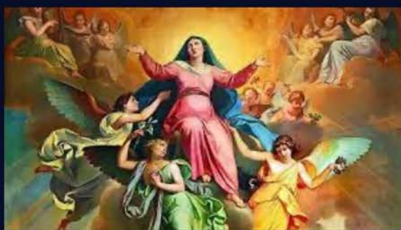
15 de agosto La Asunción de la Santísima Virgen María