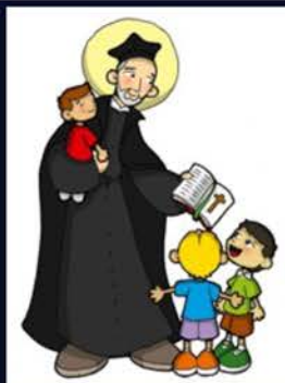
25 de agosto San José de Calasanz, presbítero