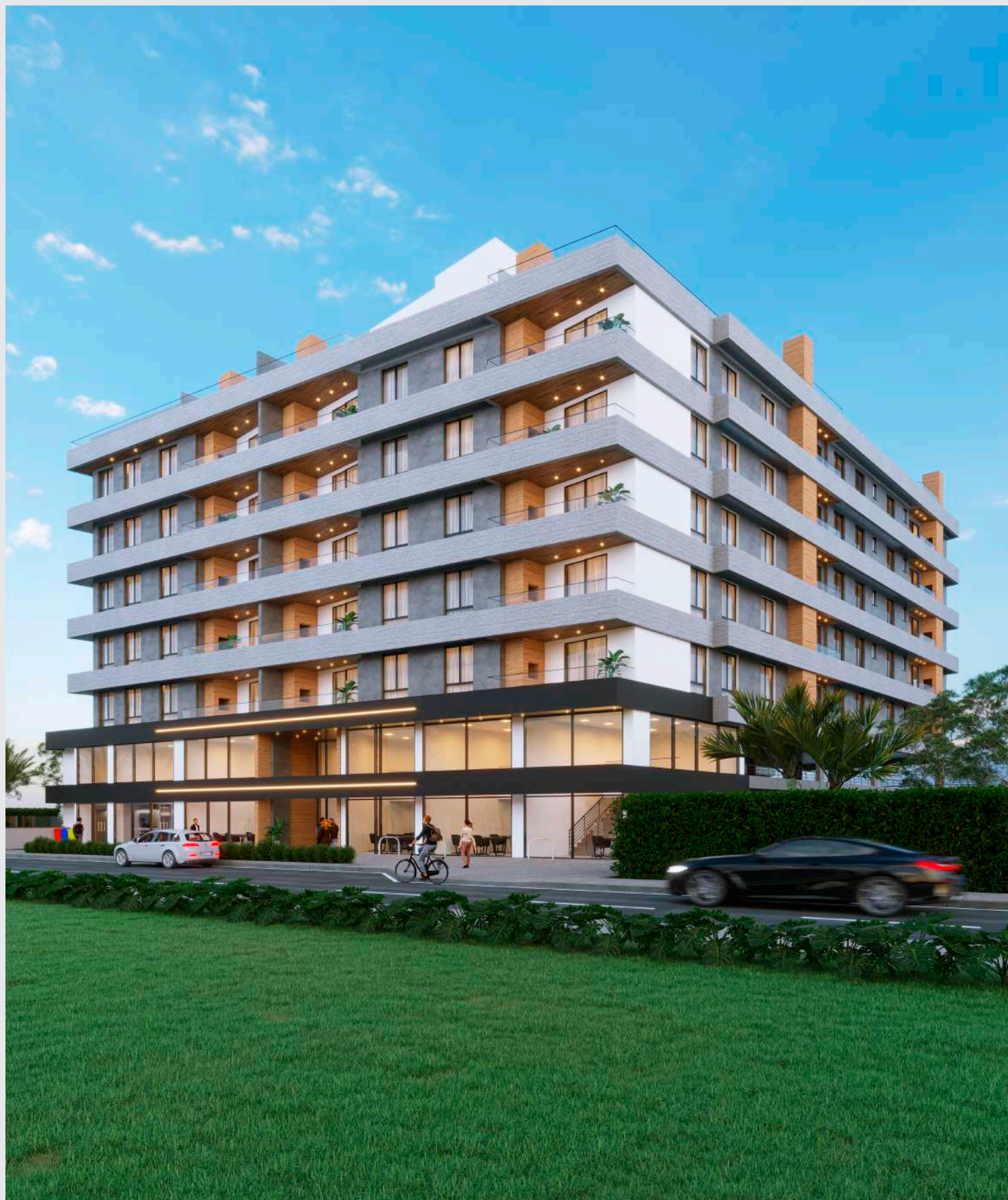
Fachada fim de tarde