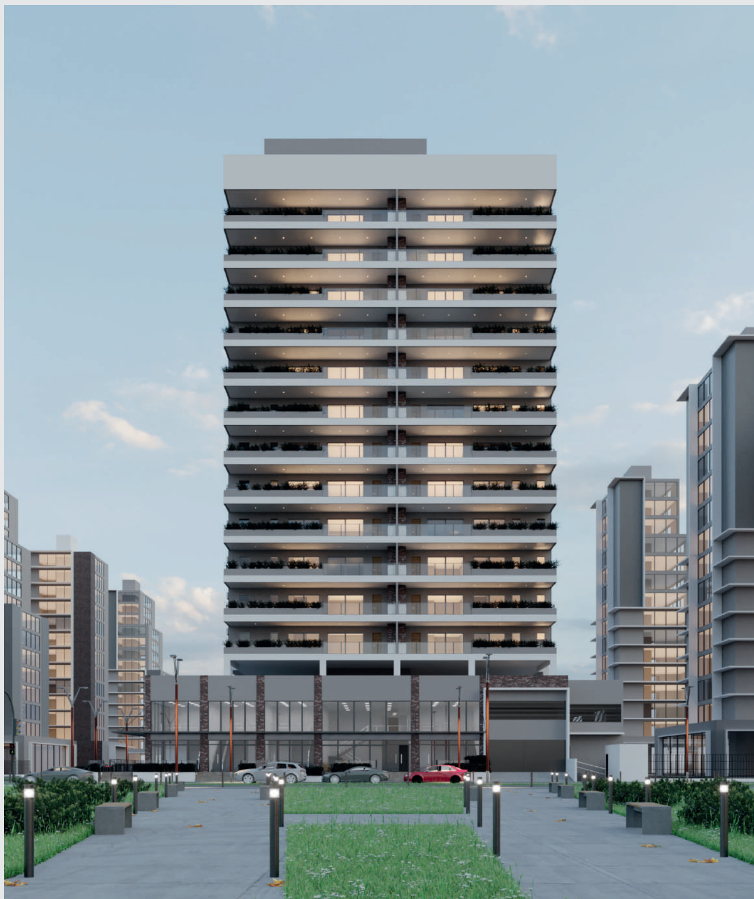
Fachada fim de tarde