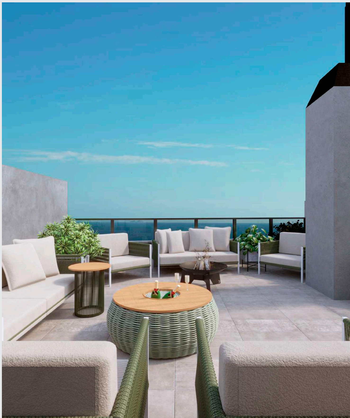
Coberlura - externa