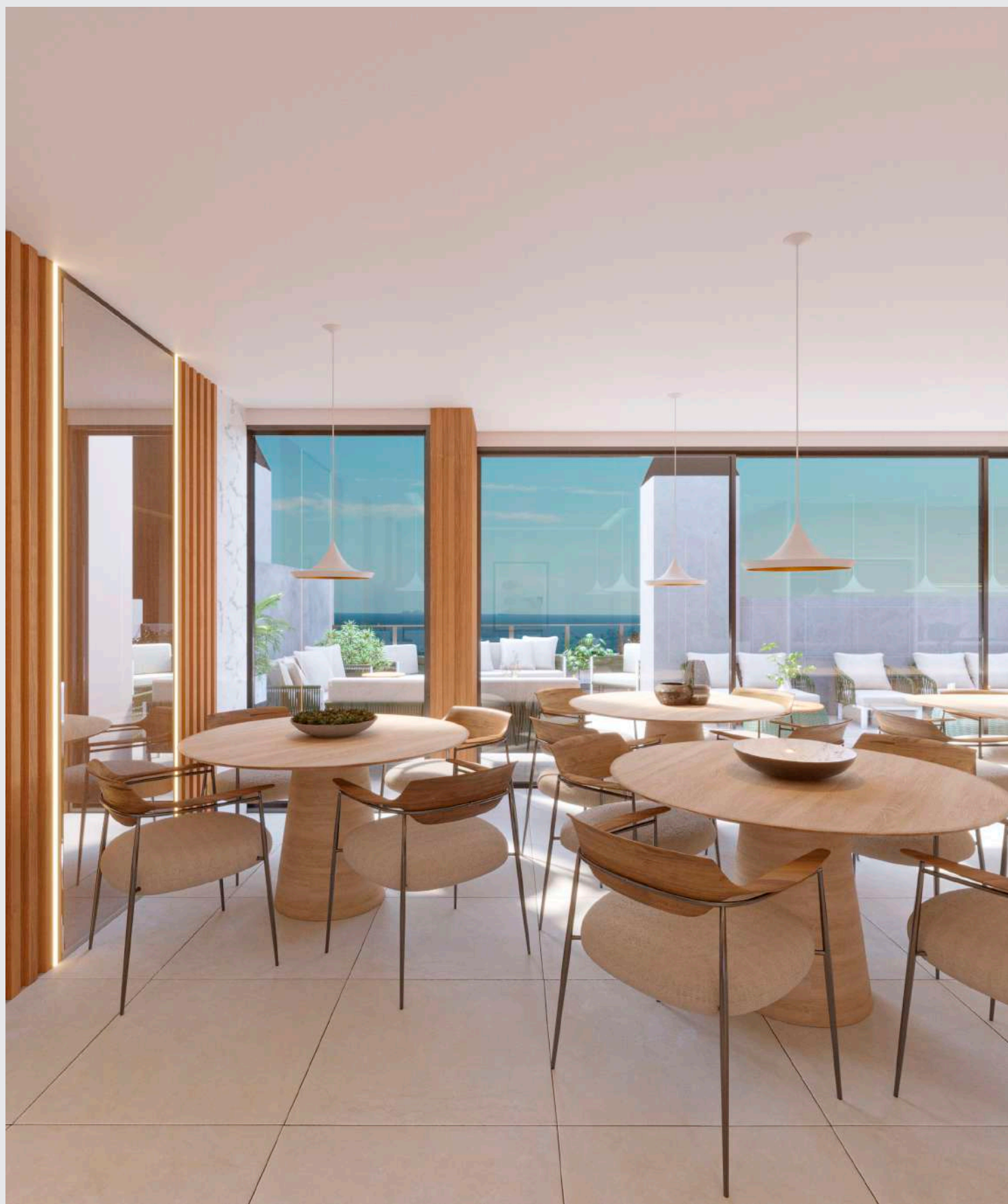
Salão de festas - mesas