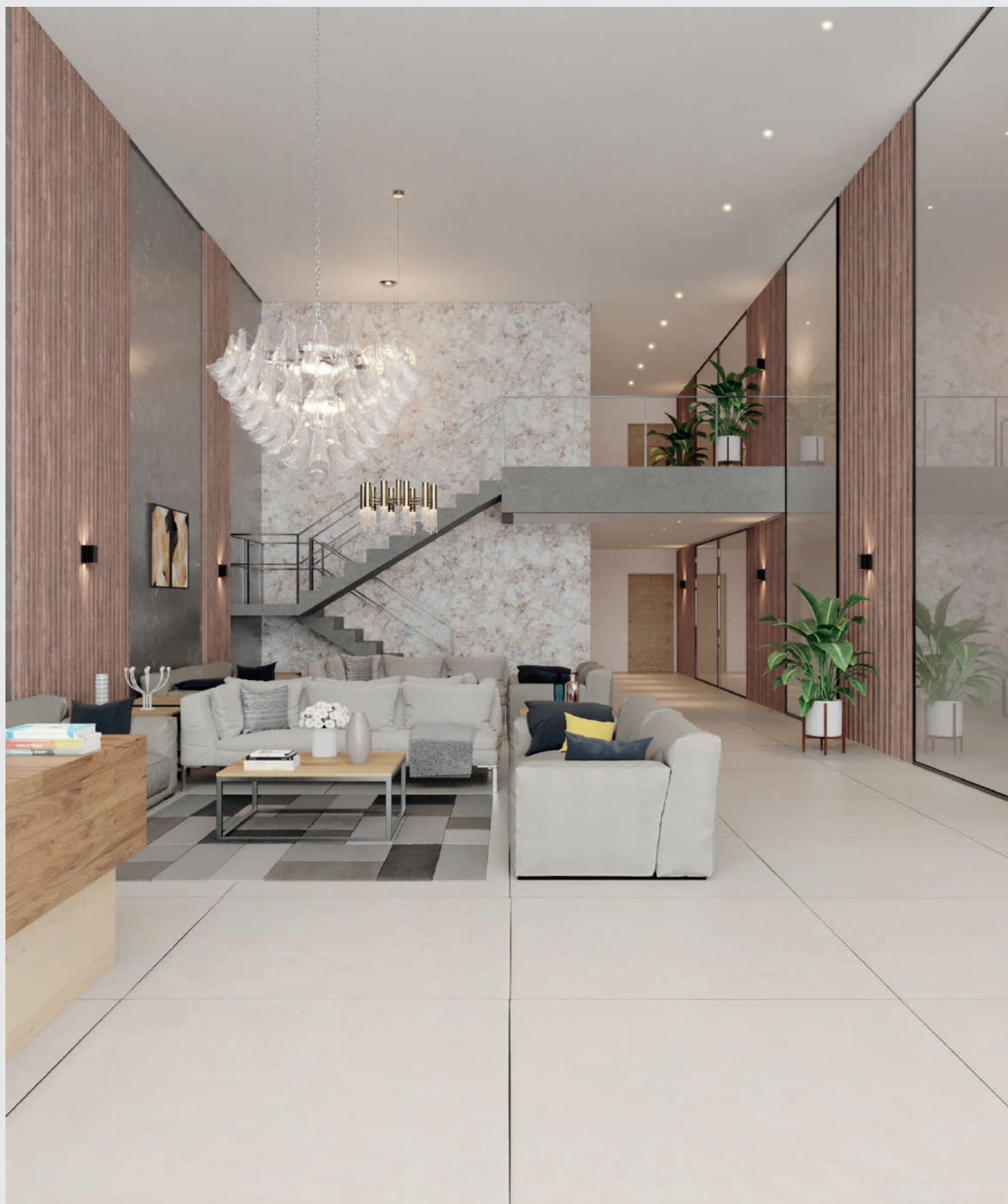
Hall de entrada