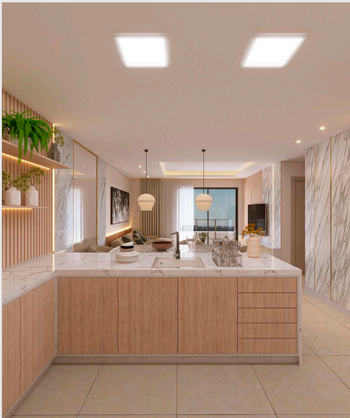
Living - cozinha