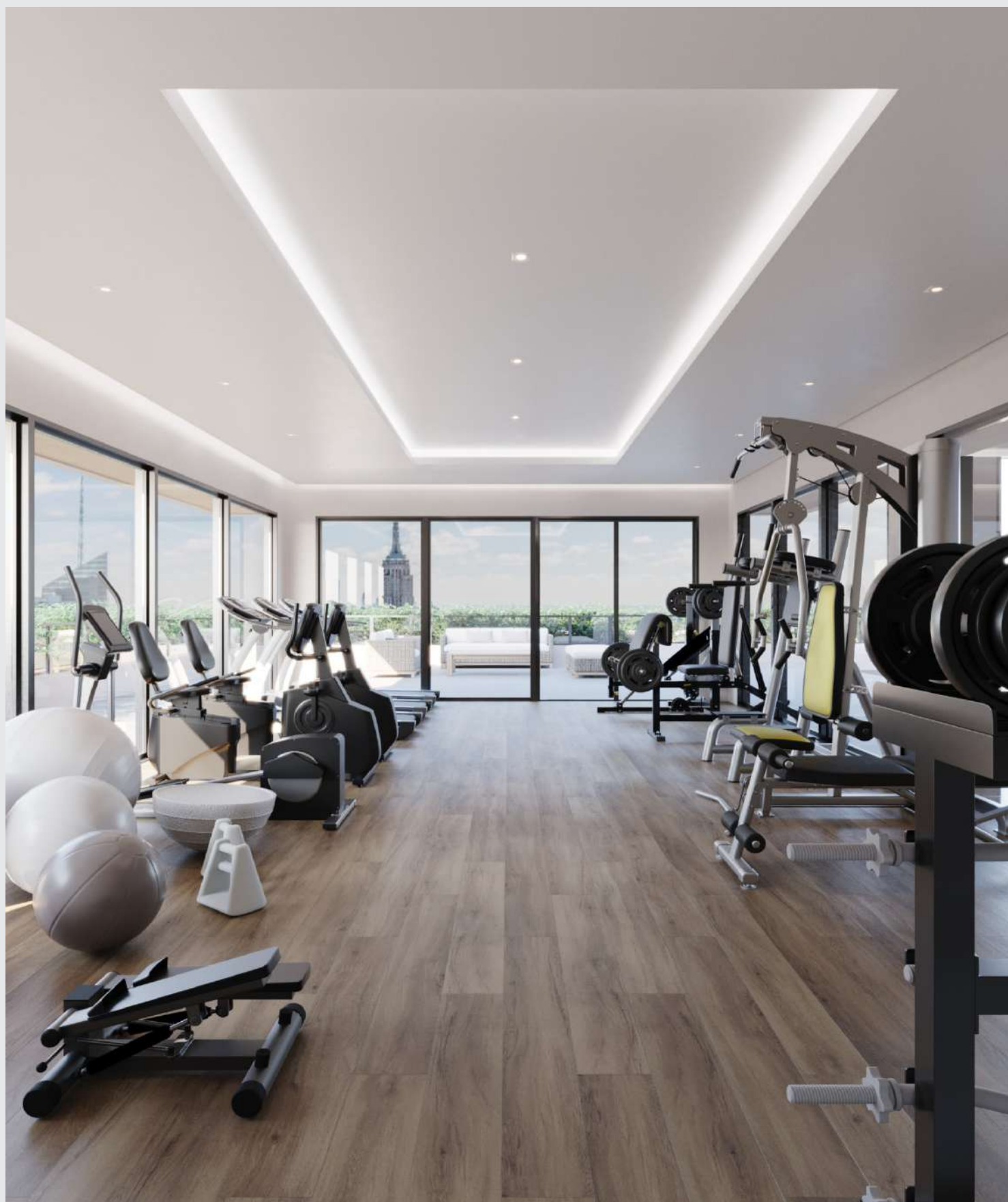
Academia - coberlura