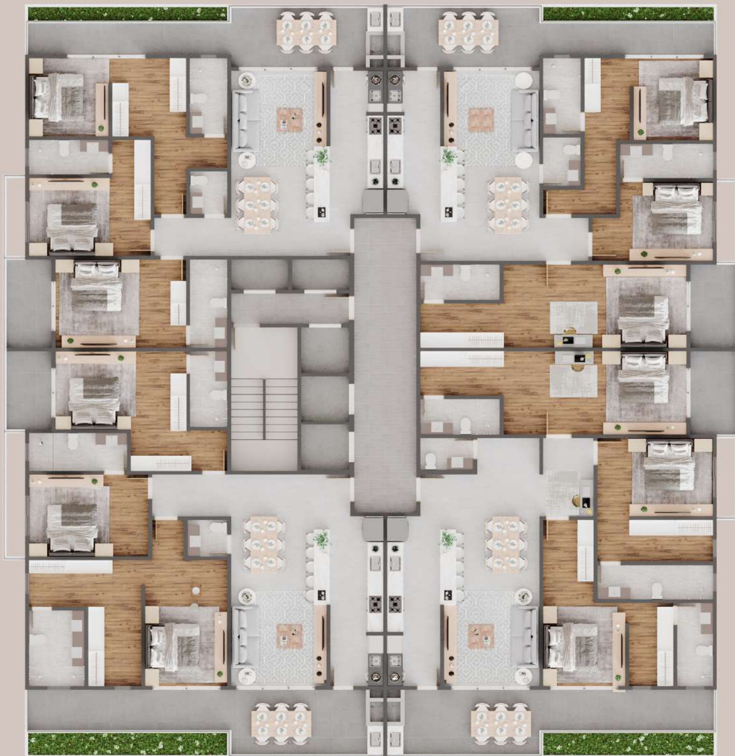
Planța humanizada - tipo