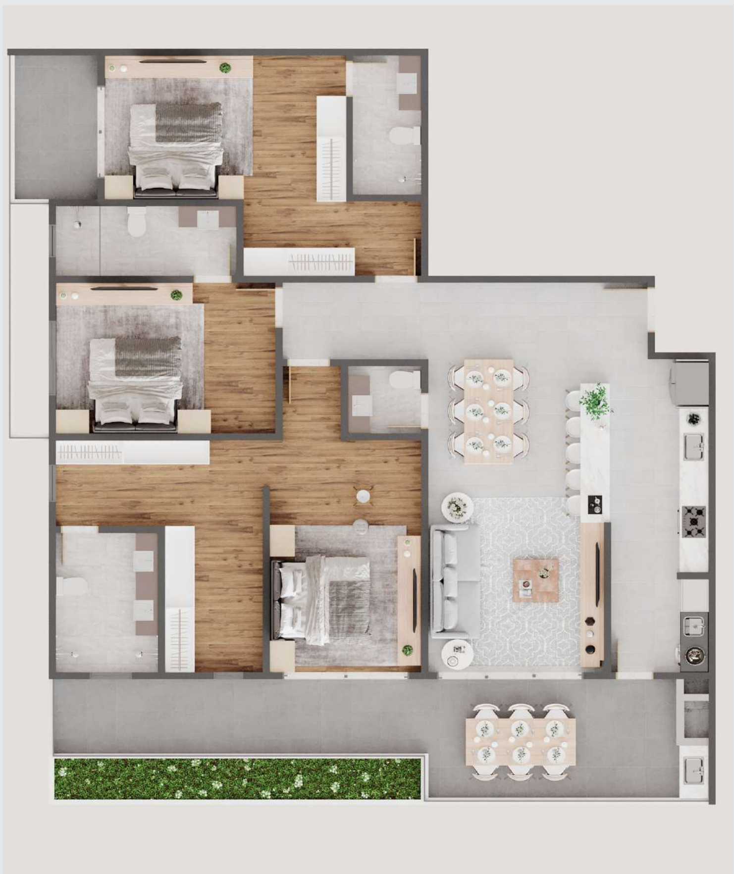
Apartamento - tipo