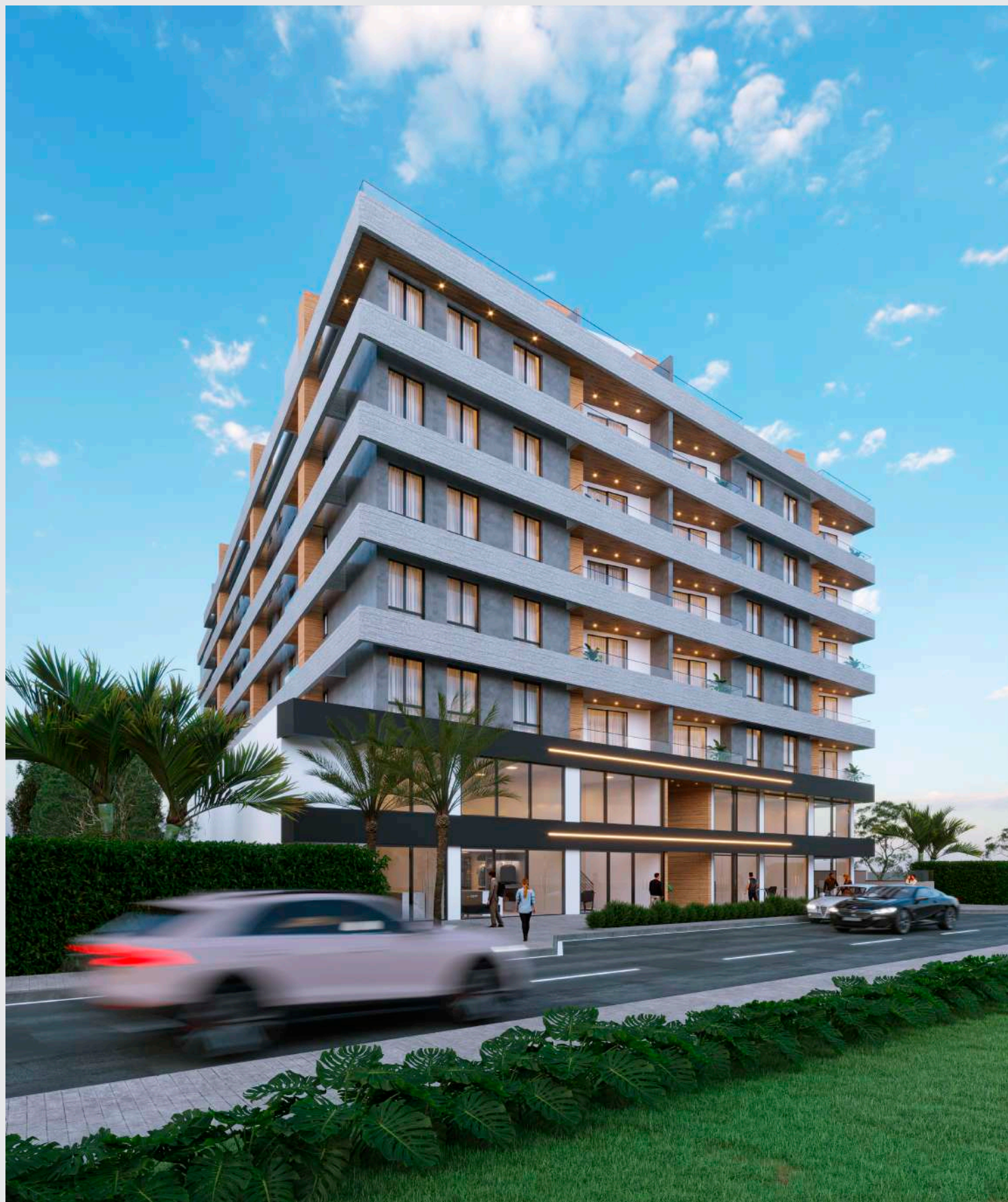
Fachada fim de tarde