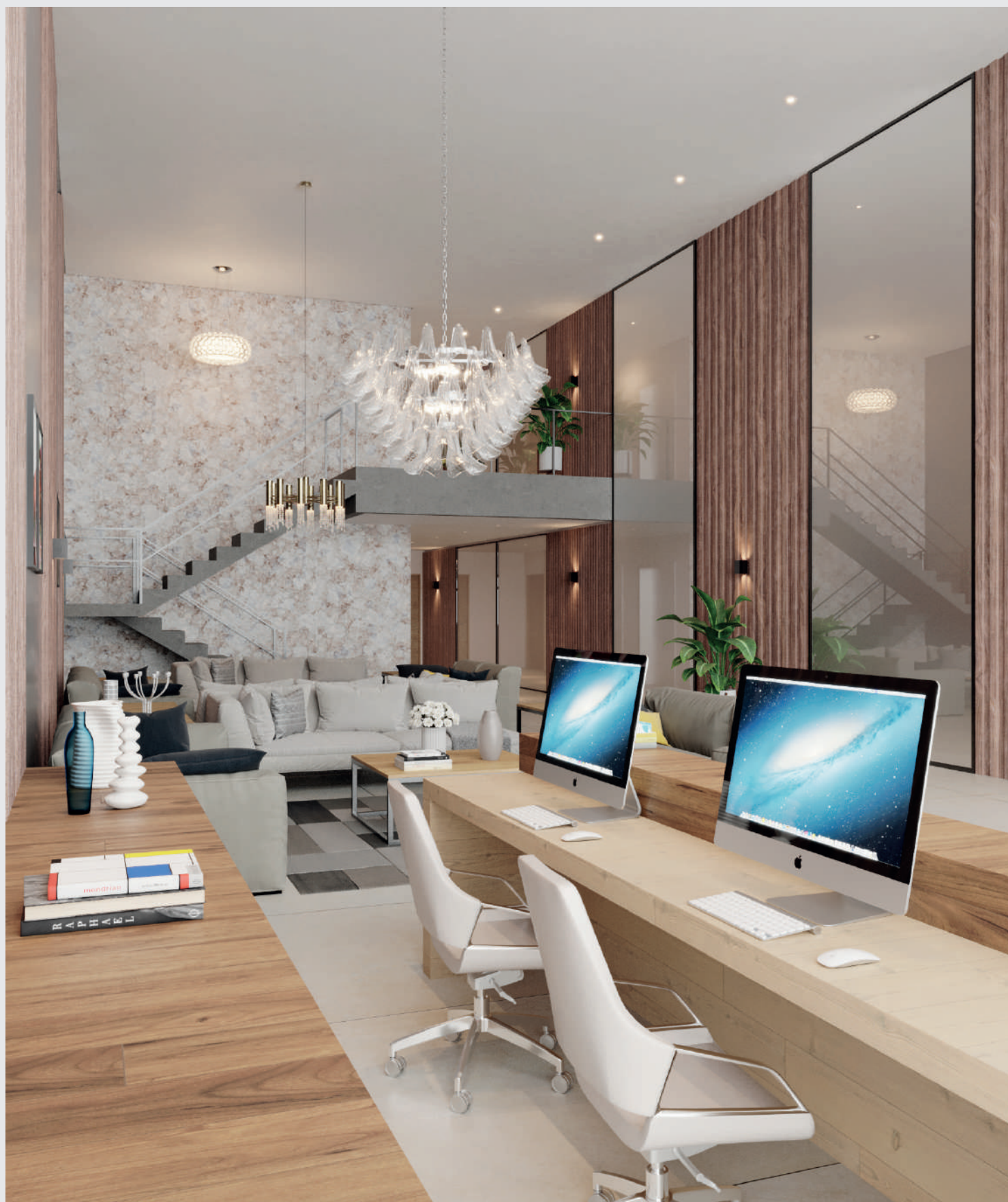
Hall de entrada - recepção