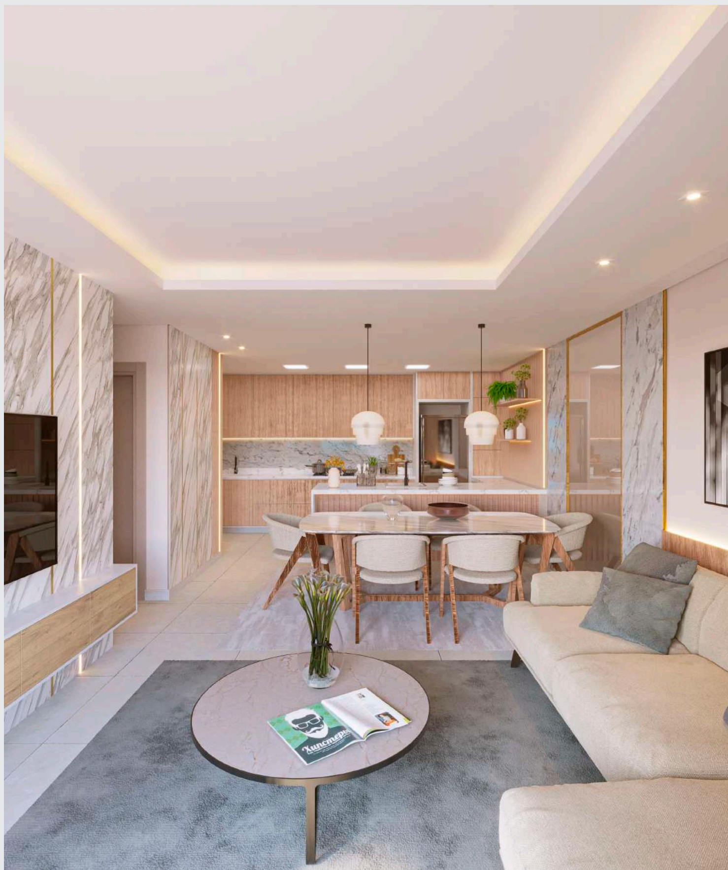
Living - sala