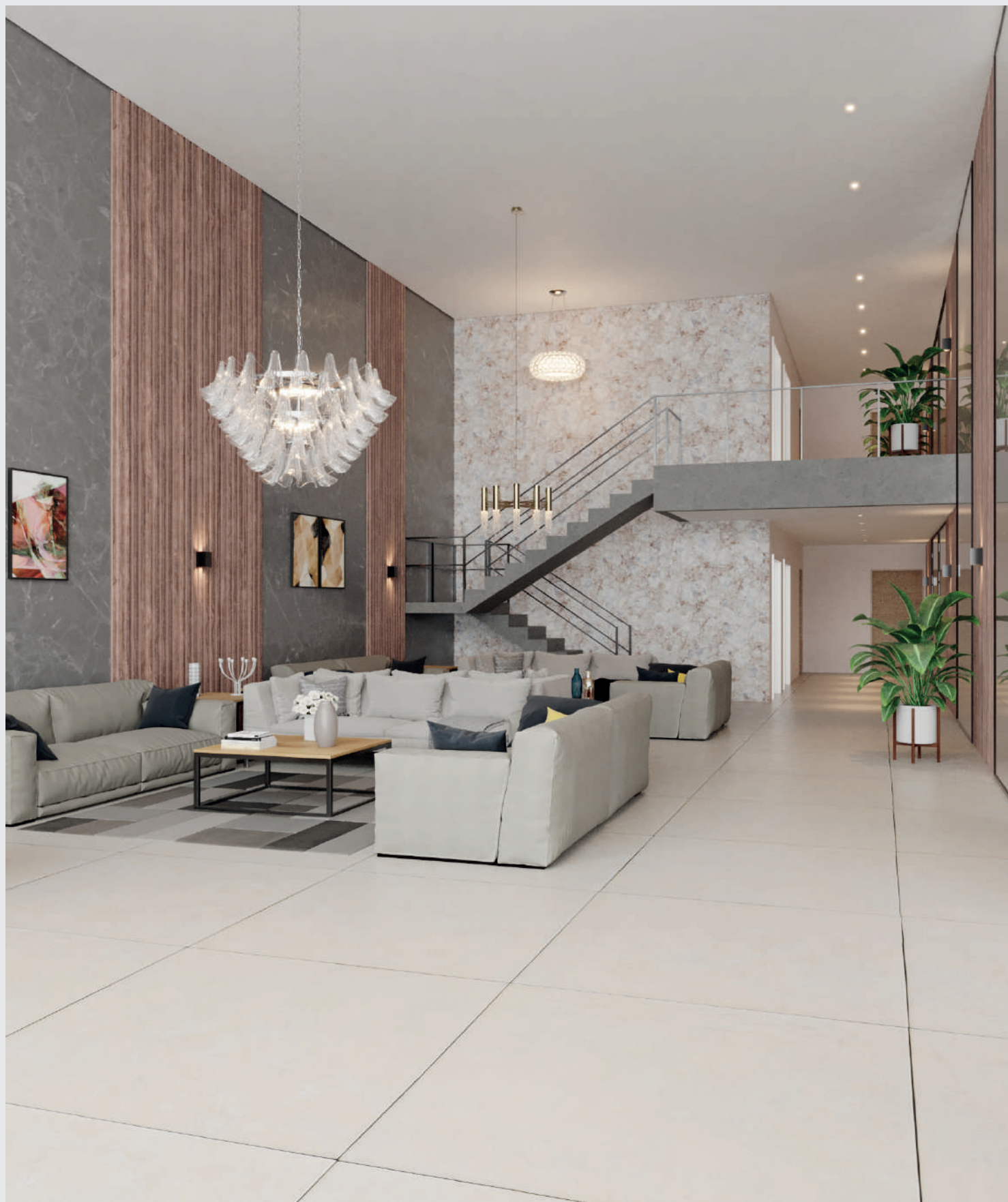
Hall de entrada