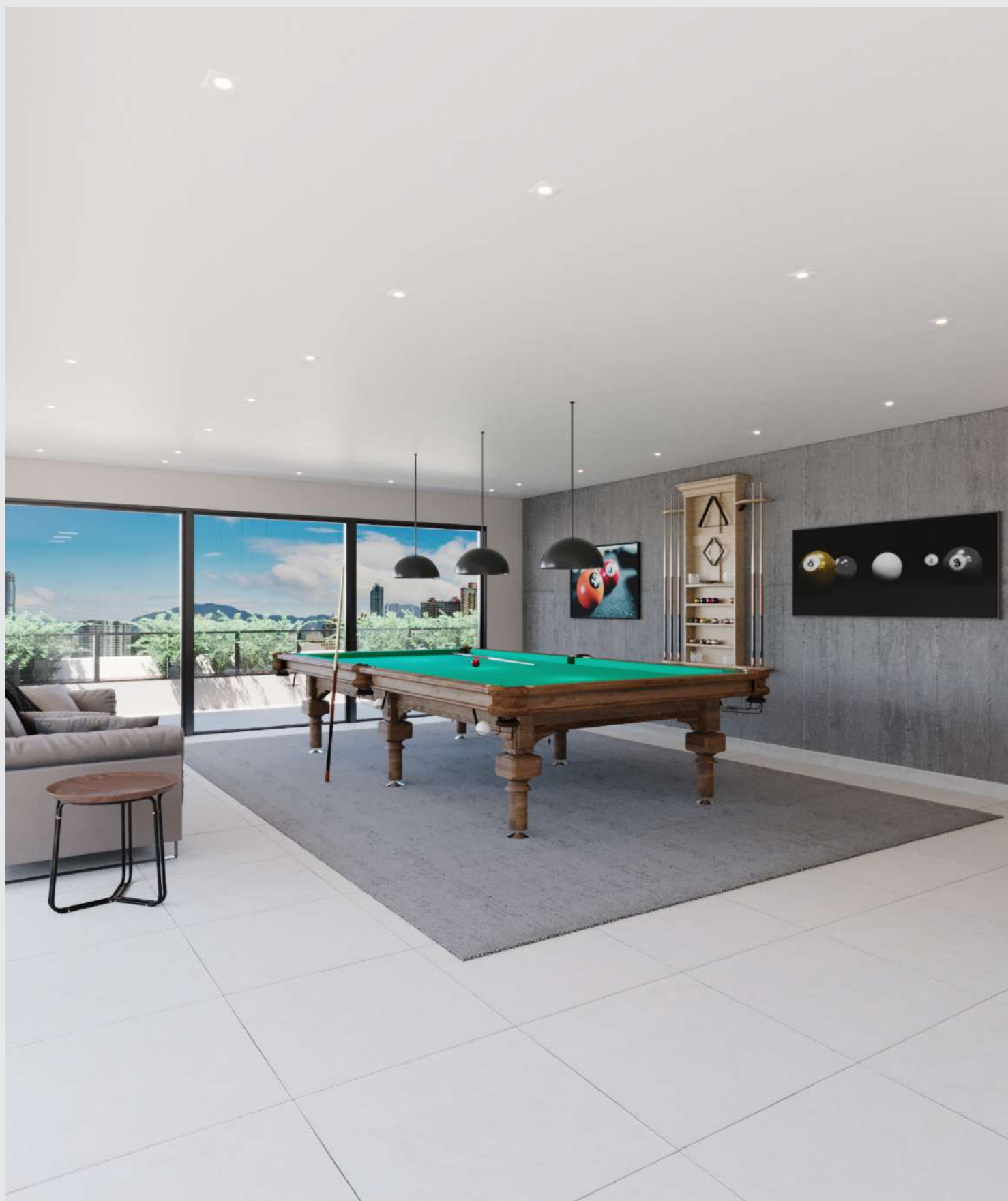
Sala de jogos - cobertura