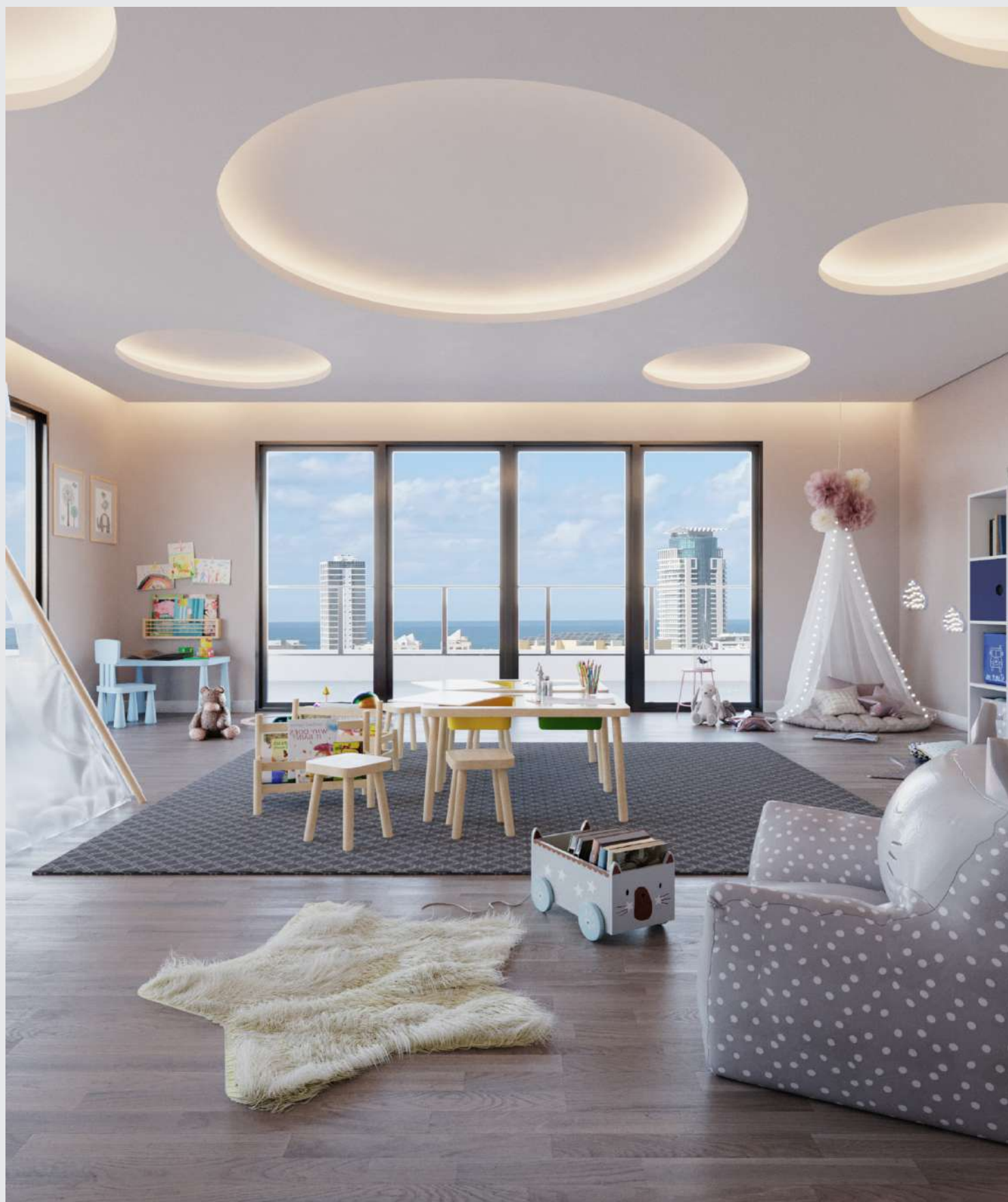
Brinquedoteca - cobertura