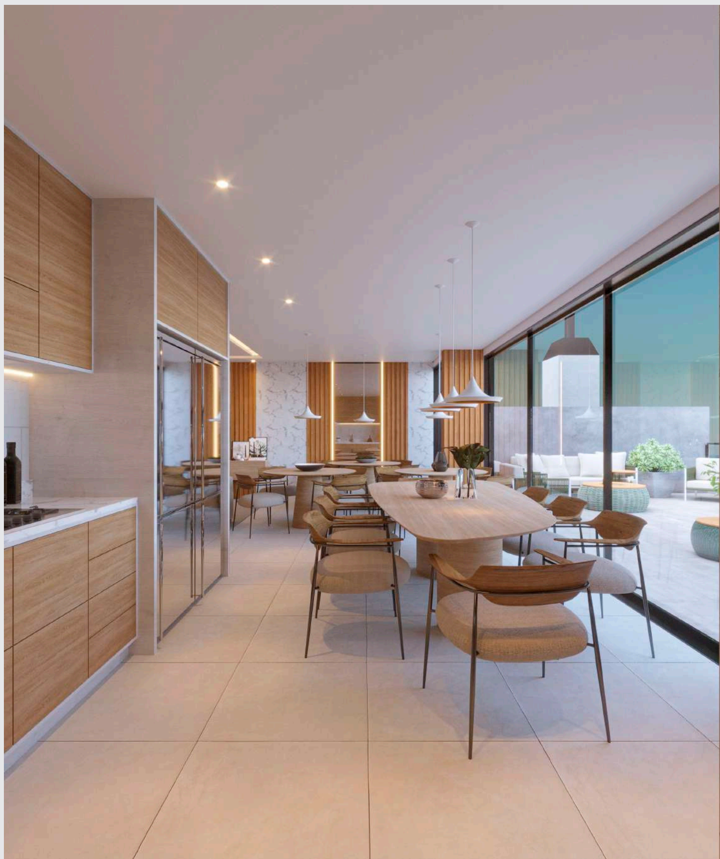
Salão de festas - mesas