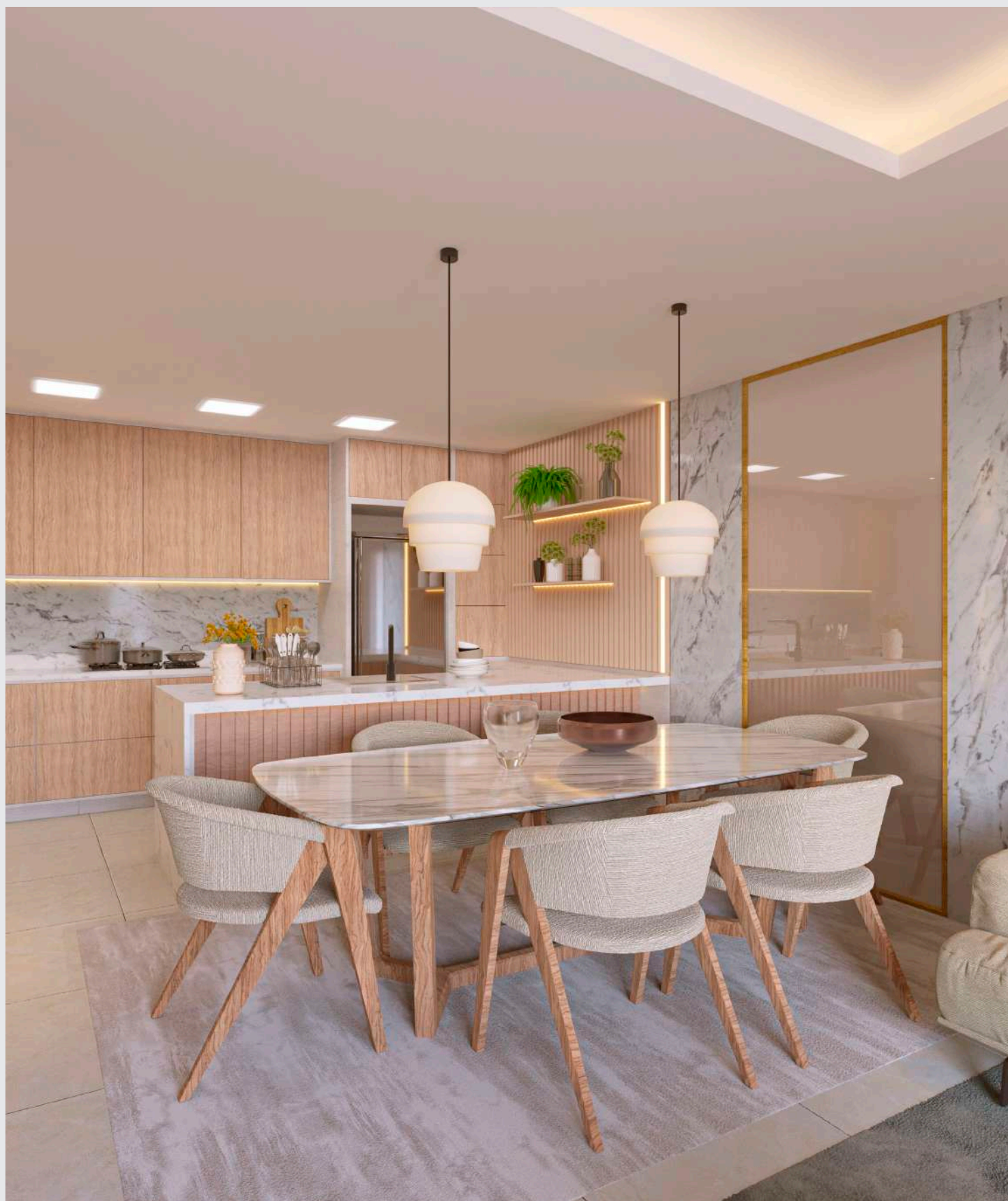
Living - janlar