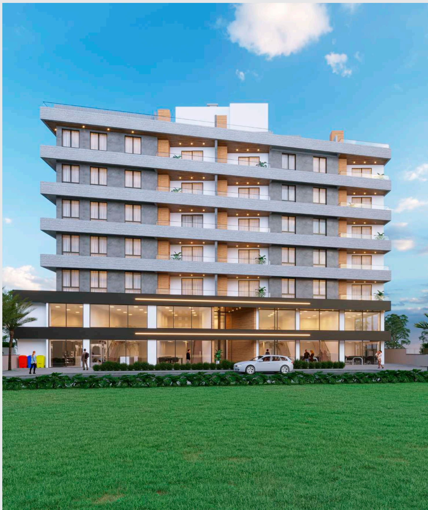
Fachada fim de jarde