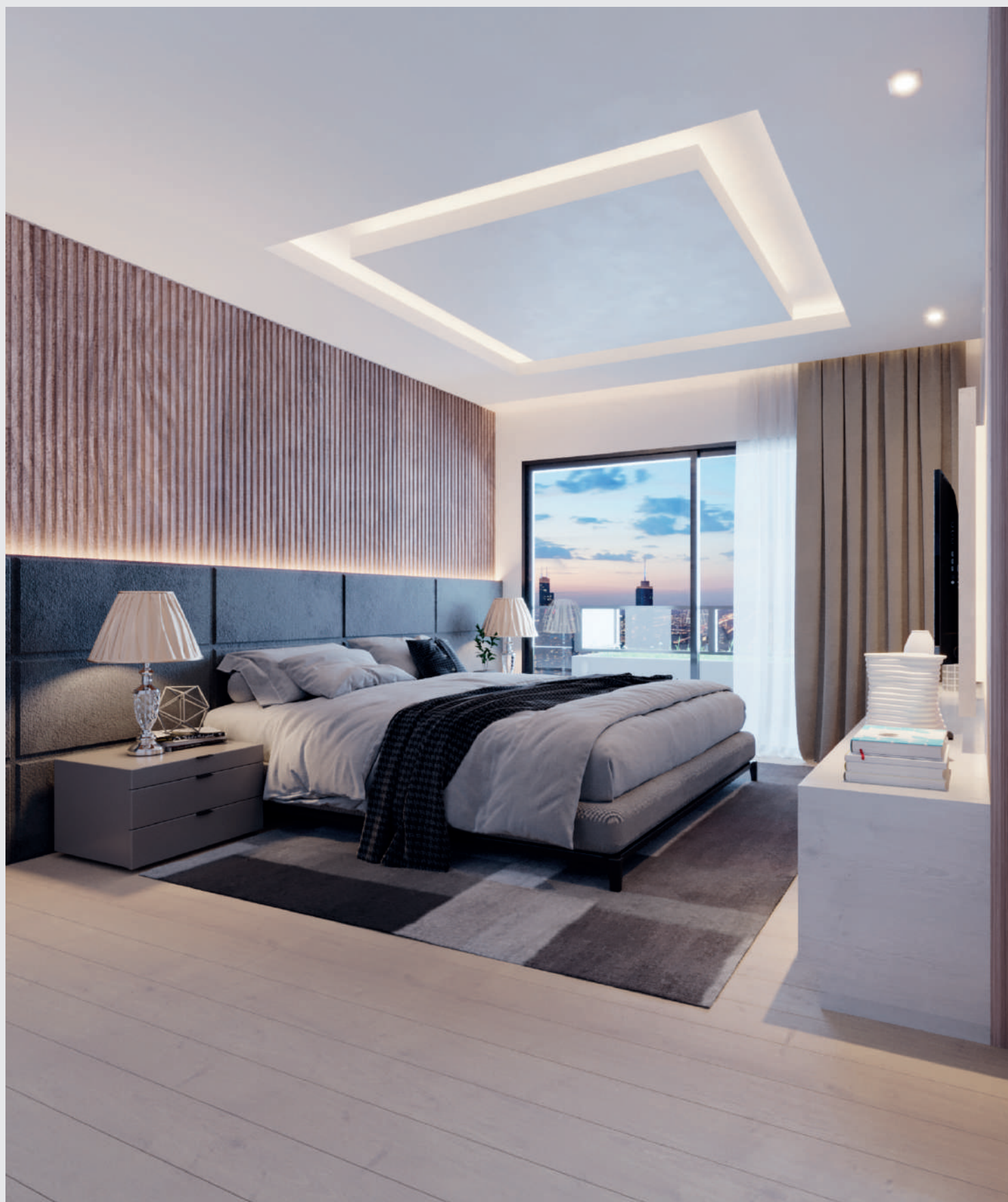
Suíte master - fim de tarde