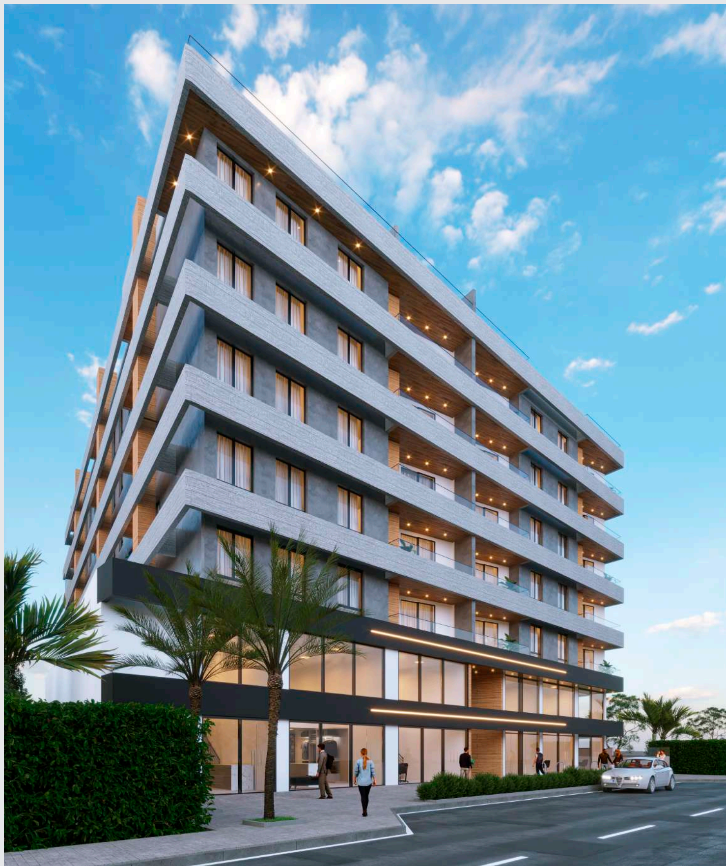
Fachada fim de tarde