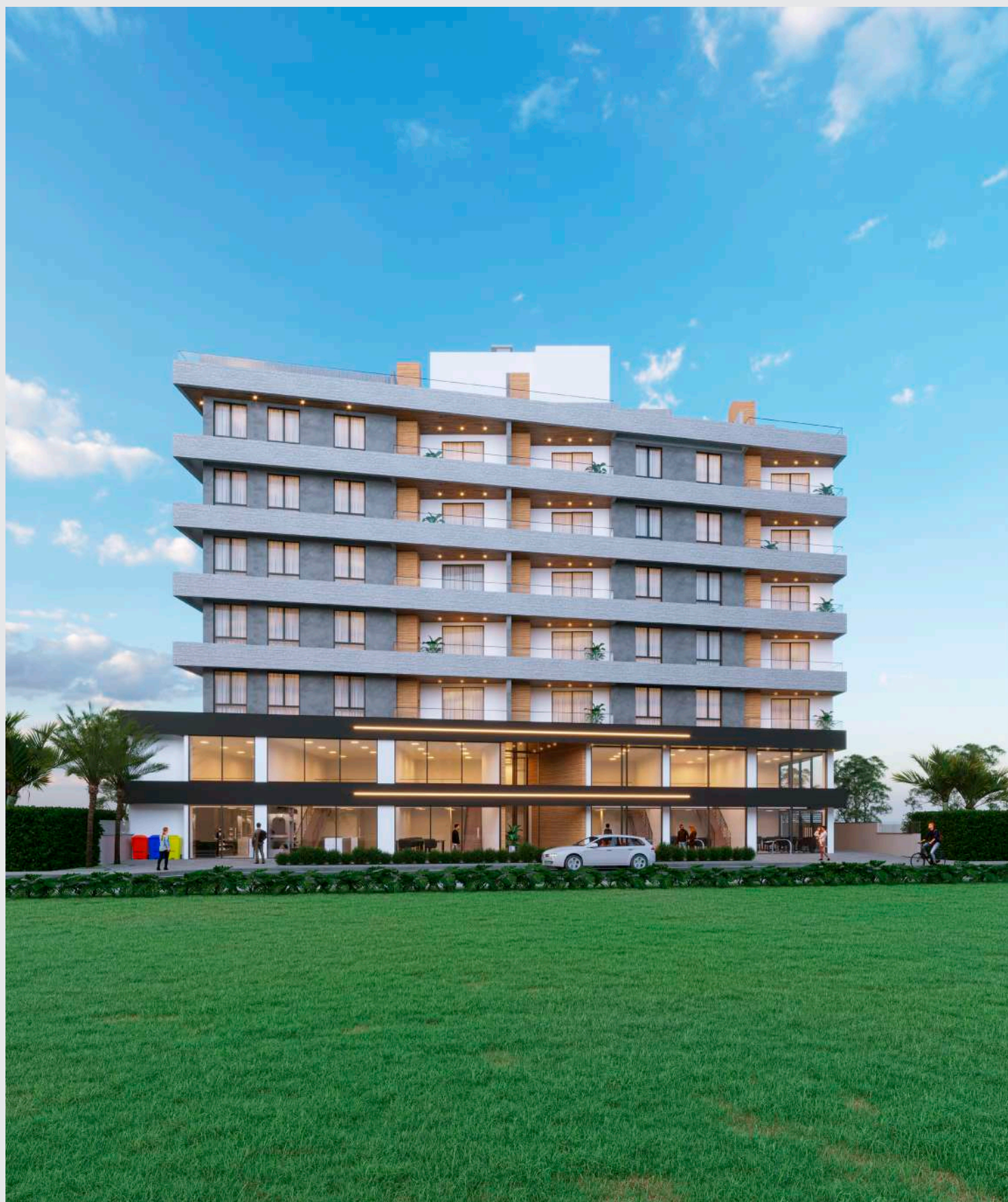
Fachada fim de tarde