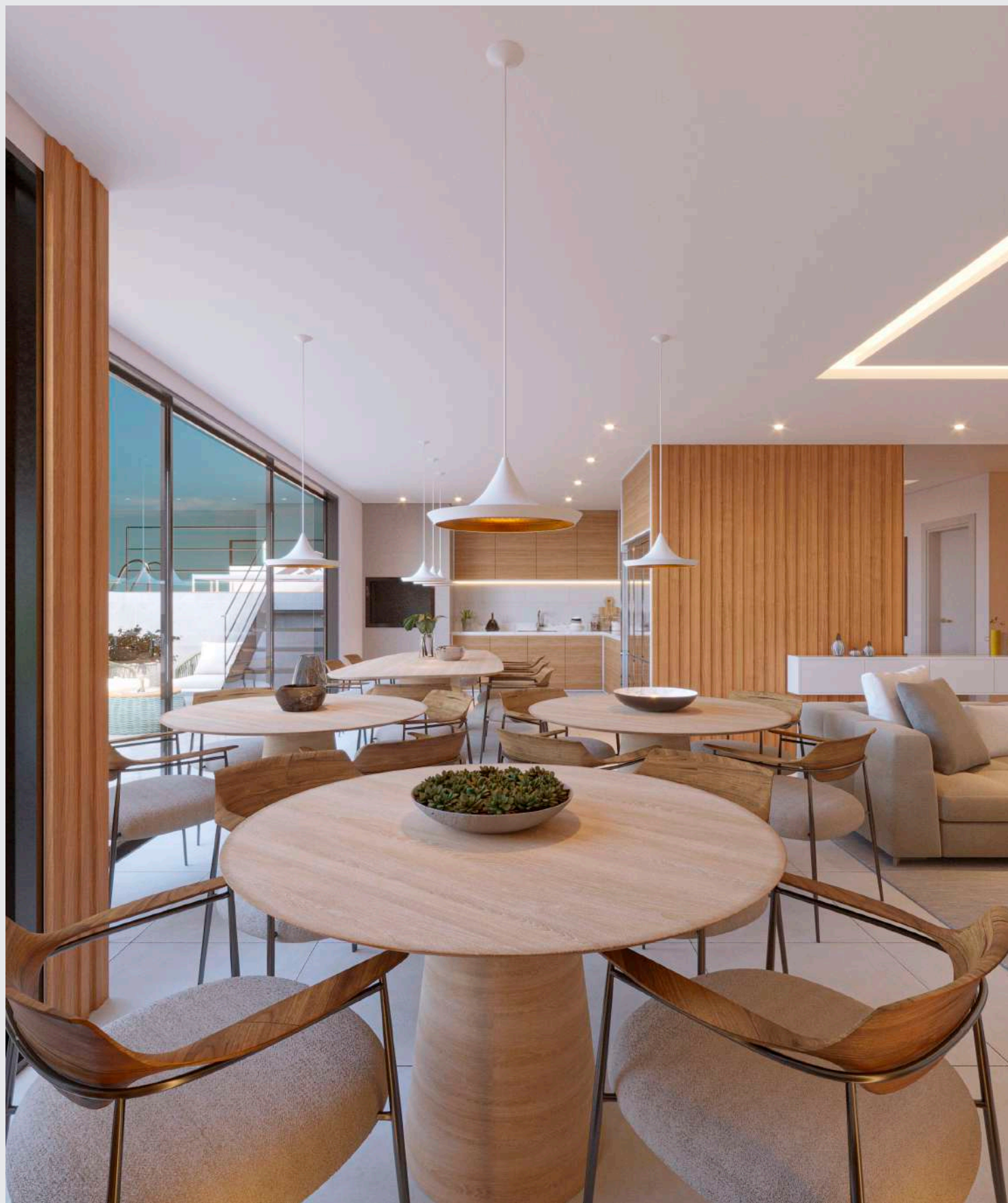
Salão de festas - mesas