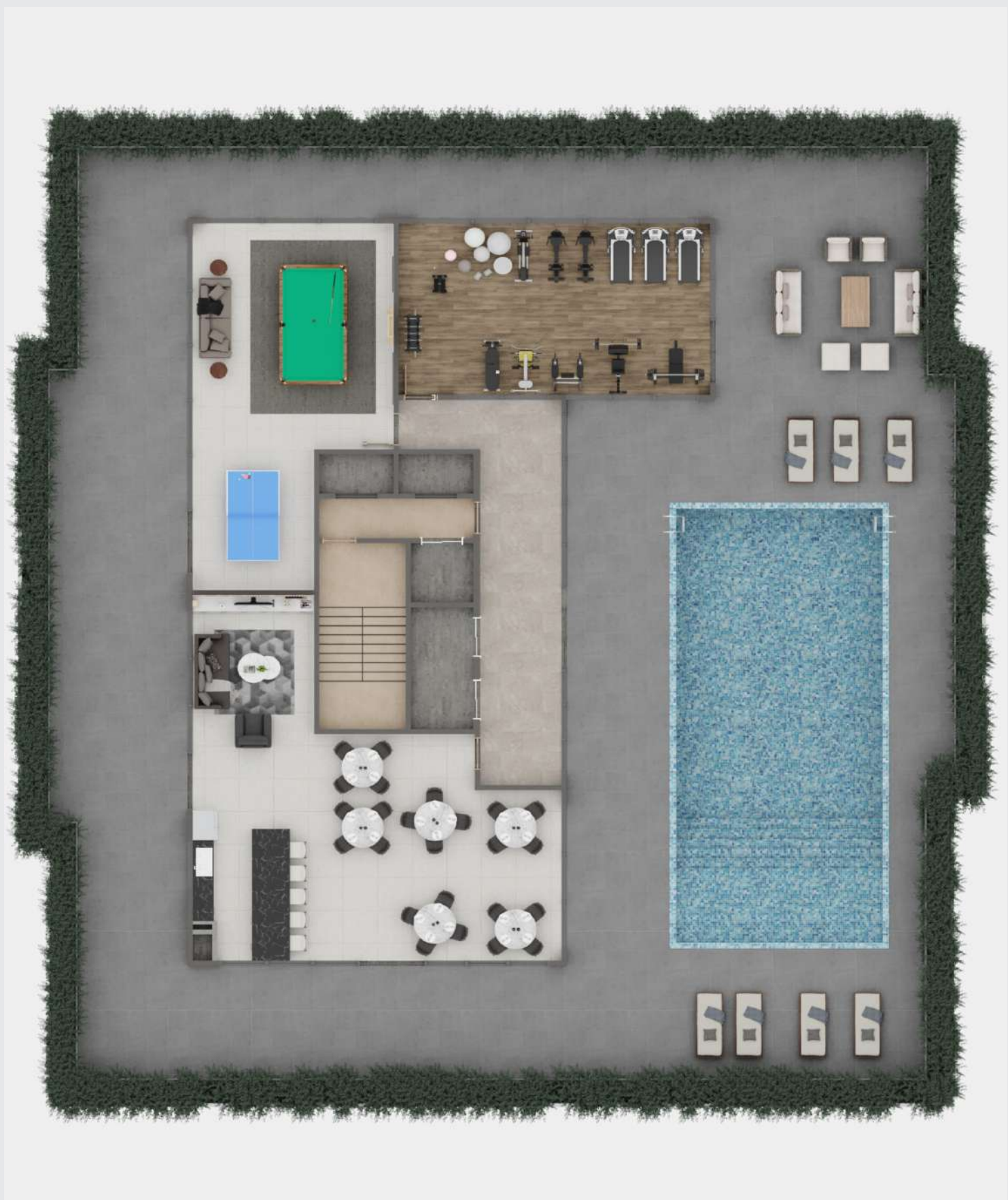
Humanizada - cobertura