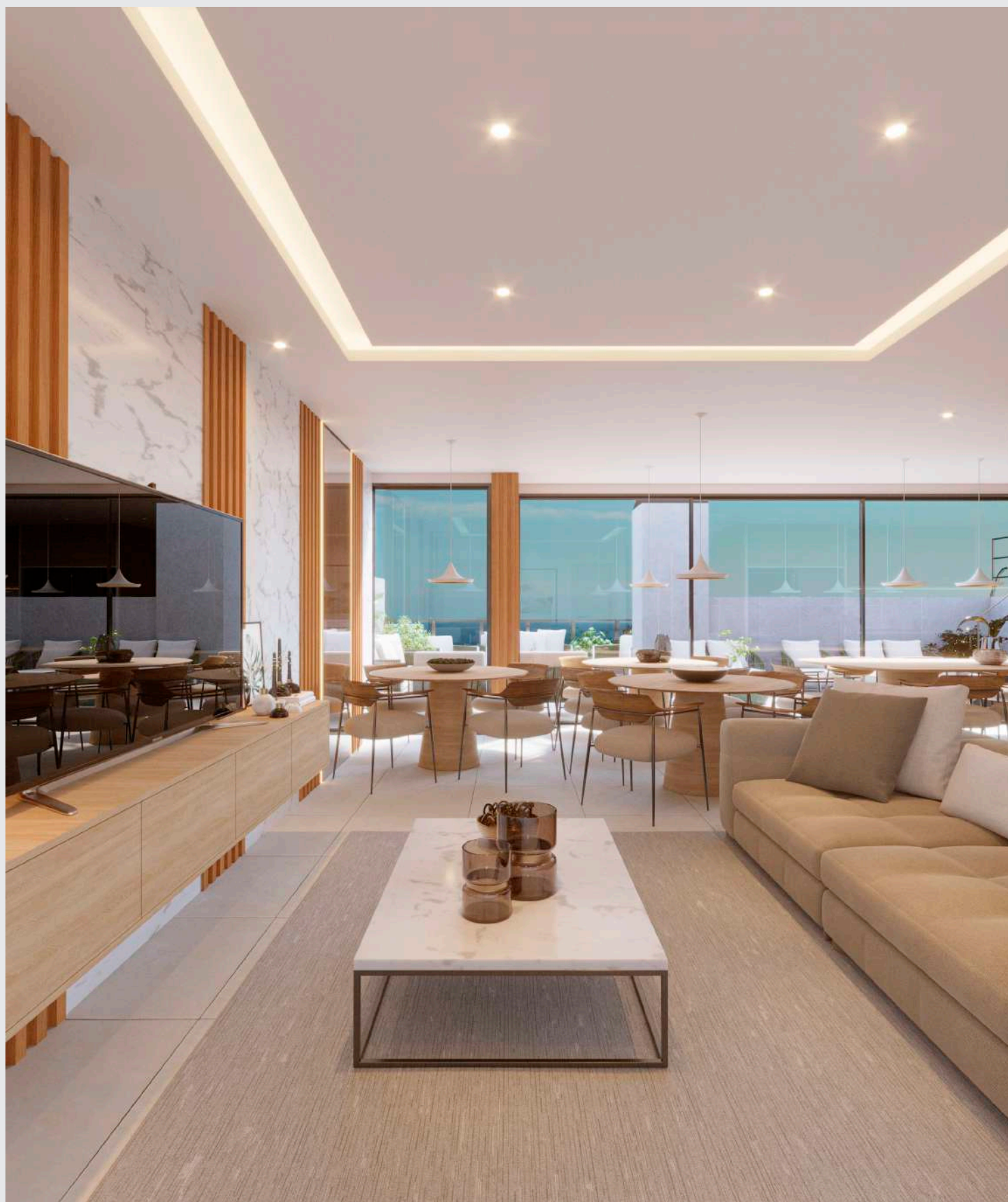
Salão de festas - sala de tv