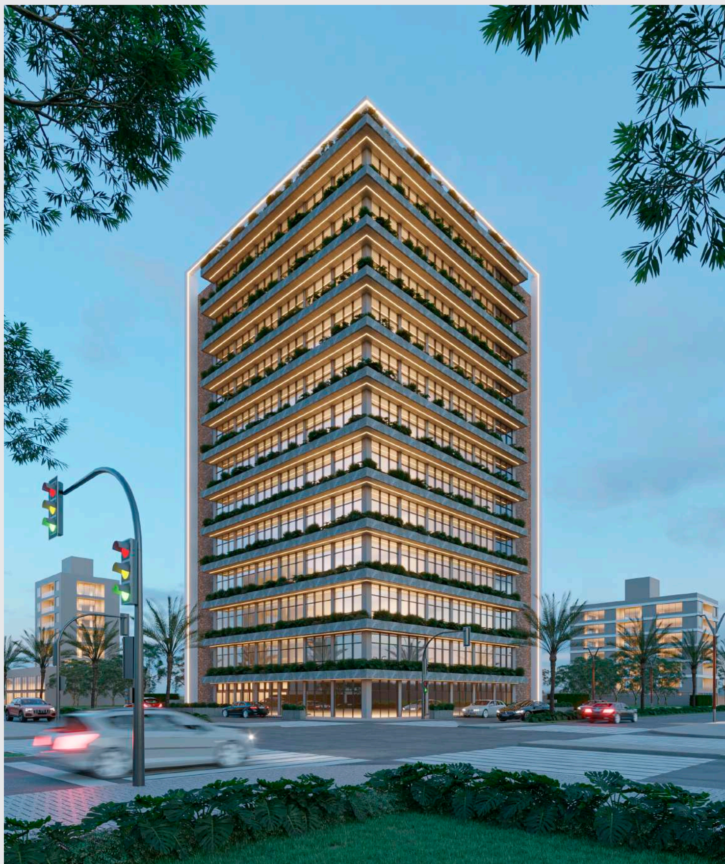
Fachada fim de tarde