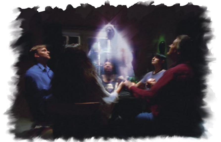
மரித்தவர்கள் உயிரோடிருக்கிறவர்களோடு தொடர்புகொள்ளக்கூடும் என்று இலட்சக்கணக்கானோர் எண்ணியிருந்தாலும், அவ்விதம் தொடர்புகொள்ள முடியாது.

பதில்: இல்லை. மரித்தவர்கள் உயிரோடிருக்கிறவர்களோடு தொடர்புகொள்ள முடியாது. உயிரோடிருக்கிறவர்கள் என்ன செய்கிறார்கள் என்பதை அவர்களால் அறியவும் முடியாது. அவர்கள் மரித்தவர்கள். அவர்களுடைய நினைவுகள் அழிந்துபோயின (சங்கீதம் 146:4).