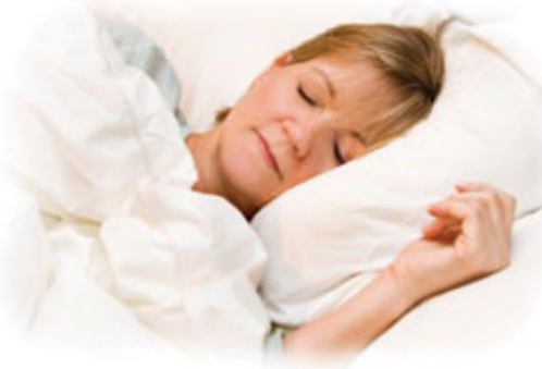
இயேசு மரணத்தை “நித்திரை” என்று அழைக்கிறார். முற்றிலும் நினைவற்ற நிலை அது.

9. யோவான் 11:11-14-ல் மரித்தவர்களின் நினைவற்ற நிலையை இயேசு “நித்திரை” என்று அழைக்கிறார். அவர்கள் எவ்வளவு காலம் நித்திரை செய்வார்கள்?