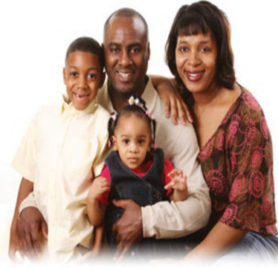
இந்த நான்கு மனிதர்களும் நான்கு ஆத்துமாக்கள்.