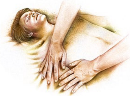
ஆதியில் ஆதாம் தேவனால் உண்டாக்கப்பட்டான்.

பதில்: தேவன் ஆதியிலே மண்ணிலிருந்து நம்மை உண்டாக்கினார்.