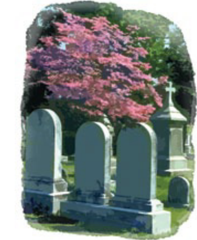
மரித்த நீதிமான்கள் மற்றும் துன்மார்க்கருடைய ஆவிகள் தேவனிடத்திற்குத் திரும்புகிறது; அவர்களுடைய சரீரங்கள் மண்ணிற்குத் திரும்புகிறது.

பதில்: மரிக்கிற நபர் நீதிமானாயிருந்தாலும் துன்மார்க்கனாயிருந்தாலும், அவருடைய சரீரம் மீண்டும் மண்ணிற்குத் திரும்ப, ஆவி தன்னைத் தந்த தேவனிடத்திற்குத் திரும்புகிறது.