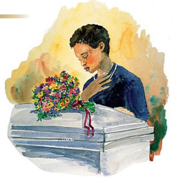
மரணத்தில் தேவனிடத்திற்குத் திரும்புகிற ஆவியைக்குறித்த எந்த மாமும் இல்லை. உயிர் மூச்சே அது.

பதில்: மரணத்தில் தேவனிடம் திரும்பும் ஆவி அவர்களுடைய சுவாசமே. ஒரு நபர் மரித்தபின்பு அவருடைய “ஆவிக்கு” உயிர் இருப்பதாகவோ அறிவு இருப்பதாகவோ அல்லது உணர்வு இருப்பதாகவோ தேவனுடைய புத்தகத்தில் எங்கும் குறிப்பிடப்படவில்லை. அது “மூச்சுக்காற்றே” ஒழிய வேறு ஒன்றுமில்லை.