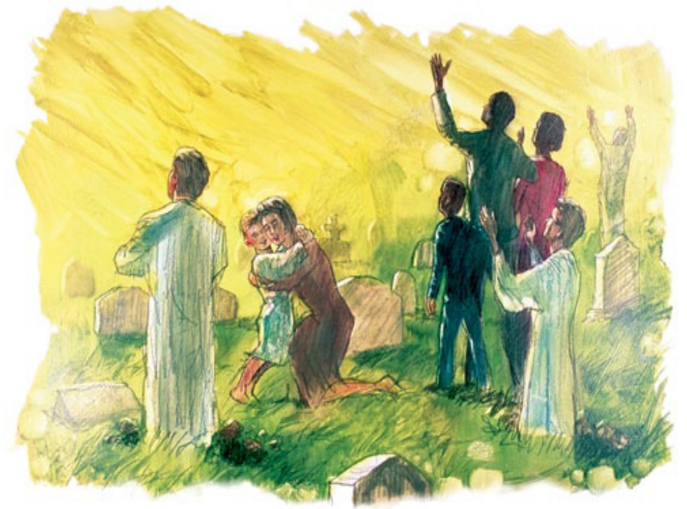
தேவனுடைய இராஜ்யத்தில் ஒருவரும் ஒருபோதும் மரிக்கமாட்டார்கள். சாத்தானின் அழிவோடு மரணம் முடிவிற்கு வரும்.