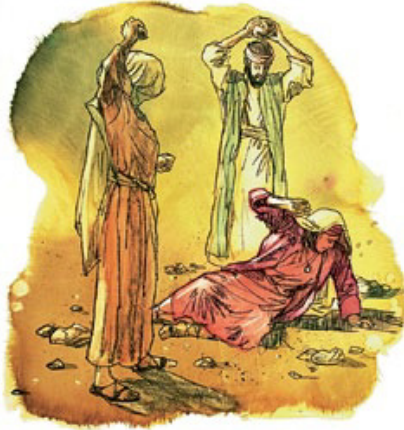
மரித்தவர்களோடு தொடர்புகொள்ளும் வல்லமை கொண்டிருப்பதாகக் கூறினவர்கள் மோசேயின் காலத்தில் கல்லெறிந்து கொல்லப்பட்டனர்.

பதில்: குறிசொல்லுகிறவர்களும், அஞ்சனம் பார்க்கிறவர்களும் (மரித்தவர்களோடு தொடர்பு கொள்ளுவதாகச் சொல்லுகிறவர்கள்) கல்லெறிந்து கொல்லப்பட்டவேண்டும் என்று ஆண்டவர் வலியுறுத்தினார். மரித்தவர்கள் உயிரோடிருக்கிறார்கள் என்கிற பொய்போதனையை தேவன் எவ்விதம் பார்க்கிறார் என்று இது காண்பிக்கிறது.