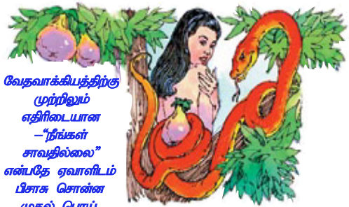
வேதவாக்கியத்திற்கு முற்றிலும் எதிரிடையான -“நீங்கள் சாவதில்லை” என்பதே ஏவாளிடம் பிசாசு சொன்ன முதல் பொய்.

பதில்: அவர்களுக்கு பலனளிக்கப்படும். அவர்கள் எழுப்பப்பட்டு, சாகாத சரீரங்கள் கொடுக்கப்பட்டு, ஆகாயத்தில் ஆண்டவரைச் சந்திக்கும்படி எடுத்துக்கொள்ளப்படுவார்கள். மரிக்கும்போதே மக்கள் பரலோகத்திற்கு எடுத்துக்கொள்ளப்படுவார்களானால், உயிர்த்தெழுதல் அர்த்தமற்றதாக இருக்கும்.