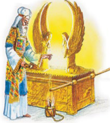
கிருபாசனமுன்பு ஆசாரியன் செய்த ஊழியம் பரலோகத்தில் நமக்காக இயேசு செய்யும் ஊழியத்தை எடுத்துக்காட்டியது.

தேவனுடைய பிரபஞ்சத்தின் தலைமையகமாகிய பரலோக ஆசரிப்புக் கூடாரத்தின் மெய்யான பாவநிவாரண சம்பவங்களை இந்த ஐந்து அடையாளமான படிகளும் காட்டுகின்றன. மேலே கொடுக்கப்பட்ட அடையாளங்கள் கீழே இருக்கும் மெய்யான சம்பவங்களின் ஒப்புமைகளே. தேவன் எவ்விதம் இந்த மாபெரும் பாவநிவாரண சம்பவங்களை தெளிவாக அடையாளப்படுத்தியிருக்கிறார் என்பதை கவனியுங்கள்.