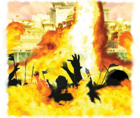
பரலோகத்திலிருந்து வரும் அக்கினி பாவத்தையும் பாவிக்கையும் நித்திபத்திற்குமாக அழிக்கும்.

பதில்: வானத்திலிருந்து வரும் அக்கினி துன்மார்க்கர்மேல் விழுகிறது. இந்த அக்கினி பாவத்தையும் பாவிக்கையும் பிரபஞ்சத்திலிருந்து முழுமையாக அழிக்கும். (நகர அக்கினியைக் குறித்த விவரங்களுக்கு பாடம் 11 படிக்கவும்.) இது தேவனுடைய மக்களுக்கு நிஜமாகவே மிக ஆழ்ந்த துக்கமும் வேதனையும் நிறைந்த நேரமாயிருக்கும். தாங்கள் வருடங்களாக நேசித்திருந்து பாதுகாத்திருந்தவர்களுக்காக தூதர்கள் பெரும்பாலும் கண்ணீர் சிந்துவார்கள். கிறிஸ்துதாமும் சந்தேகத்திற்கிடமின்றி தாம் நேசித்திருந்து நீண்ட காலம் போராடின மக்களுக்காக கண்ணீர் விடுவார். அந்த பயமுறுத்தும் மணித்துளிகளில் பாவத்தின் பயங்கர விலையைக்குறித்த நம்முடைய அன்பான பிதாவாகிய தேவனின் வேதனை விவரிக்கக்கூடாததாயிருக்கும்.