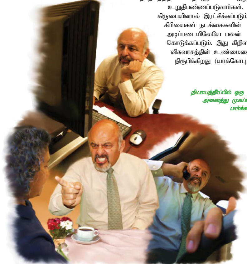
நியாயத்தீர்ப்பில் ஒரு நபருடைய அனைத்து முகப்பும் திருப்பிப் பார்க்கப்படும்.

பதில்: இரகசிய நினைவுகளும் செயல்களும் உட்பட, வாழ்க்கையின் ஒவ்வொரு விவரமும் திருப்பிப் பார்க்கப்படும். இதனால் இந்த முதல் கட்ட நியாயத்தீர்ப்பு நுட்ப நியாய விசாரணை என்று அழைக்கப்படுகிறது. கிறிஸ்தவர்களாக தங்களை அழைத்துக்கொண்டவர்களில் யார் யார் இரட்சிக்கப்படுவார்கள் என்பதை நியாயத்தீர்ப்பு உறுதிப்படுத்தும். இந்த வருகைக்கு முந்தைய நியாயத்தீர்ப்பில் பங்கெடுக்கக்கூடாத அத்தனைபேரும் சந்தேகத்திற்கிடமின்றி இரட்சிப்பை இழந்தவர்களாக