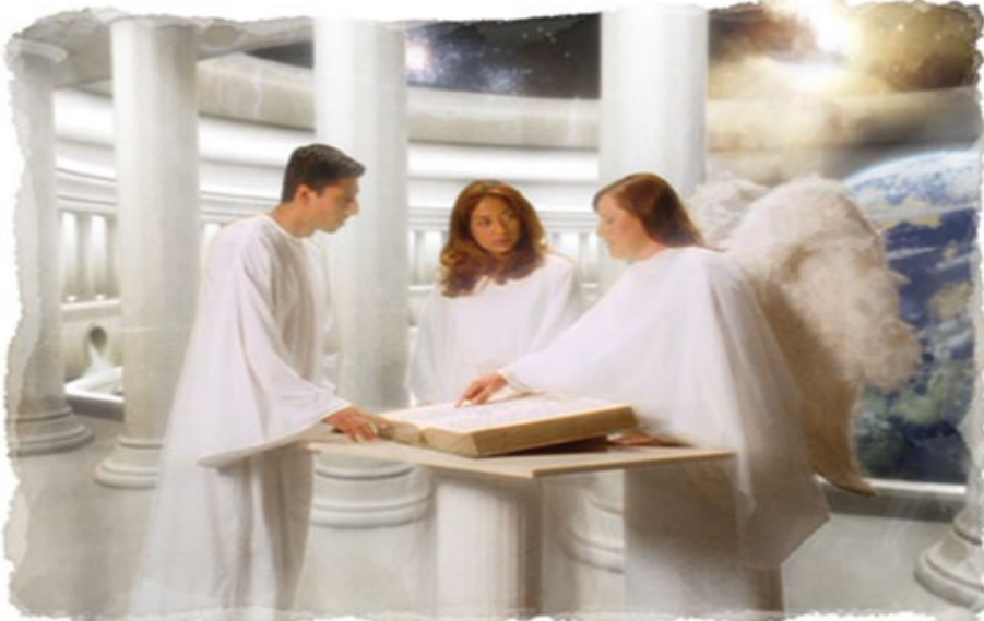
யுகங்கள் அனைத்திலும் வாழ்ந்த தேவனுடைய பரிசுத்தவான்கள் இரண்டாவது கட்ட நியாயத்தீர்ப்பில் பங்கெடுப்பார்கள்.

தாங்கள் மிக அதிகம் நேசித்திருந்து கொலைசெய்யப்பட்ட தங்களுடைய மகன் பரலோகத்தில் இல்லையென்கிறதை ஒரு குடும்பம் காண்கிறது. ஆனால் கொலை செய்தவன் பரலோகத்தில் இருக்கிறான்! சந்தேகத்திற்கிடமின்றி அவர்களுக்கு சில பதில்கள் கொடுக்கப்பட வேண்டும். இந்த இரண்டாம் கட்ட நியாயத்தீர்ப்பு நீதிமன்களுடைய அனைத்து கேள்விகளுக்கும் பதிலளிக்கும். இழந்துபோன (சாத்தானும் அவனுடைய தூதரும் உட்பட) ஒவ்வொரு நபருடைய வாழ்க்கையும் மிகவும் கவனமாக நீதிமன்களால் திருப்பிப் பார்க்கப்படும். ஒவ்வொருவருக்கும் பலனாக கொடுக்கப்பட்ட இயேசுவின் தீர்மானத்தை அவர்கள் முழுமையாக ஏற்றுக்கொள்வார்கள். நியாயத்தீர்ப்பு வெறும் தன்னிச்சையான செயலாக இல்லாமல், இயேசுவையோ அல்லது வேறொரு அதிபதியையோ சேவிக்கும்படி மக்கள் ஏற்கனவே எடுத்த தீர்மானத்தை உறுதியாக்குவதே என்பது அனைவருக்கும் வெளிப்படையாகும் (வெளி. 22:11,12). (ஆயிர வருடங்களைக்குறித்து பாடம் 12ல் பார்க்கவும்).