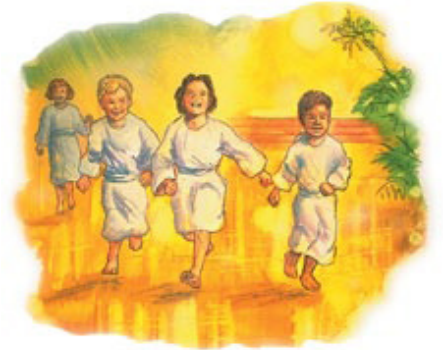
நியாயத்தீர்ப்பிற்குப்பின் பாவம் என்றென்றும்மாசென்றுபோயிருக்கும். நித்தியத்திற்கும் பரிசுத்தவான்கள் பாதுகாப்பாயிருப்பார்கள்.

12. நீங்கள் தேவனை உங்கள் வாழ்க்கையில் நுழையுமாடி வருந்தி அழைத்து, உங்களுடைய தங்க அனுமதிப்பீர்களானால், பரலோக நியாயத்தீர்ப்பில் உங்களை விடுதலைபண்ணுவதாக அவர் வாக்குக் கொடுக்கிறார். உங்கள் வாழ்க்கையில் நுழைய இன்றைக்கு அவரை வருந்தி அழைக்கிறீர்களா?