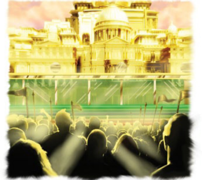
துன்மார்க்கர் பரிசுத்த நகரத்தை தாக்க முயற்சிப்பார்கள்.

பதில்: முன்றாவது கட்ட நியாயத்தீர்ப்பு வெளிப்படுத்தல் 20ல் கொடுக்கப்பட்டுள்ள ஆயிர வருட அரசாட்சிக்குப்பின், இயேசு பரிசுத்த நகரத்தோடு பூமிக்குத் திரும்பினபின்னர் நடக்கும். பிசாசும் அவனுடைய தூதரும் உட்பட இதுவரை வாழ்ந்திருந்த துன்மார்க்கர் அதில் இருப்பார்கள். ஆயிர வருடங்களின் முடிவில் அனைத்து யுகங்களிலும் வாழ்ந்திருந்த துன்மார்க்கர் உயிரோடு எழுப்பப்படுவார்கள் (வெளிப்படுத்தல் 20:5). சாத்தான் உடனடியாக அவர்களை வஞ்சிக்க வல்லமையாக பிரச்சாரம் பண்ணுவான். பரிசுத்த நகரத்தை பிடித்துவிடலாம் என்று பூமிபிலிருக்கும் அனைவரையும் நம்பவைப்பதில் அவன் ஆச்சரியப்படும்விதமாக வெற்றியடைகிறான்.