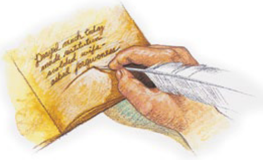
நியாயத்தீர்ப்பில் உபயோகிக்கப்படும் சான்றுகள் பரலோகப் புத்தகங்களிலிருந்து வருகின்றன.

இந்த நியாயத்தீர்ப்பு தேவனுக்கு அறிவிப்பதற்காக அல்ல. அவருக்கு ஏற்கனவே முழுவதும் தெரியும் (2 தீமோத்தேயு 2:19). பாவத்தினால் தரந்தாழ்ந்துபோன உலகத்தின் அனைத்து இடங்களிலுமிருந்து மீட்கப்பட்டவர்கள் பரலோகத்திற்கு வருவார்கள். மீண்டும் பாவத்தை துவக்கக்கூடிய எவரையும் தேவனுடைய இராஜ்யத்திற்குள் அனுமதிப்பதற்கு தேவதூதர்களும் விழுந்துபோகாத உலகத்தின் குடிகளும் மிகவும் தயங்குவார்கள். எனவே இந்த நியாயத்தீர்ப்பு மீட்கப்பட்டவர்களுடைய வாழ்க்கையின் ஒவ்வொரு குறிப்பையும் அவர்களுக்குக் காண்பித்து, ஒவ்வொரு கேள்விக்கும் பதிலளிக்கும். தேவன் நியாயமற்றவர், இரக்கமற்றவர், அன்பற்றவர், உண்மையற்றவர் என்று சொல்லுவதே எப்போதும் சாத்தானுடைய மெய்யான நோக்கமாபிடுக்கிறது. தேவன் பாவிகளிடம் எவ்விதம் மிக அதிக பொறுமையோடிருந்தார் என்கிறதை அண்ட சராசரத்திலிருக்கும் அனைவரும் தாங்களாகவே காணவேண்டுமென்பதை அவனுடைய குற்றச்சாட்டு இன்னும் அதிக அவசியமாக்குகிறது. தேவனுடைய குணத்தை நிரூபிப்பதே நியாயத்தீர்ப்பின் முதன்மை நோக்கம் (வெளிப்படுத்தல் 11:16-19; 15:2-4; 16:5,7; 19:1,2; தானியேல் 4:36,37). தேவன் நியாயத்தீர்ப்பை நடத்துகிற விதத்தைக்குறித்து அவருக்கு எவ்விதம் துதியும் மகிமையும் கொடுக்கப்படுகிறது என்பதை கவனியுங்கள்.