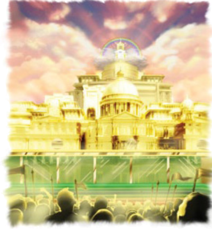
நகரத்தைத் தாக்கும் திட்டத்தை நியாயத்தீர்ப்பின் முன்றாம் கட்டம் தடுக்கும்.

சுடியியில் ஒரு அசைவு வருகிறது. தேவன் தன்னிடம் மிக நேர்மையாக நடந்துகொண்டார் என்கிறதை முழுங்காலில் விழுந்து அறிக்கையிட்டு, தான் செய்த குற்றத்தை ஒரு ஆத்துமா வெளிப்படையாக ஒத்துக்கொள்ளுகிறது. அவனுடைய சொந்த பிடிவாதமான பெருமையே பதில் தராதபடி அவனை தடுத்திருந்தது. இப்போது ஒவ்வொரு பக்கத்திலும் மக்களும் தீய தூதர்களும்