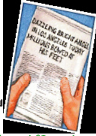
கடைசி காலத்திலே சாத்தானுடைய வஞ்சிக்கும் வல்லமை மிகப் பெரியதாக இருக்கப்போவதினால் ஏறக்குறைய முழு உலகமும் அவனைப் பின்பற்றும்.

அவன் மூன்றிலொருபங்கு தூதரையும் (வெளிப்படுத்தல் 12:3-9), ஆதாமையும் ஏவாளையும் (ஆதியாகமம் 3), நோவாவின் நாட்களில் எட்டுபேரைத் தவிர மற்ற அனைவரையும் (1 பேதுரு 3:20) நம்பவைத்தான். இரட்சிப்பை இழந்தவர்களை இரட்சிக்கப்பட்டவர்களென்று உணரச்செய்தான் (மத்தேயு 7:21-23). ஏறக்குறைய முழு உலகமும் அவனைப் பின்பற்றும் (வெளிப்படுத்தல் 13:3). சிலரே இரட்சிக்கப்படுவார்கள் (மத்தேயு 7:14; 22:14).