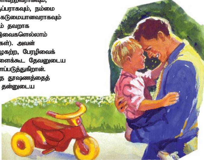
நமது பிதாவாகிய தேவன், பூலோக தகப்பன்மார்கள் தங்கள் பிள்ளைகளை நேசிப்பதைக்காட்டிலும் மிக அதிகமாக நம்மை நேசிக்கிறார். தமது புதிய இராஜ்யத்திற்குள் நம்மை ஏற்றுக்கொள்ள அவர் எதிர்பார்ப்போடு காத்திருக்கிறார்.

மக்களை மிகவும் அதிக சந்தோஷப்படுத்துவதற்கு அவர்களுக்காக நமது பரலோகப்பிதா கற்பனைக்கு எட்டாத நித்திய இல்லத்தை ஆயத்தம் செய்திருக்கிறார். நமக்காக அவர் வைத்திருக்கிறவைகளுக்கு நம்முடைய எந்த கற்பனையும் ஈடாகாது. விரைவில் நடக்கவிருக்கிற மகிழ்ச்சியான வீடு திரும்பலில் தமது பிள்ளைகளை வரவேற்கும்படி அவர் ஏக்கத்தோடு காத்திருக்கிறார். அவருடைய வார்த்தையை எடுத்துச் சொல்லி, நாம் ஆயத்தப்படுவோம். குறிப்பிட்ட நேரத்தை நோக்கி கடிக்காரம் சுழல துவங்கிவிட்டது.