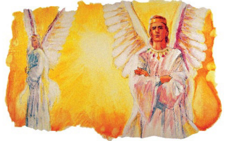
லூசிபர் தேவனால் உண்டாக்கப்பட்ட பரலோகத் தூதன்; அவன் ஞானத்திலும் அழகிலும் பூரணமானவன்; அவன் தேவனுடைய சிங்காசனத்திற்கு அடுகில் நின்றுருந்தான்.

3:9). லூசிபர் காப்பாற்றுகிறதற்காக அபிஷேகம் பண்ணப்பட்ட கேருப்-ஒரு தூதன். ஒரு பெரிய தூதன் தேவனுடைய சிங்காசனத்தின் வலதுபக்கத்திலும், மற்ற ஒரு தூதன் தேவனுடைய சிங்காசனத்தின் இடதுபக்கத்திலும் நின்றுருந்தனர் (சங்கீதம் 99:1). மிகவும் உயர்த்தப்பட்ட தூதர் தலைவர்களில் லூசிபர் ஒருவனாயிருந்தான். லூசிபரின் அழகு குறைவற்றதும் திகைப்பூட்டுகிறதாயிருந்தது. அவனுடைய ஞானம் பூரணமானதாயிருந்தது. அவனுடைய பிரகாசம் பிரமிப்பூட்டுகிறதாயிருந்தது. எசேக்கியேல் 28:13-ன்படி அவனுடைய தொண்டை முன்னணி இசைக்கலைஞனைப்போல இருப்பதற்காக விசேஷமாக ஆயத்தப்படுத்தப்பட்டதென்று தோன்றுகிறது. அவன் பரலோகப் பாடல் குழுவை நடத்தி வந்ததாக சிலர் எண்ணுகின்றனர்.