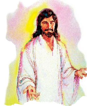
பாவத்தின் அழிவை இயேசு சாத்தியமாக்கினார்.

இரண்டாவது: பாவத்தையும் பாவிக்களையும், பிசாசையும் அவனுடைய தூதரையும் முழுமையாகவும் முடிவாகவும் அழிப்பதினால் பாவம் அண்ட சராசரத்திலிருந்தும் நீக்கப்படும். தேவன் இதை உறுதியாகச் சொல்லியிருக்கிறார். இந்த பிரபஞ்சத்தைத் தீட்டுப்படுத்த பாவம் என்றுமே இனி எழும்பாது.