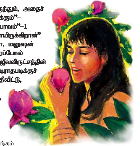
ஆதாமும் ஏவாளும் தடை செய்யப்பட்ட கனியை உண்டினால் தேவனுக்குக் கசப்பான எதிரியாக இருந்த சாத்தானோடு கூட்டணி வைத்தனர்.

பதில்: தேவன் கொடுத்திருந்த கட்டளைகளுள் ஒன்றை நேரடியாக நிராகரித்ததினால், அந்தப் பழத்தை உண்டது பாவமே. அது தேவனுடைய பிரமாணத்திற்கும் அதிகாரத்திற்கும் எதிரான வெளிப்படையான கலகமாயிருந்தது. தேவனுடைய பிரமாணங்களில் ஒன்றை நெகிழ்த்தினால் ஆதாமும் ஏவாளும் தேவனுடைய சத்துருவாயிருந்த சாத்தானோடு தங்களை இணைத்துக்கொண்டு, இவ்விதம் தேவனுக்கும் தங்களுக்குமிடையே ஒரு பிரிவினையைக் கொண்டுவந்தனர். அந்தத் தம்பதியினர் பாவம் செய்தபிறகு ஜீவவிருட்சத்தின் கனியை புசிப்பார்கள் என்றும், இவ்விதம் நித்தியமாக வாழும் பாவிகளாவார்கள் என்றும் சாத்தான் எதிர்பார்த்திருந்தான். ஆனால் அப்படிப்பட்ட துன்பத்தைத் தவிர்ப்பதற்காக தேவன் அவர்களை தோட்டத்திலிருந்து வெளியேற்றினார்.