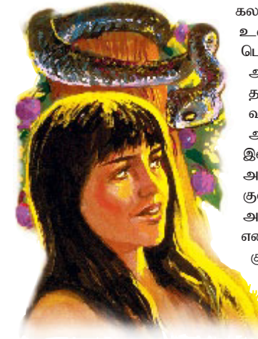
சாத்தான் பேசக்கூடிய சர்ப்பத்தின் உருவத்தை எடுத்து தடைசெய்யப்பட்ட கனியைப் புசிக்கும்படியாக ஏவாளை நம்பவைத்தான்.

கலந்து ஏவாளிடம் சொன்னான். பகுதி சத்தியத்தை உள்ளடக்கிய பொய்களே மிகவும் வல்லமையான பொய்களாயிருக்கிறது. பாவத்திற்குப்பிறகு தீமையை அறிந்துகொள்வார்கள் என்பது உண்மைதான். தேவன் தமது அன்பினைமீத்தம் மனவேதனை, வருத்தம், துன்பம், வலி, மற்றும் மரணம் போன்றவைகளைக் குறித்த அறிவை அவர்களிடமிருந்து விலக்கி வைத்திருந்தார். சாத்தான் இன்று செய்வதைப்போலவே அன்றும் தீமையைக்குறித்த அறிவை கவர்ச்சியானதாகத் தோன்றச்செய்தான். தேவனுடைய குணத்தைத் தவறாக புரிந்துகொண்டாலொழிய அப்படியப்பட்ட அன்பான தேவனிடமிருந்து எவரும் விலகிச் செல்லமாட்டார்கள் என்பதை சாத்தான் அறிந்திருந்ததினால் அவருடைய குணத்தைத் தவறாக எடுத்துக்காட்ட பொய்களைக் கூறினான்.