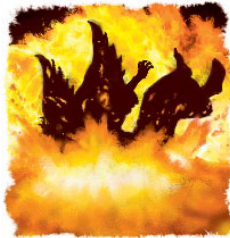
உலகத்தின் முடிவில் சாத்தான் அக்கினிக்கடலில் தள்ளப்படுவான். அது அவனை சாம்பலாக்கி, அவனை நித்தியத்திற்குமாக முடிவடையச்செய்யும்.

பதில்: சாத்தானுடைய வெற்றிவிதிதம் அதிர்ச்சியூட்டுமளவு உயர்ந்திருப்பதால், நம்பகூடாததாயிருக்கிறது. அவன் பரலோகத்தில் மூன்றிலொருபங்கு தூதர்களை வஞ்சித்தான். நோவாவின் காலத்தில் எட்டுபேரைத்தவிர மற்ற அனைவரையும் வஞ்சித்தான். இயேசு இரண்டாம் முறை வருவதற்குமுன்பாக தன்னைக் கிறிஸ்து என்று காட்டிக்கொண்டு சாத்தான் தோன்றுவான். அவனுடைய வஞ்சிக்கும் வல்லமை மிகப்பெரியதாக இருக்கப்போவதினால், அவனைப் பார்க்கும்படி செல்ல மறுப்பதிலேயே நம்முடைய ஒரே பாதுகாப்பு இருக்கும் (மத்தேயு 24:23-26). அவனைப் பார்க்கவோ அவன் சொல்வதைக் கேட்கவோ முழுமையாக மறுப்பீர்களெனில் இயேசு ஏமாற்றத்திலிருந்து உங்களை பாதுகாப்பார் (யோவான் 10:29).