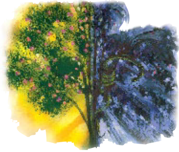
ஆதாமும் ஏவாணும் மரணதண்டனையின் கீழ் நன்மைதீமை அறியத்தக்க விருட்சத்தின் கனியைப் புசிக்கக்கூடாது.

“ஆனாலும் நன்மைதீமை அறியத்தக்க விருட்சத்தின் கனியைப் புசிக்கவேண்டாம். அதை நீ புசிக்கும் நாளில் சாகவே சாவாய்”-ஆதியாகமம் 2:17.