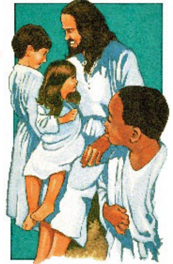
பரலோகத்திலிருக்கும் தேவனுடைய பிள்ளைகள் பாவத்திலிருந்து எந்நாளும் பாதுகாக்கப்பட்டிருப்பார்கள். அது மீண்டும் ஒருபோதும் எழும்பாது.

பதில்: தமது வாழ்க்கை, மரணம், உயிர்த்தெழுதலின் வழியாக பாவத்தை ஒழிப்பதை இயேசு உறுதிப்படுத்தியிருக்கிறார்.