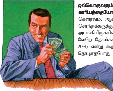
என் வாழ்க்கையில் முதலிடம் பெறுகிற எதுவும் நான் ஆராதிக்கிற தெய்வமாகிறது.

குறிப்பு: தொழுகை ஏன் அவ்வளவு பெரிய காரியமாயிருக்கிறது? தேவனுக்கும் சாத்தானுக்குமிடையே நடந்துகொண்டிருக்கிற யுத்தத்தில் தொழுகையே முக்கியக் காரணி. மகிழ்ச்சியாக இருக்கும்படியாக மக்கள் உண்டாக்கப்பட்டனர். தேவனை மாத்திரம் தொழும்போதுதான் மகிழ்ச்சியாக இருக்கமுடியும். பரலோகத்தில் இருக்கிற விழுந்துபோகாத தூதர்களைக்கூட தொழக்கூடாது (வெளிப்படுத்தல் 22:8,9). அனைவரும் தன்னை ஆராதிக்கவேண்டுமென்று சாத்தான் ஆதியில் விரும்பினான். நூற்றாண்டுகளுக்குப்பின்னர் இயேசுவை அவன் வணாந்தரத்தில் சோதித்தபோதும் தொழுகையே மையக்காரியமாயிருந்தது (மத்தேயு 4:8-11). இந்தக் கடைசி நாட்களில் தம்மை வணங்கும்படி தேவன் அனைத்து மக்களையும் அழைக்கிறார் (வெளிப்படுத்தல் 14:6,7). இது சாத்தானுக்கு வெறி ஏற்படுத்துவதினால், தன்னை வணங்கும்படி மக்களை பலவந்தப்படுத்த அவன் முயற்சிப்பான். தொழாதபட்சத்தில் கொலையும் செய்வான் (வெளிப்படுத்தல் 13:15).