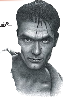
பிசாசு என்று சொல்லப்படுகிற சாத்தானிடம் பாவம் துவங்கியது.

பதில்: பிசாசு என்று அழைக்கப்படுகிற சாத்தான்தான் பாவத்திற்குக் காரணமானவன். வேதவாக்கியங்கள் இல்லாத பட்சத்தில் தீமையின் துவக்கம் விளக்கப்படாமலேயே இருந்திருக்கும்.