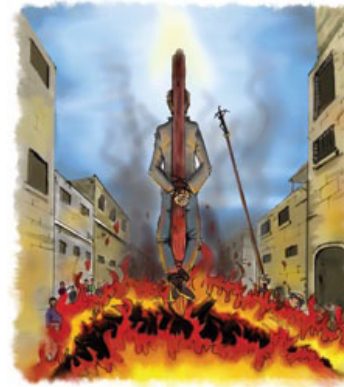
போப்புமார்க்கத்தின் உபத்திரவ காலத்தில் இலட்சக்கணக்கான கிறிஸ்தவர்கள் மரித்தனர்.

போப்புமார்க்கத்தைக் குறித்து: “Listening post” ஆக (கேட்கும் இடமாக) இருப்பதில் வாட்டி கனுக்கு நிகரில்லை என்று அமெரிக்க தூதுவர் கூறுகிறார் (120). உலகத்தில் எவ்விடத்திலும் திங்கட்கிழமை என்ன நடக்கும் என்பதை சனிக்கிழமையிலேயே வாட்டிகள் அறியும் (439). உலகளாவிய ஆட்சிக்கு போப்பு அமைப்பு இப்போது ஆயத்தமாயுள்ளது (143). காயம் சொஸ்தமடையுந்து தேசங்களின் கவனமெல்லாம் வாட்டிகளின்மேல் இருக்கிறதென்பது வெளிப்படையாகத் தெரிகிறது. எனவே இந்த குறிப்பும் போப்புமார்க்கத்திற்குப் பொருந்துகிறது.