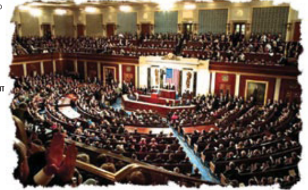
ஞாயிற்றுக்கிழமை ஆராதனையை வலியுறுத்தும் சட்டங்கள் இயற்றப்படும்போது அதோடு இணைந்துபோகிறவர்கள் மிருகத்தின் முத்திரையை பெற்றுக்கொள்வார்கள்.

இயேசுவை பின்பற்றி அவருடைய சத்தியத்திற்குக் கீழ்ப்படிகிறவர்கள் அவருடைய ஓய்வநாளை பரிசுத்தமாக ஆசரித்து அவருடைய முத்திரையைப் பெற்றுக்கொள்வார்கள். எதிர்காலத்தில் மிருகத்தின் முத்திரையைப் பெற மறுக்கப்போகிறவர்கள், இயேசுவினுடைய ஓய்வநாள் கொடியின் கீழாக இப்போதே வரவேண்டும். அவருக்குக் கீழ்ப்படிகிறவர்களுக்கு (அப்போஸ்தலர் 5:32) அவருடைய வல்லமை கிடைக்கும். அவரின்றி நம்மால் எதுவும் செய்யக்கூடாது (யோவான் 15:5). அவராலே எல்லாம் கூடும் (மாற்கு 10:27).