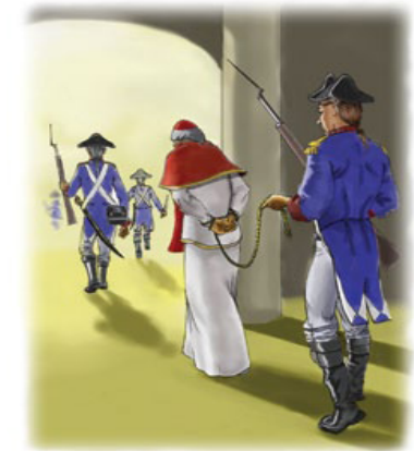
போப் ஆறாம் பயலை சிறைபிடித்ததினால் தளபதி டெர்தியர் போப்புமார்க்கத்தை சாவுக்கேதுவாக காயப்படுத்தினான்.

மிருந்து வாங்கவேண்டும் (வச. 2). இந்த வலுசாப்பத்தை அடையாளங்காண நாம் வெளி. 12க்கு போகவேண்டும். தேவனுடைய முடிவுகால சபை அங்கே தூய்மையான ஸ்திரீயாக காட்டப்பட்டுள்ளது. தீர்க்கதரிசனத்தில் ஸ்திரீ என்றால் சபை (எரே. 6:2; ஏசா. 51:16). வெளி. 12லிருக்கும் கடைசிகால தேவனுடைய சபையைக்குறித்த விளக்கமான பாடத்தை பாடம் 23ல் படிக்கலாம். வெளி. 17, 18ம் அதிகாரங் களில் வரும் விழுந்துபோன தாயாலும் அவளுடைய குமாரத்திகளாலும் அடையாளங்காட்டப் பட்டிருக்கிற விழுந்துபோன சபைகளைக்குறித்து பாடம் 22 பேசும். இந்த தூய்மையான ஸ்திரீ பிள்ளையோடிருந்து, பிரசவிக்கும் நேரத்தில் இருந்ததாக காட்டப்பட்டுள்ளது. வலுசாப்பமோ, பிள்ளை பிறந்ததும் அதை விழுங்கிப்போட நம்பிக்கையாயிருந்து, ஸ்திரீக்கருகில் பதுங்கியிருந்தது. எனினும் அந்த குழந்தை பிறந்து, வலுசாப்பத்துக்கு விலகி, தன்னுடைய ஊழியத்தை நிறைவேற்றி, பின்னர் பரலோகத்திற்கு ஏறிச்செல்லுகிறது. இந்தக் குழந்தை இயேசுவே! பெல்லேகே மின் குழந்தைகளை எல்லாம் அழிப்பதன்வழியாக ஏரோது குழந்தை இயேசுவைக் கொல்ல முயன்றான் (மத். 2:16). இவ்விதம் வலுசாப்பம் ஏரோதுவை இராஜாவாகக் கொண்டிருந்த அஞ்ஞான ரோம ராஜ்யத்தைக் குறிக்கிறது.