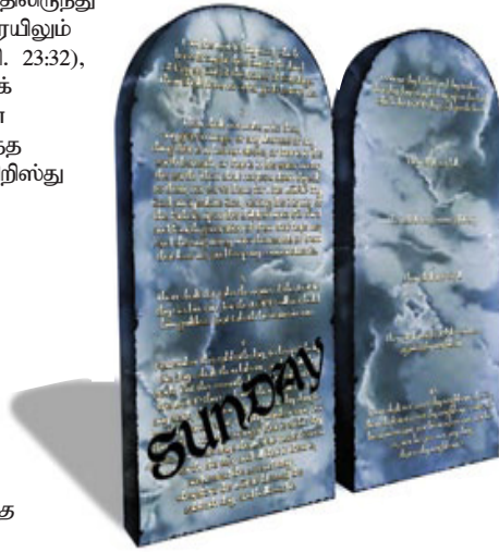
ஓய்வநாளை ஞாயிற்றுக்கிழமைக்கு மாற்றுவது, தேவனுடைய கற்பனையை மாற்றுகிற மிகவும் ஆபத்தான விஷயமாயிருக்கிறது.

“சனிக்கிழமை யூதர்களுடைய ஓய்வநாள், ஆனால் கிறிஸ்தவ ஓய்வநாள் ஞாயிற்றுக்கிழமைக்கு மாற்றப்பட்டிருக்கிறது என்று நீங்கள் என்னிடம் சொல்லலாம். அது எவரால் மாற்றப்பட்டது? சர்வ வல்லமையுள்ள தேவனின் வெளிப்படையான கட்டளையை மாற்றும் அதிகாரம் யாருக்கு இருக்கிறது? ஏழாம்நாளை பரிசுத்த நாளாக ஆசரிப்பாயாக என்று தேவன் பேசி சொல்லியிருக்க, இல்லை, நீங்கள் ஏழாம்நாளில் வேலை செய்து அனைத்துவிதமான உலக வர்த்தகங்களையும் செய்யலாம். ஆனாலும் அதற்குபதிலாக வாரத்தின் முதல் நாளை பரிசுத்தமாக ஆசரிக்கக்கூடவீர்கள் என்று சொல்லும் தைரியம் யாருக்கு இருக்கிறது. இது மிகவும் முக்கியமான கேள்வி. இதற்கு எவ்விதம் நீங்கள் பதிலளிப்பீர்கள் என்று எனக்குத் தெரியவில்லை. நீங்கள் புரொட்டஸ்டண்டுகளாயிருந்து, வேதாகமம் சொல்லுவதன்படியே செய்வோம் என்று சொல்லுகிறீர்கள். எனினும் ஏழு நாளில் ஒரு நாளை கைக்கொள்ளும் முக்கியமான காரியத்தில்