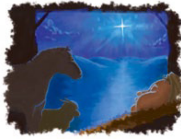
ஏரோது இராஜா இயேசுவை அவரது பிறப்பினோது விழுங்க அல்லது கொல்லப் பார்த்தான்.

மிருகத்தின் அங்கங்களாக கொடுக்கப்பட்டிருக்கின்றன. அவள் அவைகளுக்கு ஆவிக்குரிய ஆடையை போர்த்தி, கிறிஸ்தவ போதனைகளென்று உலகமுழுவதும் பரப்பினாள். இதற்கான சரித்திர ஆதாரத்தை பாருங்கள்: “ஒருவிதத்தில் அவள் (போப்புமார்க்கம்) ரோம சாம் ராஜ்யத்தை தன்னுடைய அமைப்பின் நகலாக எடுத்து, சாக்ரடீஸ், பிளேட்டோ, அரிஸ்டாட்டில் ஆகியோரின் தத்துவங்களைப் பாதுகாத்து—கனிகொடுக்க வைத்து, பார்பேரியன்களிடமிருந்தும் பைசான்டின ரோம சாம்ராஜ்யத்திலிருந்தும் கடன்வாங்கி, வெளியிலிருந்து எடுத்த அத்தனை ஆதாரங்களையும் முழுமையாக சீரணித்து, அவள் தானாகவே நிற்கிறாள்.” இந்த குறிப்பு போப்புமார்க்கத்திற்கு குறிப்பாக பொருந்துகிறது.