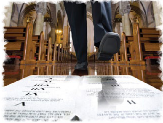
தமது பரிசுத்த நாளை மிதிப்பதை நிறுத்தப்படி தேவன் தமது மக்களைக் கேட்கிறார்.

வெளிப்படுத்தல் 14:9–12வரை வரும் மிருகத்தின் முத்திரையைக்குறித்த செய்தியைக் கொண்டுவந்த மூன்றாவது தூதனும் (வசனம் 9) உரத்த சத்தத்தோடு பேசுவதை கவனியுங்கள். சாதாரணமாக நினைத்துவிடாதபடிக்கு இந்த செய்தி மிக முக்கியமான செய்தி. இது வாழ்வா சாவா என்பதைக் குறித்தது. தாம் அழைக்கும்போது தம்முடைய ஆடுகள் அல்லது மக்கள் தமக்குப் பின்செல்லுவார்கள் (யோவான் 10:16,27) என்று இயேசு கூறுகிறார்.