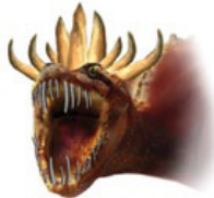
மிருகத்தின் 11 அடையாளங்களை வெளி. 13 கொடுக்கிறது.

பதில்: வெளி. 13:1-8, 16-18 வசனங்கள் மிருகத்தினுடைய 11 குணாதிசயங்களைக் காட்டுகின்றன. அவைகள்: