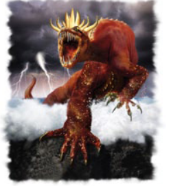
வெளி. 13ன் மிருகம் அந்திகிரிஸ்துவை அடையாளப்படுத்துகிறது.

எ. வல்லமையான மத பலம் (வசனம் 3,8). ஏ. தேவதூஷணத்தைக் குறித்த குற்றத்தில் இருக்கிறது (வசனம் 1,5,6). ஐ. பரிசுத்தவாங்கலோடு யுத்தம்ண்ணி மேற்கொள்கிறது (வச. 7). ஓ. 42 மாதங்கள் ஆட்சி செய்கிறது (வசனம் 5). ஔ. 666 என்கிற இரகசியமான எண்ணை கொண்டிருக்கிறது (வச. 18). இந்த குணங்களில் சிலது ஏற்கனவே அறிமுகமானதைப்போலத் தோன்று கிறதா? நிச்சயமாக! தானியேல் 7ன் அந்திகிரிஸ்துவைக்குறித்த முந்தைய பாடங்களில் இவற்றில் அநேகவற்றைப் பார்த்தோம். வெளி. 13ல் வரும் மிருகம், தானி. 7ல் போப்புமார்க்கம் என்று நாம் படித்த அந்திகிரிஸ்துவின் மற்றொரு தோற்றம்தான்.