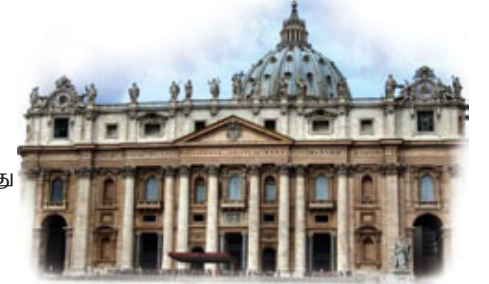
வாட்டிகளில் 100 நாடுகளுக்கும் மேலான பிரதிநிதிகள் இருக்கிறார்கள்.

மாதத்தில் போப் மரித்தார். “போப்பு இல்லாத பட்சத்தில் போப்புமார்க்கம் மரித்துவிடும் என்று பாதி ஐரோப்பா நினைத்தது.” 4 எனவே இந்த குறிப்பும் போப்புமார்க்கத்திற்கு பொருந்துகிறது.