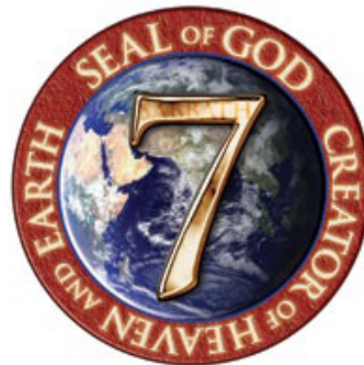
தேவனுடைய அதிகாரத்தின் சின்னம் அல்லது முத்திரை ஓய்வநாள்.

“நான் தங்களைப் பரிசுத்தம்பண்ணுகிற கர்த்தர் என்று அவர்கள் அறியும்படிக்கு, எனக்கும் அவர்களுக்கும் அடையாளமாய் இருப்பதற்கான என் ஓய்வநாட்களையும் அவர்களுக்குக் கட்டளையிட்டேன்”-எசேக்கியேல் 20:12; “அது என்றைக்கும் எனக்கும் இஸ்ரவேல் புத்திரருக்கும் அடையாளமாயிருக்கும்; ஆறுநாளைக்குள்ளே கர்த்தர் வானத்தையும் பூமியையும் உண்டாக்கி,”-யாத்திராகமம் 31:17.