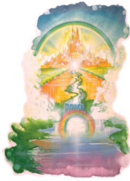
தேவனுடைய முத்திரை அல்லது சின்னத்தை தங்கள் நெற்றிகளில் பெற்றவர்கள் மாத்திரமே பரலோகத்தில் இருப்பார்கள்.

இ. இயேசுவை எல்லாவற்றிலும் முழுமையாக நம்பி, அவர் நடத்துமிடமெல்லாம் இன்றைக்கும் நித்தியத்திற்கும் அவரைப் பின்பற்றும் மக்கள் (வெளிப்படுத்தல் 14:4). இதைவிடுத்து வேறு வழியே இல்லை.