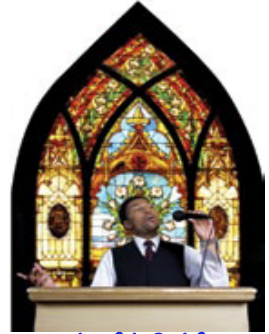
முத்தூதின் செய்தியை உலகமுழுவதும் போதிக்காத சபை தேவனுடைய கடைசிகால சபையாக இருக்கமுடியாது.

போலிகளையும் குறித்து எச்சரிக்கையாயிருங்கள்.