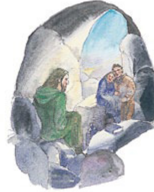
தேவனுடைய மக்கள் உபத்திரவத்திற்குத் தப்பும்படி பூமியின் தனிமையான இடங்களுக்கு ஓடினர்.

வெளி. 12 மற்றும் 14ல், இயேசு தமது கடைசிகால சபையை அடையாளம்காண ஆறு குறிப்புகளைக் கொடுக்கிறார். இந்த வேதபாடத்தின் மீதிபகுதியைப் படிக்கும்போது அவைகளை கவனித்துப்படியுங்கள்.