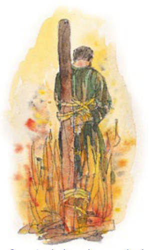
அநேக இலட்சக்கணக்கான மக்கள் சாத்தானுடைய உபத்திரவத்தில் உயிரோடு எரிக்கப்பட்டார்கள்.

பதில்: அவனால் இயேசுவை தனிப்பட்டவிதத்தில் தாக்கமுடியாததால், தனது உக்கிரத்தையும் உபத்திரவத்தையும் தேவனுடைய சபைமீதும் அவருடைய மக்கள்மீதும் அவன் காண்பித்தான்.