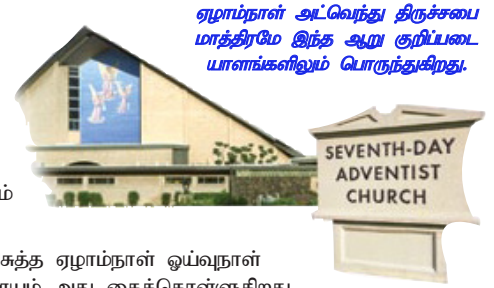
ஏழாம்நாள் அட்வெந்து திருச்சபை மாத்திரமே இந்த ஆறு குறிப்படையாளங்களிலும் பொருந்துகிறது.

இந்த ஆறு குறிப்படையாளங்களையும் நீங்களே பொருத்திப்பார்க்கவேண்டும் என்று இயேசு உங்களை அழைக்கிறார். இது எளிமையானது, இதில் தவறு செய்யமுடியாது.