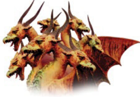
ஏழு தலைகளும் ரோம் அமைந்திருக்கிற ஏழு மலைகளை அடையாளப்படுத்துகின்றன. 10 கொம்புகள் பூமியிலுள்ள 10 நாடுகளை அடையாளப்படுத்துகின்றன.

பதில்: ஏழு தலைகளும் ரோம் அமைந்திருக்கிற ஏழு மலைகளை எடுத்துக்காட்டுகிறது (வெளி. 17:9,10). இதுவரையிலும் ஏழு தலைகளையும் பத்து கொம்புகளையுமுடைய மிருகத்தை நம் பாடவரிசையில் மூன்றுமுறை நாம் சந்தித்துவிட்டோம். (வெளி. 12:3; 13:1; 17:3).