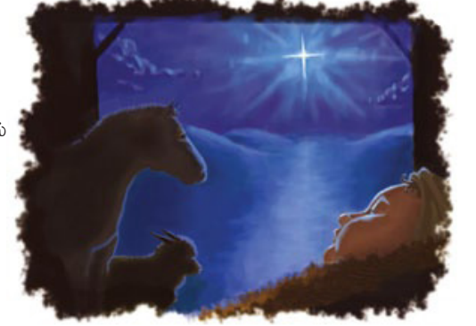
வெளி. 12ம் அதிகாரத்தில் குறிப்பிடப்பட்டிருக்கிற குழந்தை இயேசுவே.

பதில்: அந்த குழந்தை இயேசுவே. ஒருநாள் அவர் அனைத்து மக்களையும் இருப்புக்கோலால் ஆட்சிசெய்வார் (வெளி. 19:13–16; சங். 2:7–9). நமக்காக சிலுவையில் அறையப்பட்ட இயேசு மரித்தோரிலிருந்து உயிர்த்தெழுந்து பரலோகத்திற்கு ஏறினார் (அப். 1:9–11). நமது வாழ்க்கையிலிருக்கும் அவருடைய உயிர்த்தெழுதும் வல்லமை கிறிஸ்து தமது சபைக்குக் கொடுக்கிற அத்தியாவசிய ஈவுகளில் ஒன்று (பிலி. 3:10).