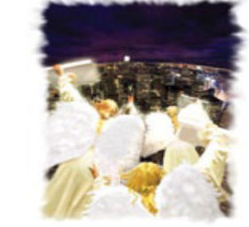
தேவனுடைய மீதமான சபை முத்தூதின் செய்திகளை உலகமுழுவதும் கொடுக்கவேண்டும்.

குறிப்பு: முடிவான இரண்டு குறிப்புகளும் இங்கே இருக்கின்றன. 5. தேவனுடைய கடைசிகால சபை உலகளாவிய ஊழியம் செய்கிற சபையாக இருக்கும். 6. அது வெளி. 14:6-14வரை வரும் முத்தூதின் செய்தியை போதித்துக்கொண்டிருக்கும்.