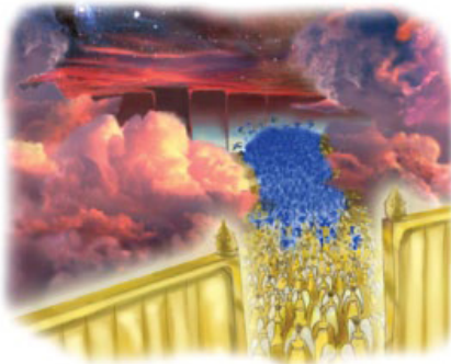
லாசிபரோடு பரலோகத்தைவிட்டு வெளியே தள்ளப்பட்ட கலகம் செய்த தூதர்களையே மூன்றில் ஒரு பங்கு நட்சத்திரங்கள் எடுத்துக்காட்டுகின்றன.

இ. “வானத்தின் நட்சத்திரங்களில் மூன்றில் ஒருபங்கு நட்சத்திரங்கள்,” பரலோகத்தில் லாசிபருடைய கலகத்திற்கு ஆதரவளித்து பின்னர் அவனோடு கூட வெளியே தள்ளப்பட்ட தூதர்களை எடுத்துக்காட்டுகிறது (வெளி. 12:9; லூக்கா 10:18; ஏசாயா 14:12).