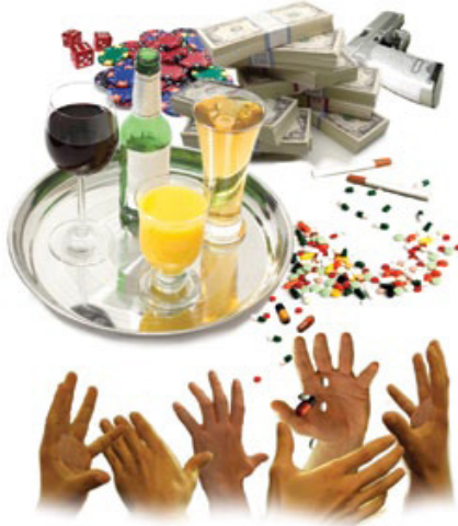
உலகத்திலுள்ளவைகளில் அன்புகூரும்போது நான் தேவனுக்கு சத்துருவாகிறேன்.