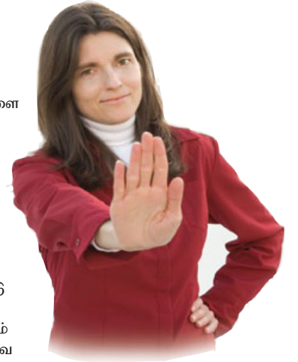
ஒரு கிறிஸ்தவன் உலகத்தின் காரியங்களை உறுதியாக எதிர்த்து நிற்கவேண்டும். இல்லாவிடில் சாத்தானால் வழிவிலக நடத்தப்படுவான்.

பதில்: “நீங்கள் இந்தப் பிரபஞ்சத்திற்கு ஒத்த வேஷ ந்தரியாமல்” (ரோமர் 12:2) என்று இயேசு கிறிஸ்தவர்களை எச்சரிக்கிறார். வேறுவிதமாகச் சொல்லப்போனால், உங்களைச் சுற்றியிருக்கும் உலகம், தான் விரும்பும் வகையில் உங்களை வடிவமைக்க விடாதிருங்கள் என்று பொருள்படும் (ஆங்கில பிலிப் மொழிபெயர்ப்பு இவ்விதம் கூறுகிறது). பிசாசு சமநிலையில் இருப்பவன் அல்ல. அவன் ஒவ்வொரு கிறிஸ்தவனையும் தொடர்ந்து நெருக்கிக்கொண்டிருக்கிறான். இயேசுவின்வழியாக (பிலி. 4:13) நான் உறுதியாய் பிசாசின் ஆலோசனைகளை எதிர்த்து நிற்கவேண்டும். அப்போது அவன் என்னைவிட்டு ஓடிப்போவான் (யாக். 4:7). என்னுடைய நடக்கையை பாதிக்கும் வேறு என்ன காரியத்திலும் என்னை வைக்கும் நிமிடத்தில்தானே நான் வழுவ ஆரம்பிக்கிறேன். கிறிஸ்தவ நடக்கை உணர்வுகளினாலோ அல்லது திரளானவர்களின் நடக்கையினாலோ தீர்மானிக்கப்படக்கூடாது. மாறாக, வேதவாக்கியங்களிலுள்ள இயேசுவின் வார்த்தைகளினால் தீர்மானிக்கப்படவேண்டும்.