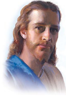
இயேசுவே வேதவாக்கியங்களின் மூலகர்த்தா.

பதில்: வேதாகமத்தின் தேவன் (பழைய ஏற்பாட்டின் தேவனும் கூட) எப்போதுமே இயேசு கிறிஸ்துதான். இயேசு இந்த உலகத்தை உண்டாக்கினார் (யோவான் 1:1-3,14; கொலோ. 1:13-17); பத்து பிரமாணங்களை எழுதினார் (நெகே. 9:6,13); இஸ்ரவேலரின் தேவனாயிருந்தார் (1 கொரி. 10:1-4); தீர்க்கதரிசிகளின் எழுத்துக்களையும் நடத்தினார் (1 பேதுரு 1:10,11). எனவே இயேசுகிறிஸ்துதான் வேதவாக்கியங்களின் மூலகர்த்தா.