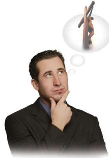
நம்முடைய எண்ணங்கள் செயல்களாக மாறுமாகையால், அவைகளை நாம் கவனமாக காவல் காக்கவேண்டும்.

பதில்: நம்முடைய எண்ணத்தை காவல் காக்கவேண்டும். ஏனெனில் எண்ணங்கள் நம் குணத்தை வடிவமைக்கின்றன. நம்முடைய ஒவ்வொரு எண்ணத்தையும் கிறிஸ்துவிற்கு கீழ்ப்படியச்செய்ய தேவன் நமக்கு உதவி செய்ய விரும்புகிறார் (2 கொரி. 10:5). அதேசமயம் உலகத்தை நம் எண்ணத்தில் கொண்டுவர சாத்தான் மிகவும் விடாப்பிடியாக முயற்சிக்கிறான். அதை நம்முடைய ஐந்து உணர்வுகள்வழியாக -விசேஷமாக பார்ப்பது மற்றும் கேட்பதின்வழியாகத்தான் செய்யமுடியும். அவனுடைய காட்சிகளையும் ஓசைகளையும் நம் மனதில் திணிக்கிறான். அவன் கொடுப்பவைகளை பார்க்கவோ அல்லது கேட்கவோ பிடிவாதமாக மறுக்காத பட்சத்தில், அழிவிற்கு நடத்துகிற விசாலமான பாதையில் அவன் நம்மை நடத்திவிடுவான். நாம் எதைப் பார்த்து எதை கேட்கிறோமோ, அதாக மாறுகிறோம் (2 கொரி. 3:18) என்று வேதாகமம் தெளிவாக கூறுகிறது.