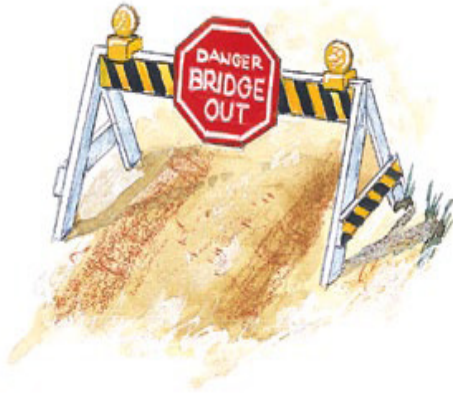
கிறிஸ்தவ வாழ்க்கைக்கான இயேசுவின் வேதாகம கொள்கைகள் பிசாசின் ஆபத்தான பாதைகளிலிருந்து நம்மை பாதுகாக்கின்றன.

ஆ. உலகத்தால் கறைபடாதபடி என்னை நான் வைத்துக்கொள்ளவேண்டும் (யாக்கோபு 1:27).