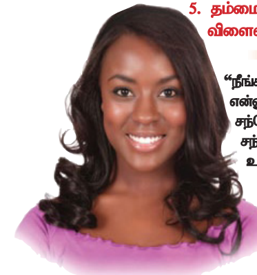
இயேசுவை பிரியப்படுத்துகின்ற காரியங்களைச் செய்வது ஒரு நபருக்கு மகிழ்ச்சியையும் நிறைவையும் கொண்டுவரும்.