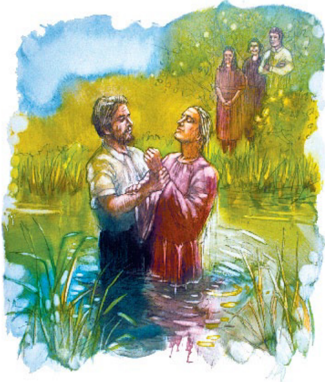
கிறிஸ்துவோடு என்னை இணைக்கிற திருமணச் சடங்கு ஞானஸ்நானமே.

நித்தியத்தியமாகத் தொடருவது என்று மூன்று குறிப்பான சம்பவங்களை உண்மையான விசுவாசியின் வாழ்க்கையில் ஞானஸ்நானம் அடையாளப்படுத்துகிறது. இந்த ஆவிக்குரிய இணைப்பு காலம் செல்லச் செல்ல, அன்பு தொடரும்வரையிலும் உறுதியும் இனிமையுமானதாக வளரும். எந்தத் திருமணத்திலும் அன்பு குறையுமானால், பரலோகம் நரகமாக மாற, அந்தக் குடும்பம் திருமண சட்டத்தின் கட்டாய கடமைகளினிமித்தம் வெறும் இயந்தரத்தனமாகவே ஒன்றாயிருக்கும். அதேபோல கிறிஸ்தவன் கிறிஸ்துவை முதன்மையாக நேசிப்பதை நிறுத்தும்போது, அவனுடைய மதம் கட்டுப்படுத்தும் சில சட்டங்களுக்காக இணைந்துபோகிற ஒரு இணக்கமாகவே இருக்கிறது.