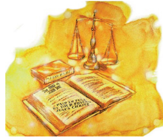
உங்களால் செலுத்தமுடியாததைச் செலுத்தி, கடனை நிவிர்த்தி பண்ணும்படி இயேசு ஜீவனைக் கொடுத்தார்.