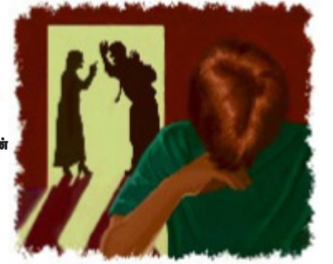
பெற்றோர்கள் கிறிஸ்தவர்களாக இருப்பதே அவர்கள் தங்கள் பிள்ளைகளுக்கு கொடுக்கக்கூடிய மிகவும் மதிப்பான பரிசு!