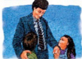
எதிர்த்து நிற்கிற பாவியை, அன்பான பரிசுத்தவானாக இயேசுவின் வல்லமை மாற்றுகிறது!

“இப்படியிருக்க, ஒருவன் கிறிஸ்துவாக்குள்ளிருந்தால் புதுச்சிருஷ்டியாயிருக்கிறான்; பழையவைகள் ஒழிந்துபோயின, எல்லாம் புதிதாயின”—2 கொரிந்தியர் 5:17.