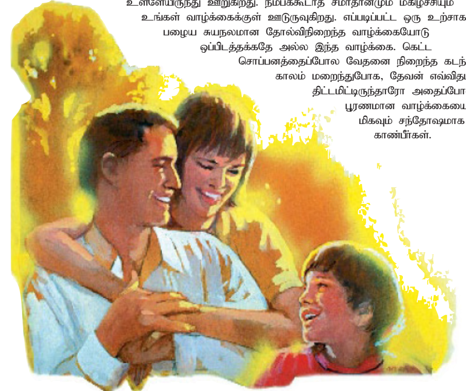
கிறிஸ்தவ இல்லத்தின் மகிழ்ச்சிக்கும் சந்தோஷத்திற்கும் பூமியிலுள்ள எந்தவொரு மகிழ்ச்சியும் ஈடாகாது!

உள்ளேயிருந்து ஊறுகிறது. நம்பக்கூடாத சமாதானமும் மகிழ்ச்சியும் உங்கள் வாழ்க்கைக்குள் ஊடுருவுகிறது. எப்படிப்பட்ட ஒரு உற்சாகம்! பழைய சுயநலமான தோல்விநிறைந்த வாழ்க்கையோடு ஒப்பிடத்தக்கதே அல்ல இந்த வாழ்க்கை. கெட்ட சொப்பனத்தைப்போல வேதனை நிறைந்த கடந்த காலம் மறைந்துபோக, தேவன் எவ்விதம் திட்டமிட்டிருந்தாரோ அதைப்போன்ற பூரணமான வாழ்க்கையை மிகவும் சந்தோஷமாக காண்பீர்கள்.