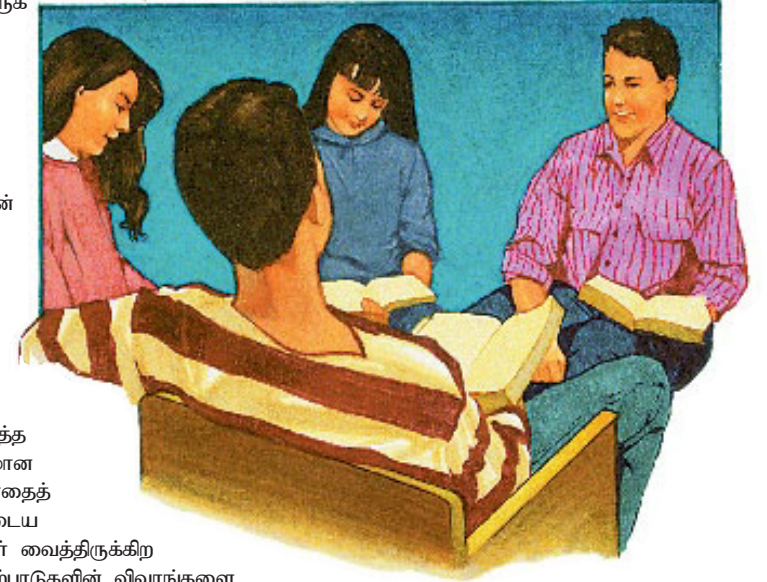
அந்த அன்பை நான் மற்றவர்களிடம் பகிர்ந்துகொள்ளும்போது கிறிஸ்துவிற்கான என்னுடைய அன்பு ஆழமாகிறது.

பதில்: எந்த அன்பின் உறவும் தொடர்பு குறையும் போது செழிக்காது. வேத தியானமும் ஜெபமும் உறவை வளர்ப்பதற்கு அத்தியாவசியமானவை. என்னுடைய ஆவிக்குரிய வாழ்க்கையை செழிப்பாக வைத்திருக்கும்படி நான் அனுதினமும் அவருடைய வார்த்தைகளைக் கட்டாயம் வாசிக்க வேண்டும். அது அவருடைய அன்பின் கடிதம். அவருடன் உரையாடுவது என்னுடைய பக்தியை ஆழப்படுத்தி, அவர் என்மேல் வைத்திருக்கும் கரிசனையைக் குறித்த சிலிர்ப்பூட்டும் ஆழமான அறிவிற்கு என் மனதைத் திறக்கிறது. என்னுடைய மகிழ்ச்சிக்காக அவர் வைத்திருக்கிற நம்பக்கடினமான ஏற்பாடுகளின் விவரங்களை அனுதினமும் நான் அறியும்போது ஆச்சரியமடைகிறேன்.