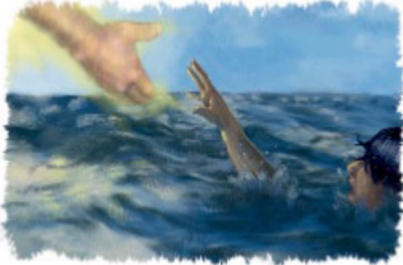
நீங்கள் பாவத்தில் முழுகிக்கொண்டிருக்கிறீர்களா? இயேசுவை அழைப்பீர்களானால் அவர் உங்களை மீட்டார்.

“இலவசமாய் அவருடைய கிருபையினாலே கிறிஸ்து இயேசுவின் மீட்பைக்கொண்டு நீதிமான்களாக்கப்படுகிறார்கள்”—ரோமர் 3:24; “மனுஷன் நியாயப்பிரமாணத்தின் கிரியைகளில்லாமல் விசுவாசத்தினாலேயே நீதிமானாக்கப்படுகிறான்”—ரோமர் 3:28.