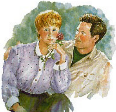
நீங்கள் மெய்யாகவே நேசிக்கிற ஒருவரை பிரியப்படுத்துவது உங்களுக்குக் கடினமல்ல.

பதில்: வேதாகமம் எப்போதும் கீழ்ப்படிதலை அன்பான உறவேடு பிணைத்திருக்கிறது. மறுபடியும் பிறந்த கிறிஸ்தவன் பத்துக்கற்பனைகளுக்குக் கீழ்ப்படிவதை சோர்வுண்டாக்கும் போராட்டமாகக் காண்பதில்லை. கிறிஸ்துவின் மீட்கும் மரணத்தினால் என்னுடைய கடந்தகாலப் பாவங்கள் அனைத்தும் மூடப்பட, எனக்குள் இருக்கும் வெற்றிகரமான வாழ்க்கையில்